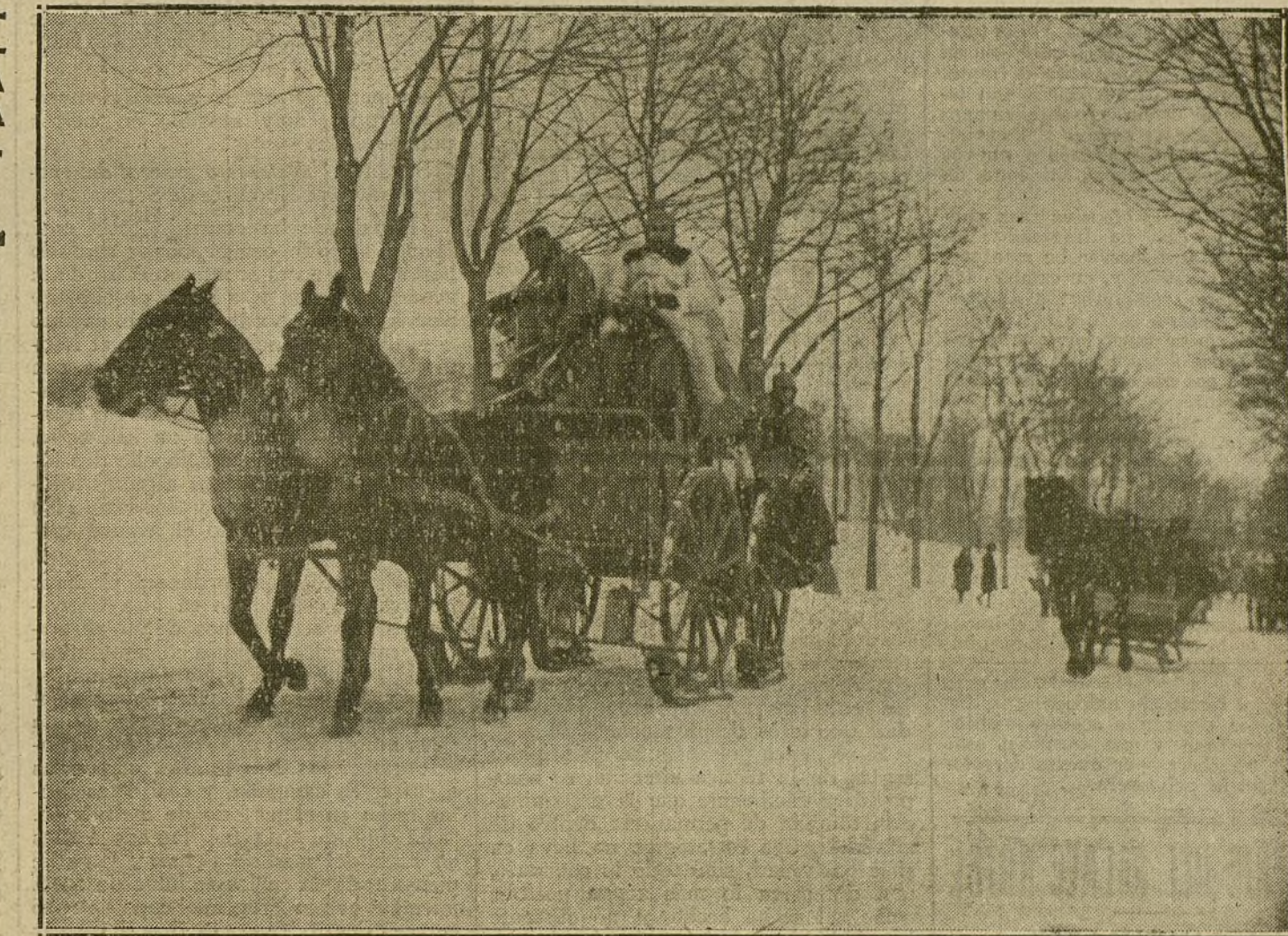
LA GUERRA EN ORIENTE.—Tropas alemanas utilizando «skis» y trineos durante un avance por la Polonia rusa.

Por ahora, el esfuerzo francés se limita á un conjunto de hechos aislados, y en alguna ocasión tuvieron pequeños éxitos parciales, el triunfo sigue siendo