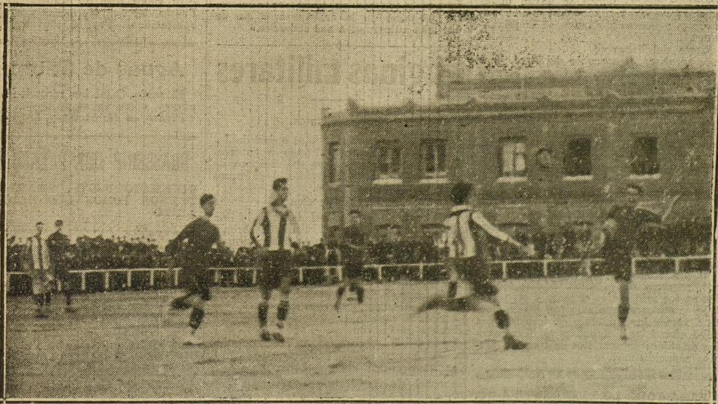
Una jugada del partido de «foot-ball» celebrado ayer entre el Club Deportivo de Barcelona y el equipo de la Sociedad Gimnástica Española, en el campo del Madrid F. C.

Para todo lo referente á publicidad francesa en LA TRIBUNA dirigirse á nuestra Agencia en París: rue Vivienne, 22.