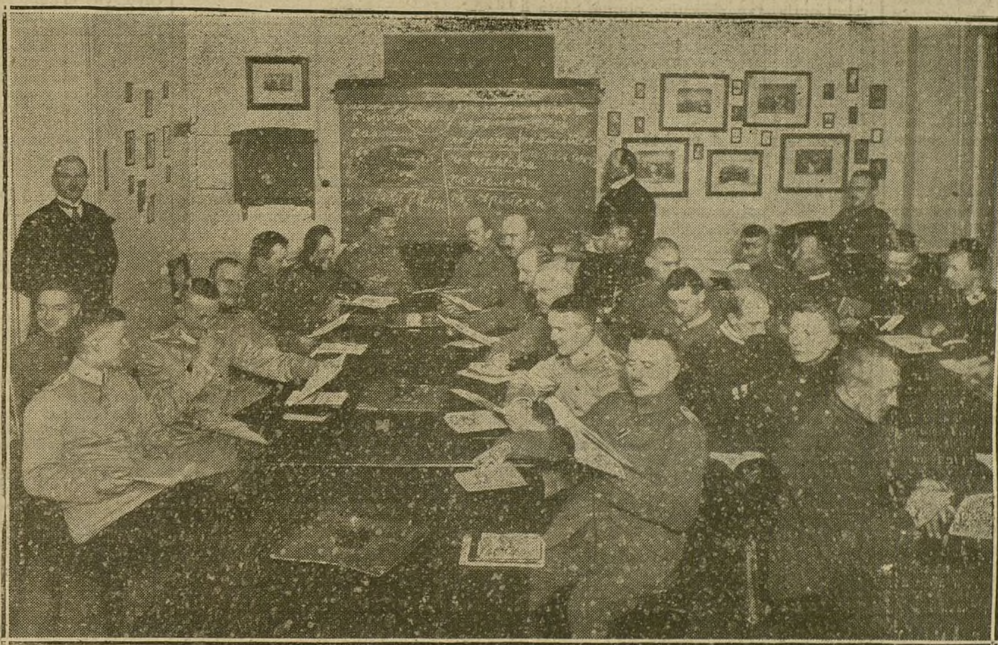
LA ORGANIZACION ALEMANA.—Oficiales, médicos y soldados alemanes, estudiando el ruso, en clases especiales, antes de marchar al teatro oriental de operaciones.

La ocupación de las tres islas no es más que el primer paso de la gran obra teatral iniciada por Inglaterra. Las dos primeras de estas islas no tienen gran importancia; pero Lemnos, con su puer-