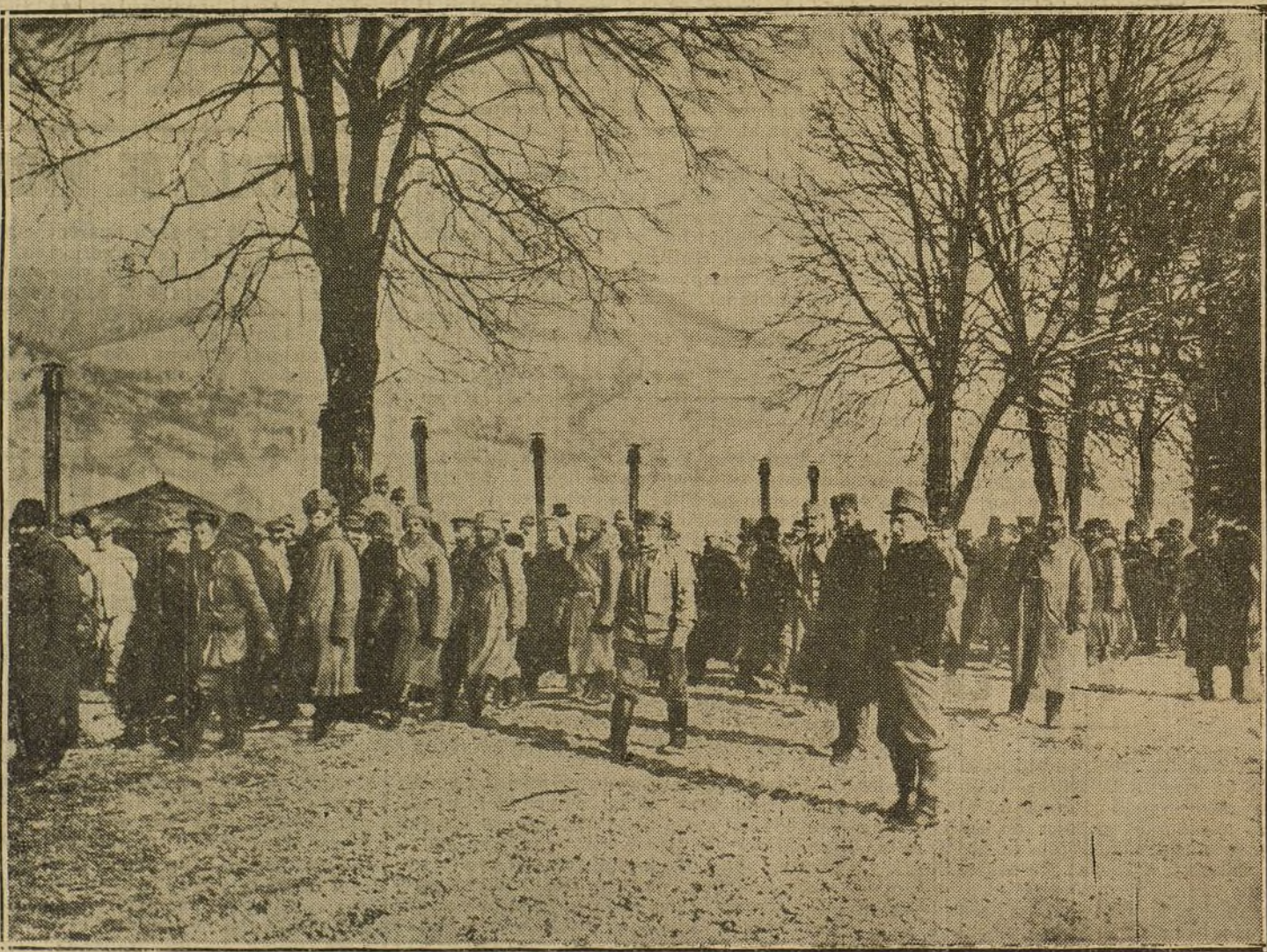
LA GUERRA EN ORIENTE.—Soldados rusos hechos prisioneros por los austriacos en el paso de Dukla, y conducidos al interior de Austria.

Una tarde, en una mesa del café Continental, había dos caballeros que ya pasaban la cincuentena; ambos eran calvos y ostentaban largos bigotes de guías desmayadas. Eran franceses; uno de ellos leía «Le Journal»; el otro acercaba sus pupilas miopes á las páginas de «Le Matin». A poco llegó una francesita muy elegante, muy risueña, con las ojeras sombreadas de