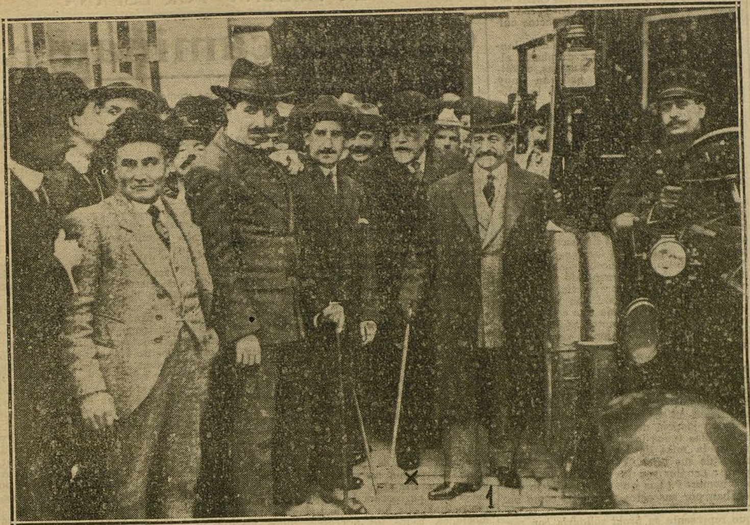
EL VIAJE DE ROMANONES.—El conde de Romanones (1), acompañado del gobernador, Sr. Andrade (X), al salir del apeadero de Gracia, a su llegada a Barcelona.