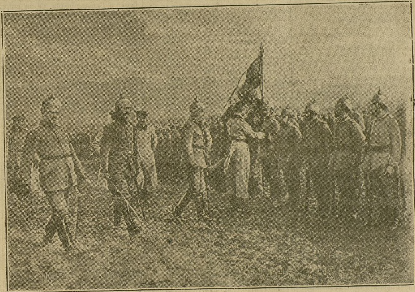
LA FAMILIA IMPERIAL ALEMANA EN LA GUERRA.—El Kronprinz felicitando a su regimiento después del victorioso asalto de Massiges.

Faltan todavía las pérdidas de los Dardanelos.