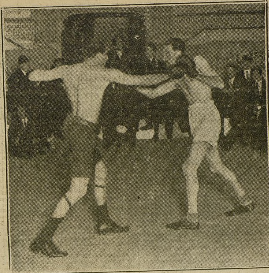
El hijo del marqués de Portago y el Sr. Pomés durante el «match» de boxeo verificado ayer tarde en el circo de Parish.

formados por suecos, dinamarqueses, austriacos, holandeses, rumanos, italianos, suizos y siete españoles.