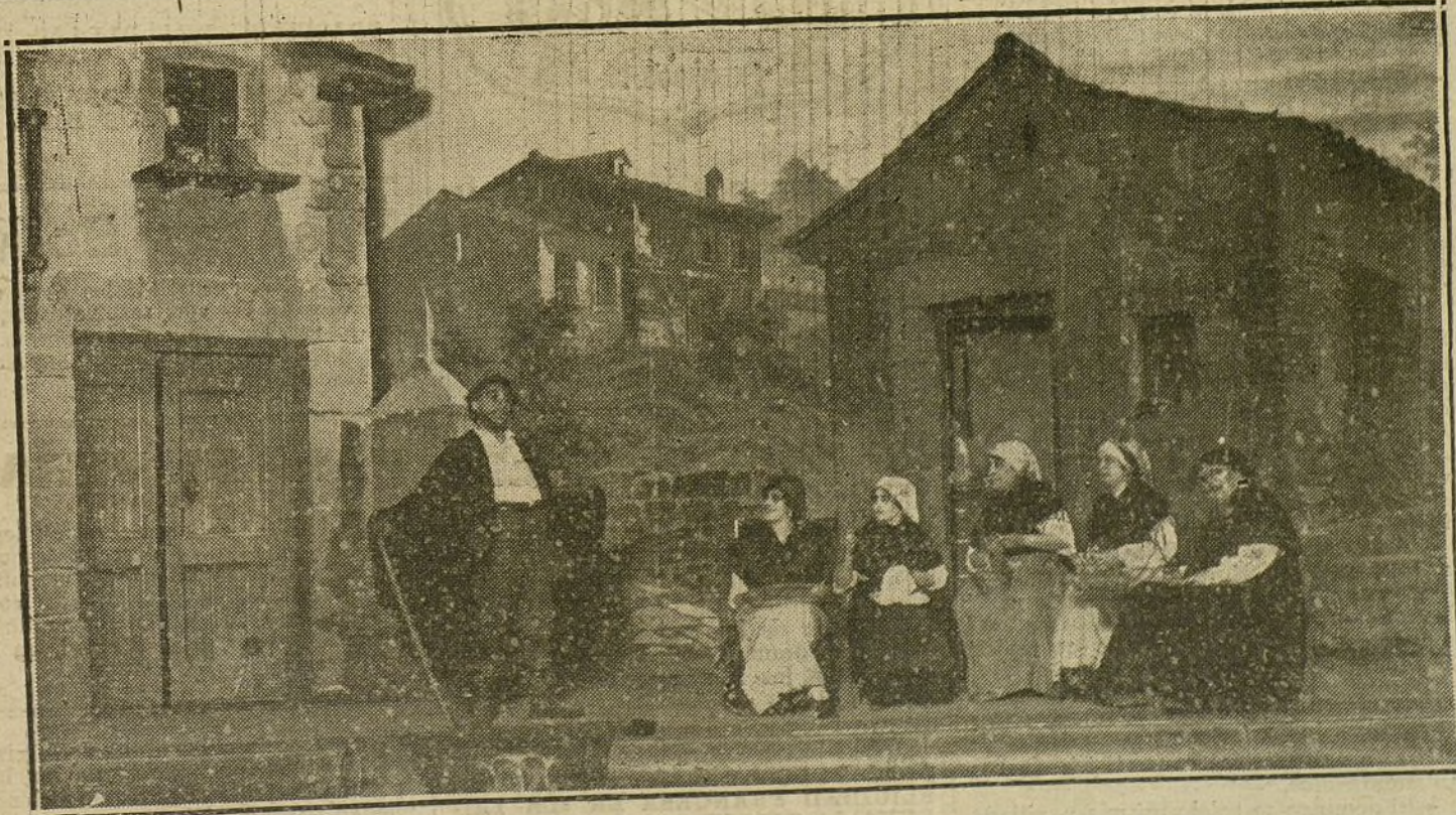
Una escena de «Amor de aldea», obra estrenada anoche en la Zarzuela.

Hasta ahora se sabe que han solicitado su inscripción los Sres. García, Fúster, Silvela, Portago, Peña, Vivanco, Pomés, Romai y otros que no recordamos.