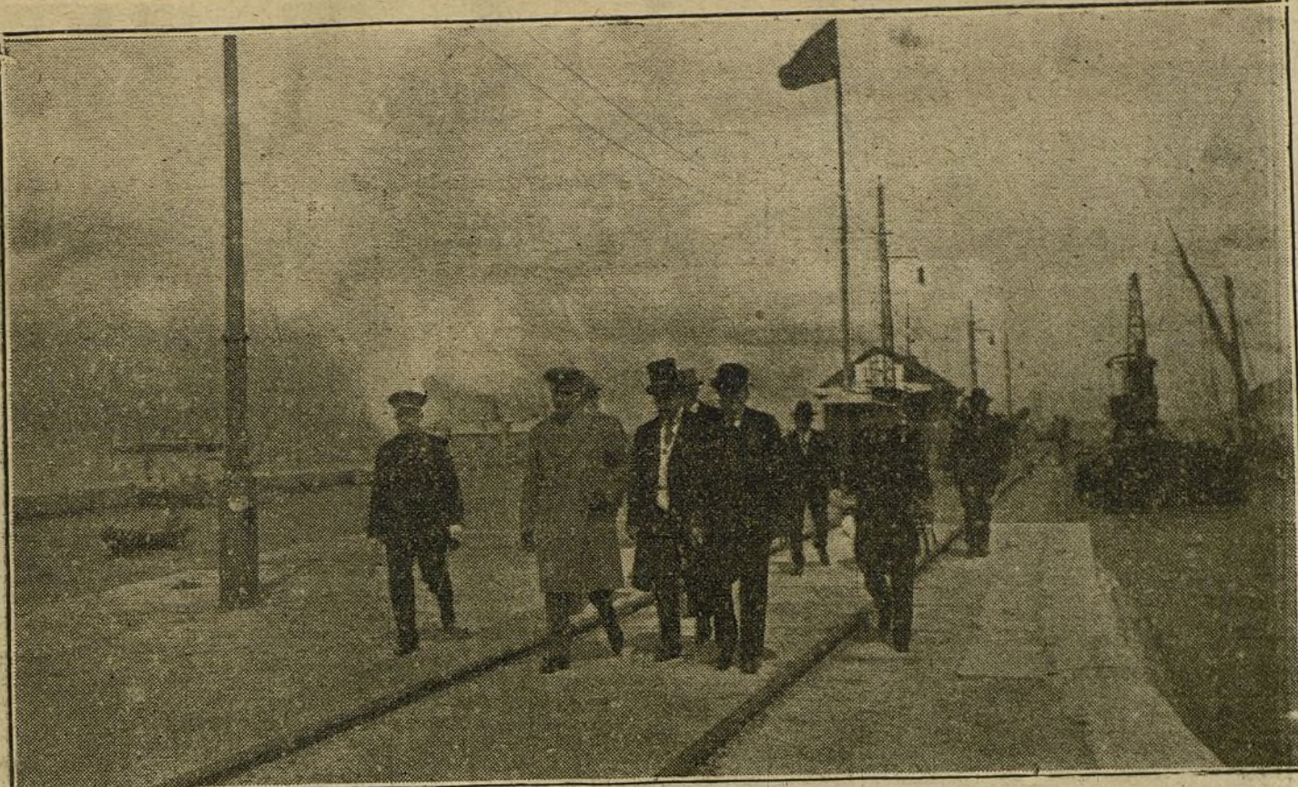
El Príncipe de Battenberg, con las autoridades locales, en el puerto de Algeciras.

En el cuadro siguiente: el harén de noche; las odaliscas, después del baño, tienen un apetito nunca sentido con tanto vigor; una sed de amor que las conmueve. Se bañan los eunucos, y salen del agua perfumada y tibia, con voces de sochantre, en vez de las atipladas que por clasificación disfrutaban, y cuando Yusuf suelta la sábana para sumergirse, el geniecito de marras (¡vaya un geniecito!) le dice, y nos lo dice a todos, que la juventud perdida no se recobra nunca, y que los viejos libidinosos tienen seguro castigo en su debilidad.