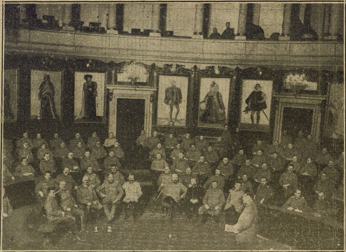
LOS ALEMANES EN BELGICA.—Primera sesión de médicos militares de Bruselas, celebrada en el palacio del Parlamento belga. Número 1, el teniente general de Sanidad doctor Stechow; núm. 2, el célebre profesor doctor Pannwitz.