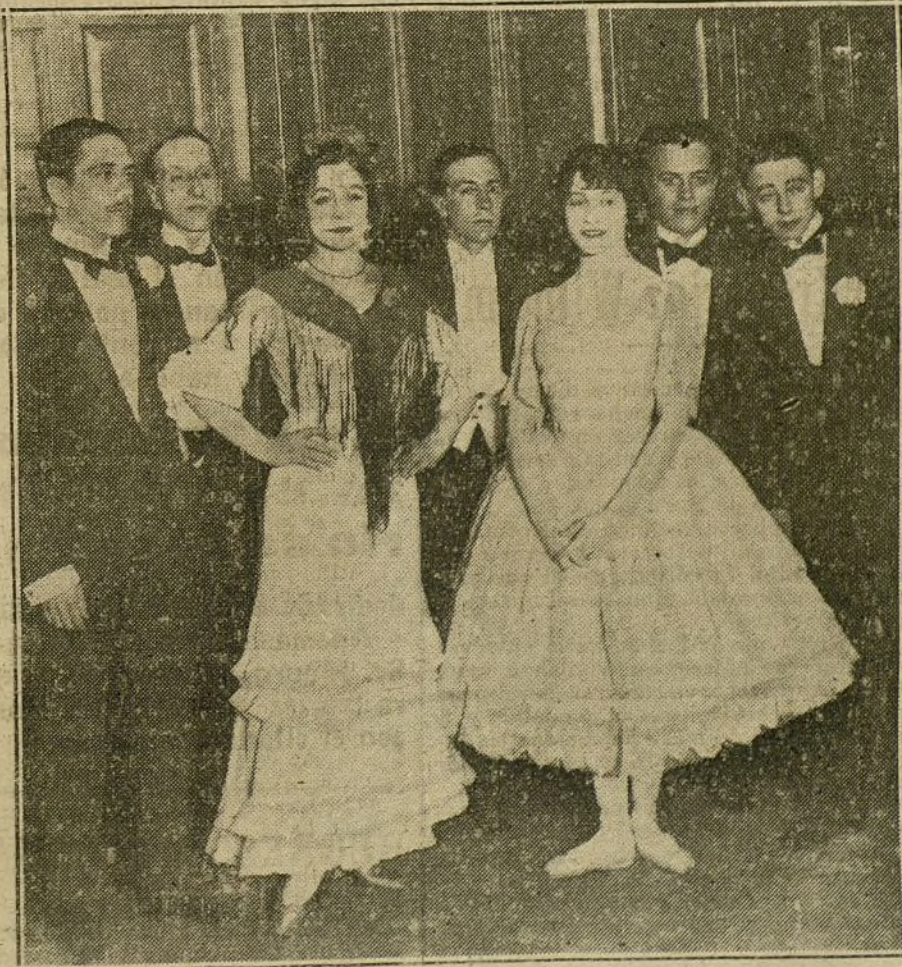
LA FIESTA DE LA DANZA.—Las señoritas Verbist y Argentina, que bailaron ayer en el Ateneo, acompañadas de los estróteos que leyeron trabajos en la citada fiesta.

Los hermanos Quintero salieron infinitas veces a escena, siendo aclamados.