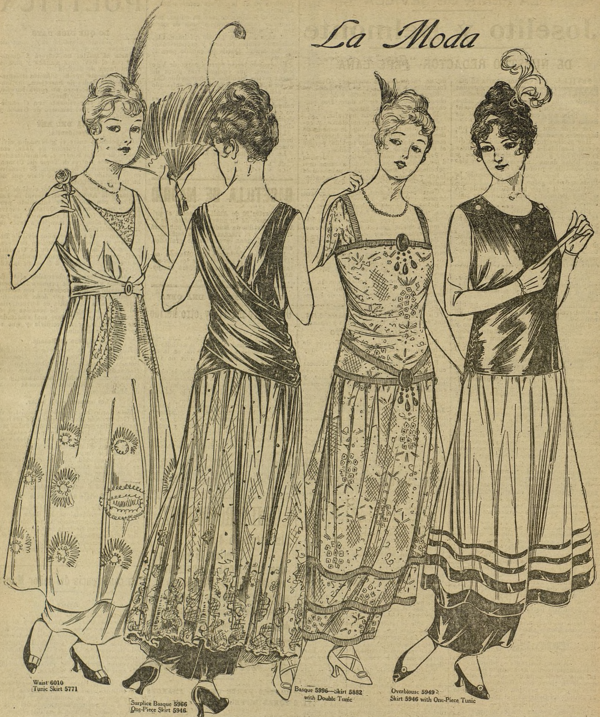
Waist 6010 Tunic Skirt 5771