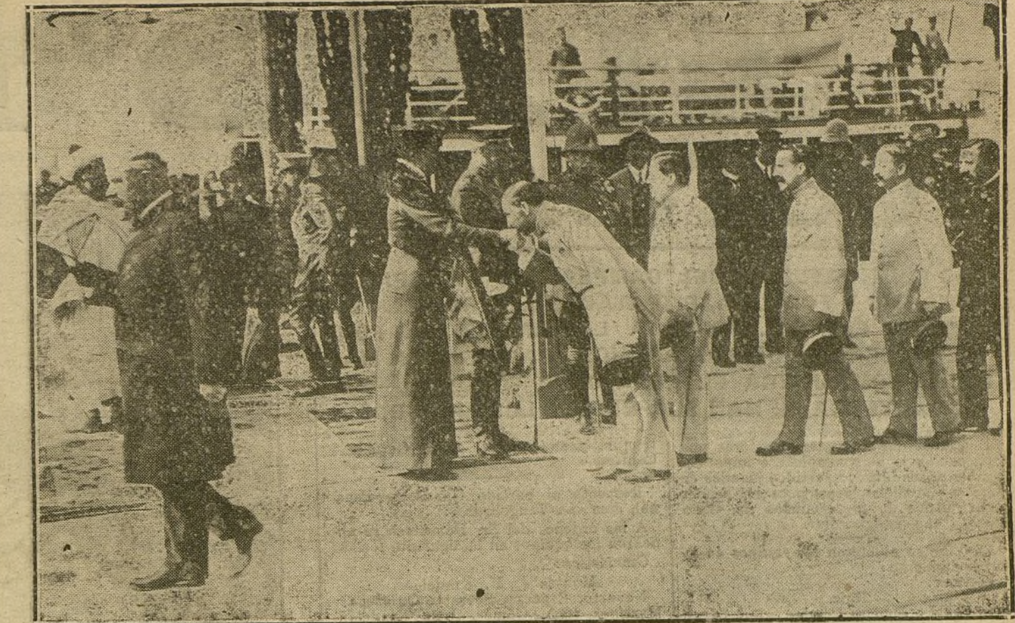
LOS INFANTES EN MELILLA.—SS. AA. los Infantes Don Carlos y Doña Luisa y el Príncipe Raniero de Borbón recibiendo a las Comisiones que acudieron al puerto a recibirlos.

Y vemos en la estancia, que preside ese sello de sencilla elegancia, que es patrimonio de D. Antonio, los dos retratos familiares del padre y la madre de Maura, y otro retrato de Gamazo, también carísimo para los afectos de la familia. Contemplamos acuarelas del político, buenas a fe nuestra, y esto es pura verdad; otras,