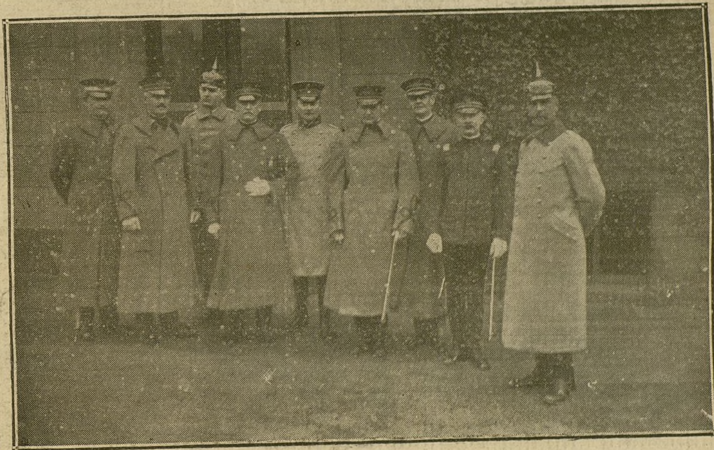
LA GUERRA DESDE BERLIN.—Los agregados militares americanos que se encuentran actualmente en Berlín.

El periódico «Neue Freie Presse» publica, con motivo de las fiestas de Pascua, algunos escritos de los generales austro-húngaros, entre ellos del Archiduque José Fernando, quien expresa el convencimiento de que las tropas austro-húngaras, que tantas pruebas han dado de su disposición al sacrificio, seguirán combatiendo valientemente hasta alcanzar la gloriosa victoria.