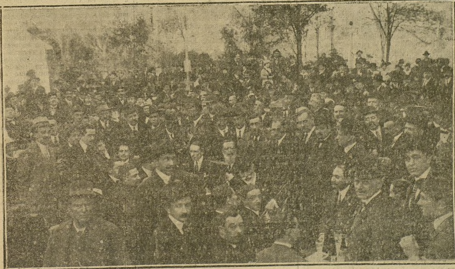
DESPUES DEL DISCURSO.—Don Antonio Maura con la Junta directiva de la Juventud Maurista durante la Aspta celebrada ayer tarde en Parisiana, en honor de las Comisiones de premiadas.

PARA TODO LO REFERENTE A PUBLICIDAD FRANCESA EN «LA TRIBUNA», DIRIGIRSE A NUESTRA AGENCIA EN PARÍS: 23, RUE VIENNE, 22.