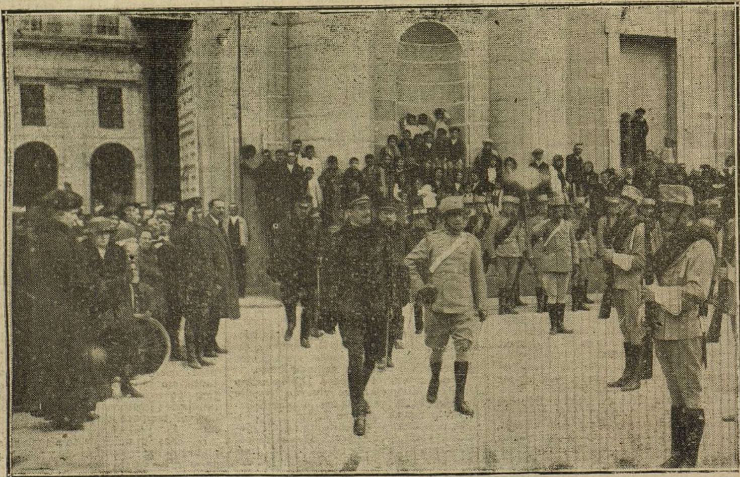
LOS REYES EN EL ESCORIAL.—Su Majestad el Rey y el ministro de la Guerra, general Echagüe, revistando el batallón de alumnos de la Academia de Artillería, a presencia de S. M. la Reina Victoria.