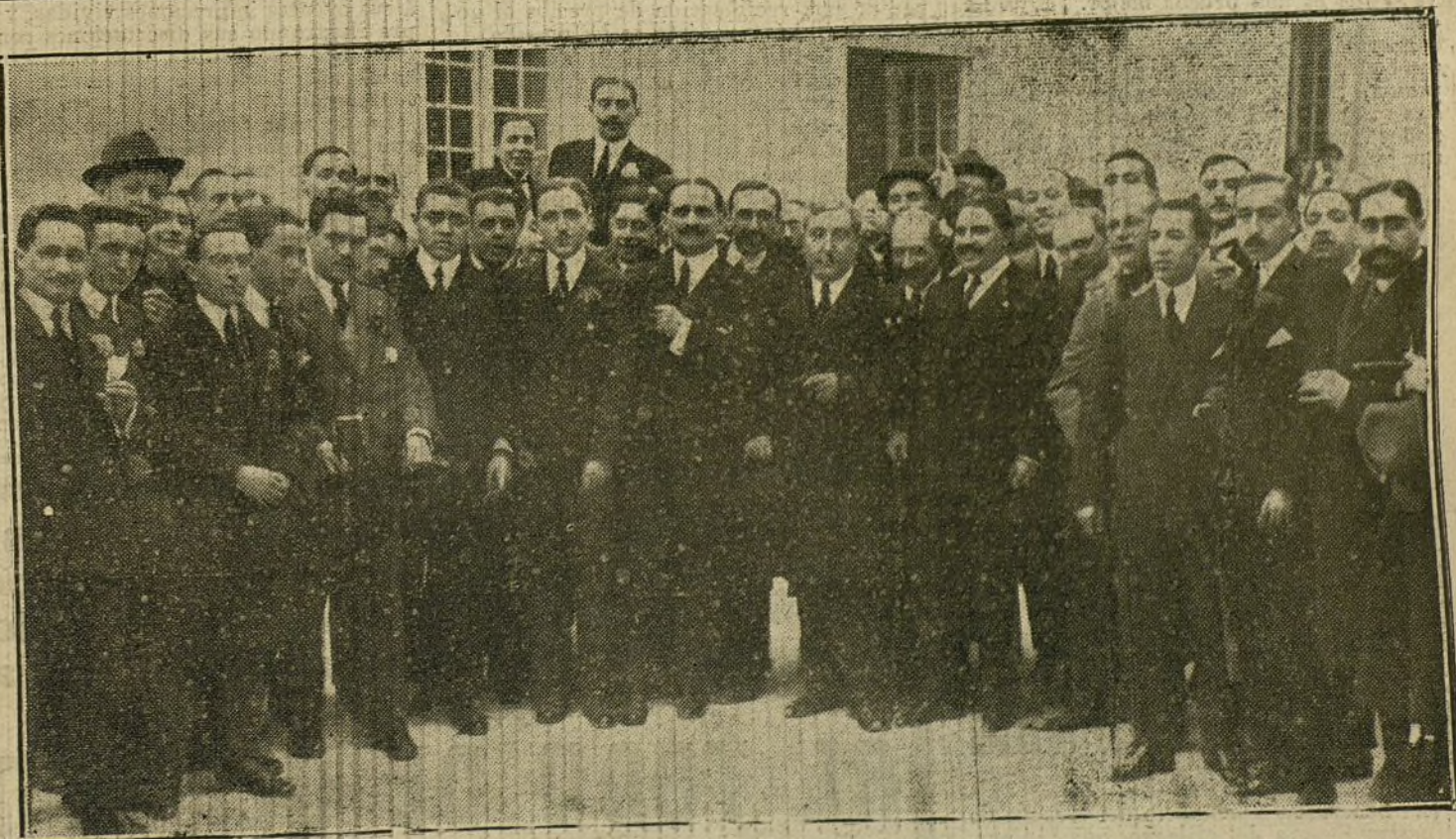
EL BANQUETE MAURISTA.—Grupo de asistentes al banquete celebrado ayer tarde en honor de la Junta organizadora del acto del Real.