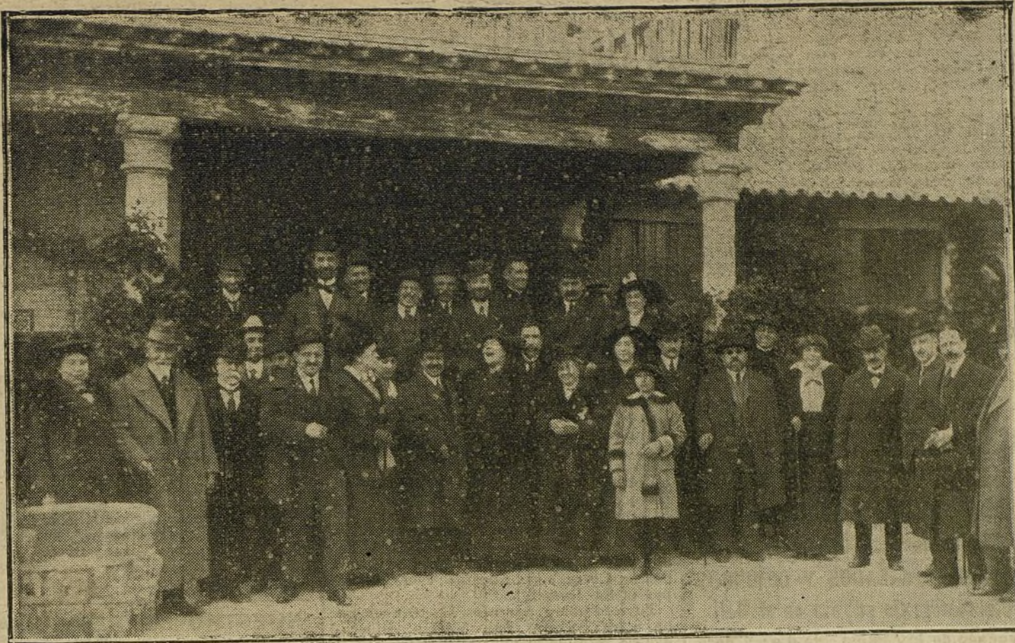
EL CONGRESO DE DOCTORES ESPAÑOLES.—Grupo de congresistas durante la excursión que hicieron ayer a Toledo.

La Junta de gobierno de dicha Orden invita a sus asociados y a cuantos españoles simpatizan con tan patrióticos actos, y les ruega su puntual asistencia, al objeto de dar mayor esplendor a esta tradicional fiesta.