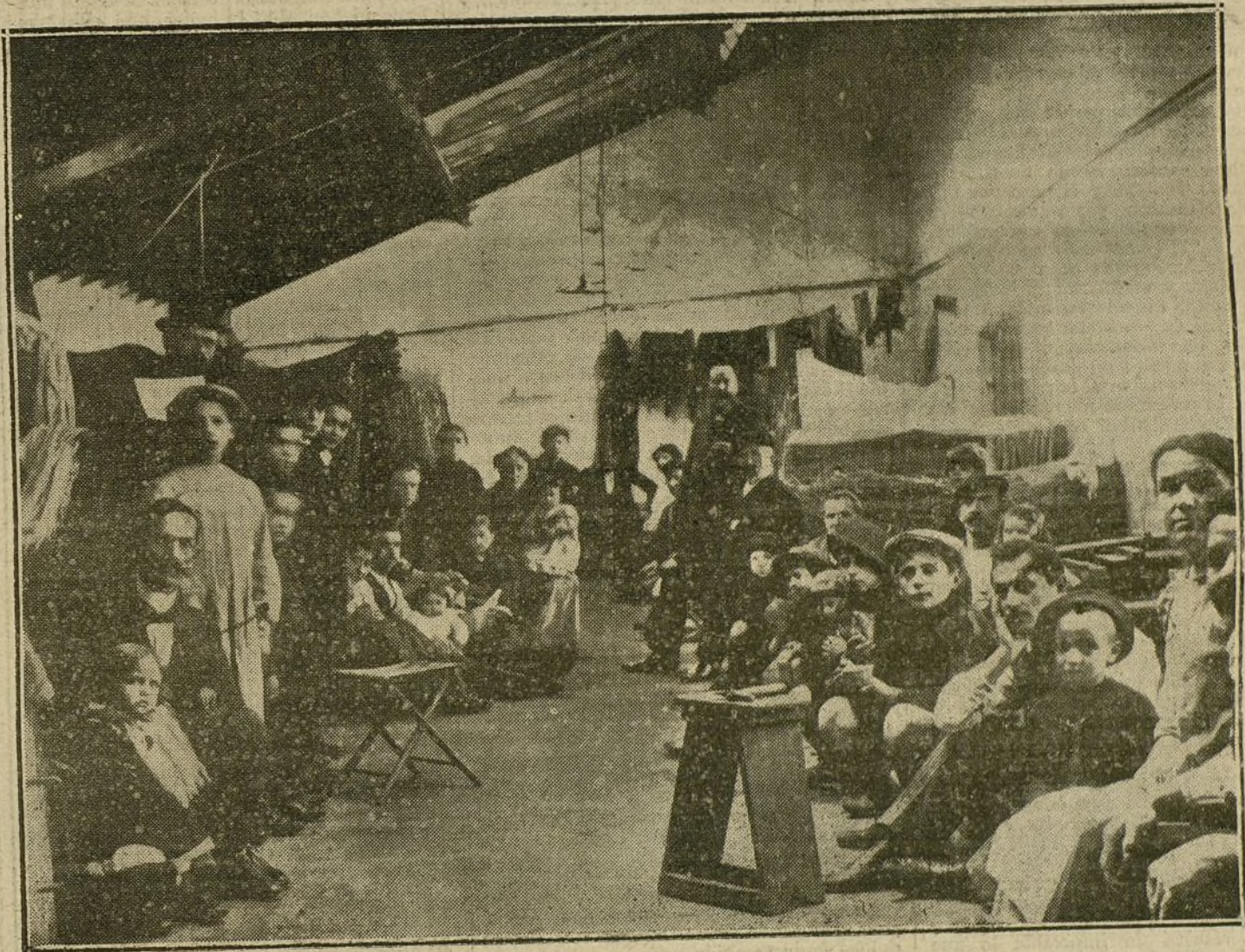
Uno de los locales destinados á albergue de prisioneros civiles austriacos en el campamento de Périgneux (Francia).

Frente á Verdun, entre Mosa y Mosela, los franceses atacaron los Eparges y Combrés de Norte á Sur, como atacaron de Sur á Norte por los bosques de Brulé y La Prétre, desde Pont-a-Mousson. Todo ataque decisivo en grandes masas tiene