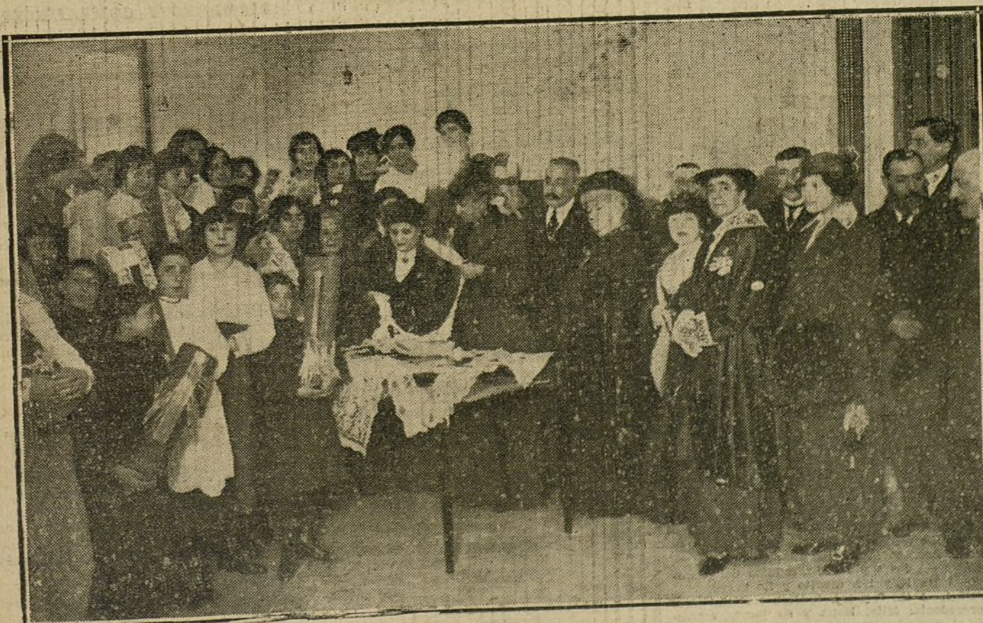
S. M. la Reina Cristina durante su visita á la Escuela de confección de encajes, del Bazar del Obrero, acto verificado ayer tarde.