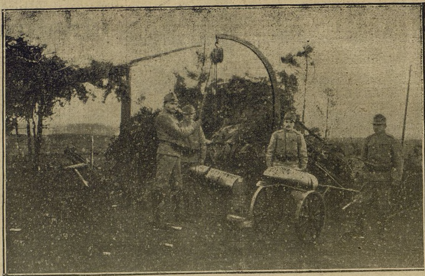
LAS ARMAS DE GUERRA.—Soldados austriacos cargando proyectiles del mortero de 30,5.

El juez de guardia se constituyó en el lugar del accidente, y previas algunas diligencias de rigor, ordenó el traslado del cadáver al Depósito.