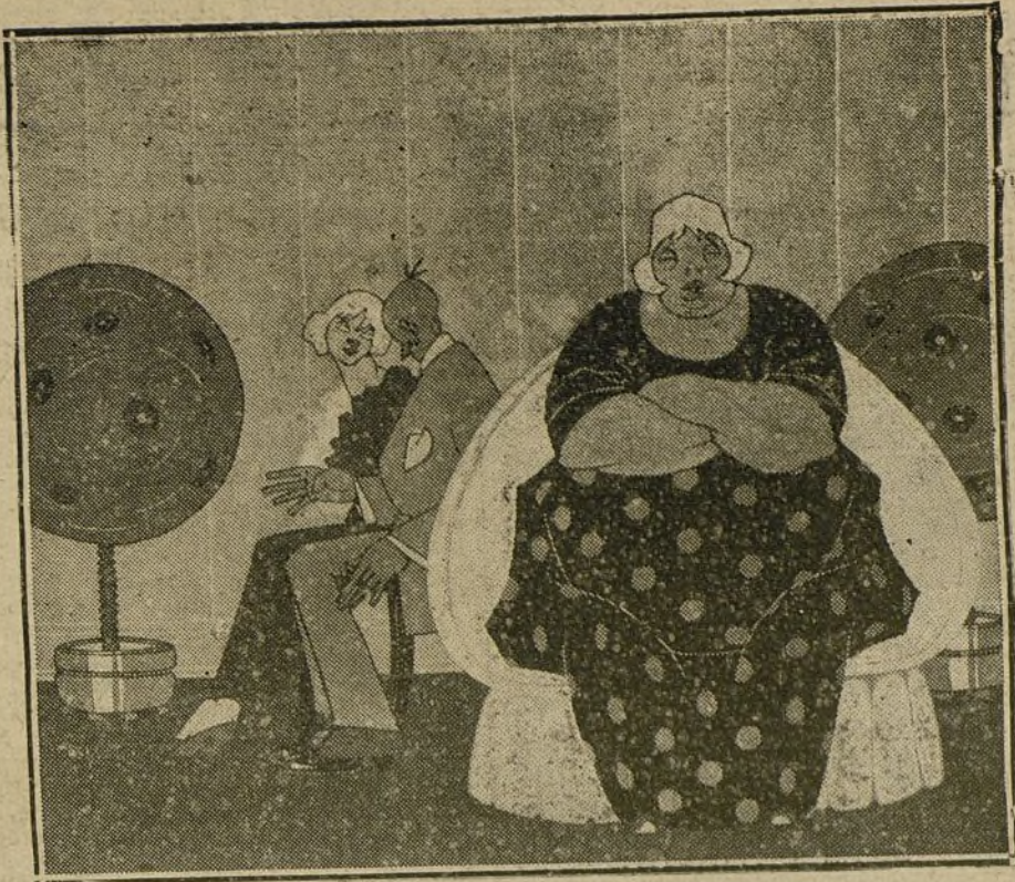
Cuadro titulado «Neutralidad», que figura en la Exposición del notable caricaturista «K. Hito».

Me dice que es abogado y cosechero de aceite en Oneglia, adonde se dirige con ocho días de permiso para atender sus negocios, abandonados por la movilización que ha trastornado el país.