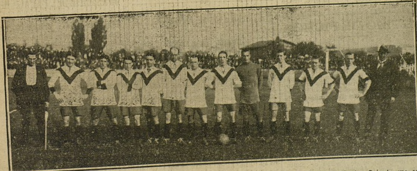
EQUIPOS EXTRANJEROS QUE HAN JUGADO EN ESPAÑA.—El equipo profesional inglés Clapton-Orient, que es indudablemente el mejor de los que nos han visitado.