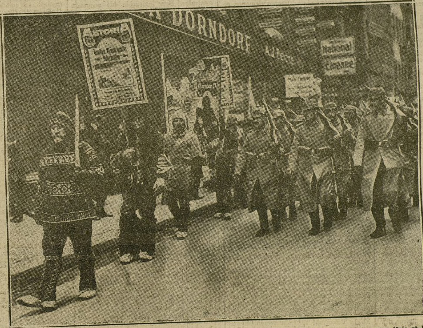
A PESAR DE LA GUERRA.—Desfile de un regimiento de Infantería por una de las calles de Leipzig, cuya feria se ha visto tan concurrida como en años anteriores.

Una revista alemana da algunos detalles sobre un nuevo descubrimiento, debi-