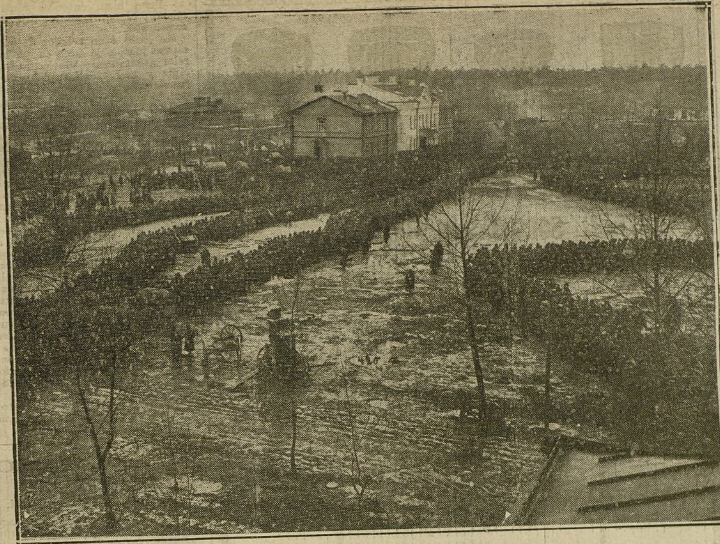
LA GUERRA EN ORIENTE.—15.000 prisioneros rusos preparados en Augustow para ser trasladados á los campamentos alemanes.

blos fuertes, grandes y pequeños, pero con fuerza propia espiritual y material. Alrededor de Inglaterra sólo hay pueblos caquéticos, agotados. No se ve en esto la tranquila seguridad del gigante y la hipócrita habilidad del diplomático?