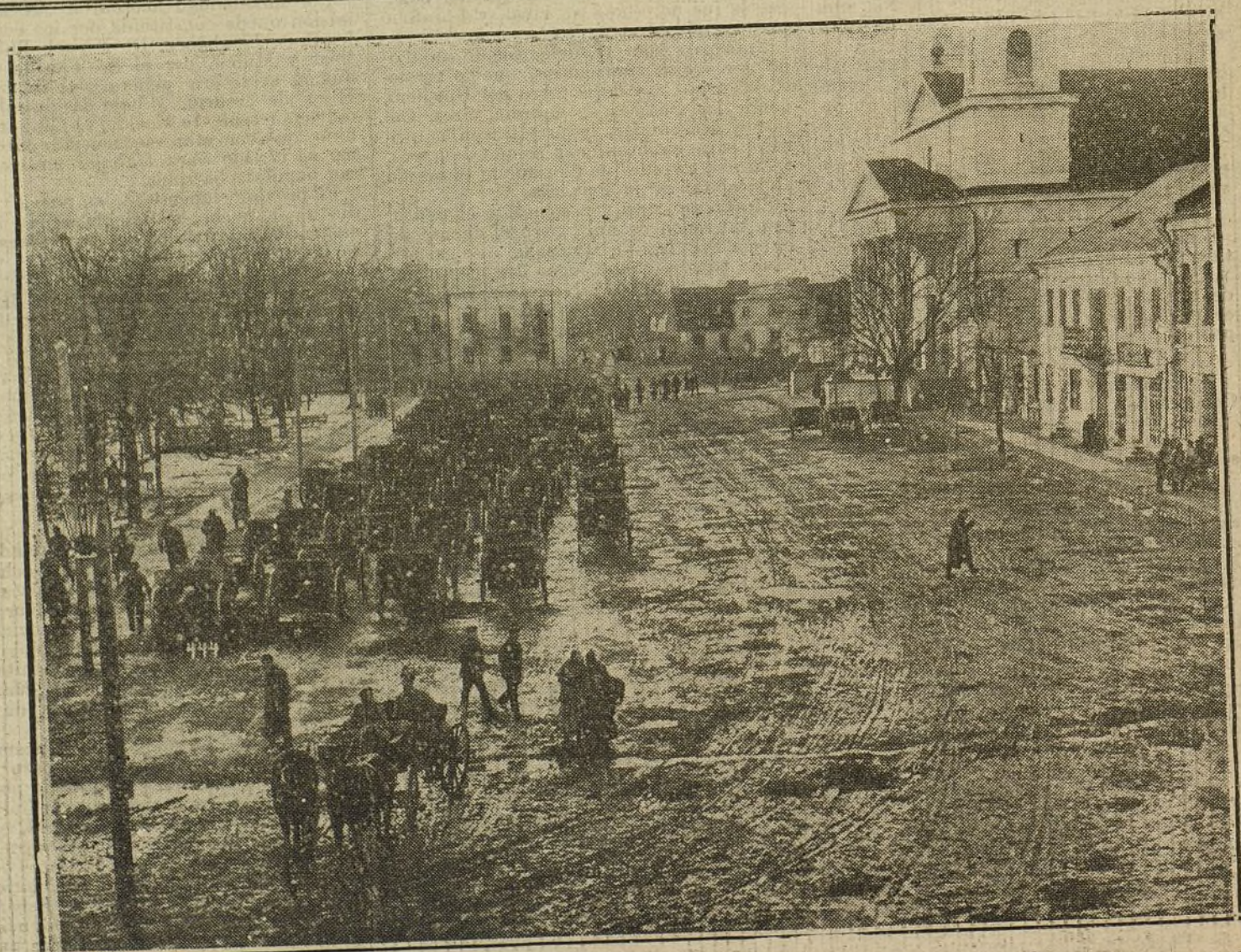
LA GUERRA EN ORIENTE.—Cañones rusos cogidos por los alemanes en la región de los lagos Masurianos, durante los últimos combates.

Se nos dice á todas horas que Inglaterra y Francia luchan por la libertad. Y Alemania, ¿por qué lucha? Si la India dejara mañana de ser inglesa, para ser alemana, ¿sería por eso menos libre? Alrededor de Alemania han crecido pue-