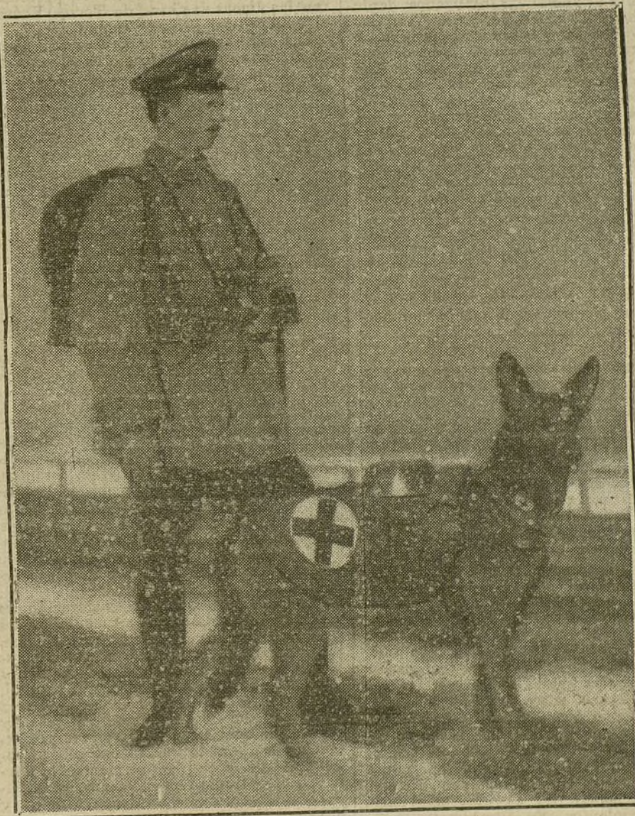
LOS PERROS SANITARIOS EN CAMPAÑA.—Uno de los famosos perros sanitarios que están prestando excelentes servicios en el Ejército alemán. Como se ve en el grabado, estos perros van provistos de un pequeño botiquín, que permite á los heridos no muy graves hacerse una ligera cura.

Se muestra admirador de las Universidades alemanas, y demuestra la gran evolución de su mentalidad en los últimos tiempos.