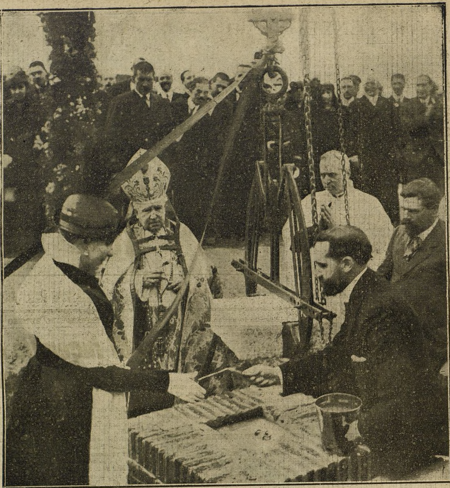
S. M. la Reina Victoria colocando la primera piedra para el Sanatorio de Valdelata, primero de los destinados á tuberculosos pobres que se erige con los productos de la Fiesta de la Flor.

La reúne todo: estilo propio, inconfundible, dominio absoluto de la parte técnica, exquisita delicadeza y gusto irrefragable en la ejecución. Así lo ha reconocido, sin duda, la Junta de ampliación de estudios para el extranjero, con-