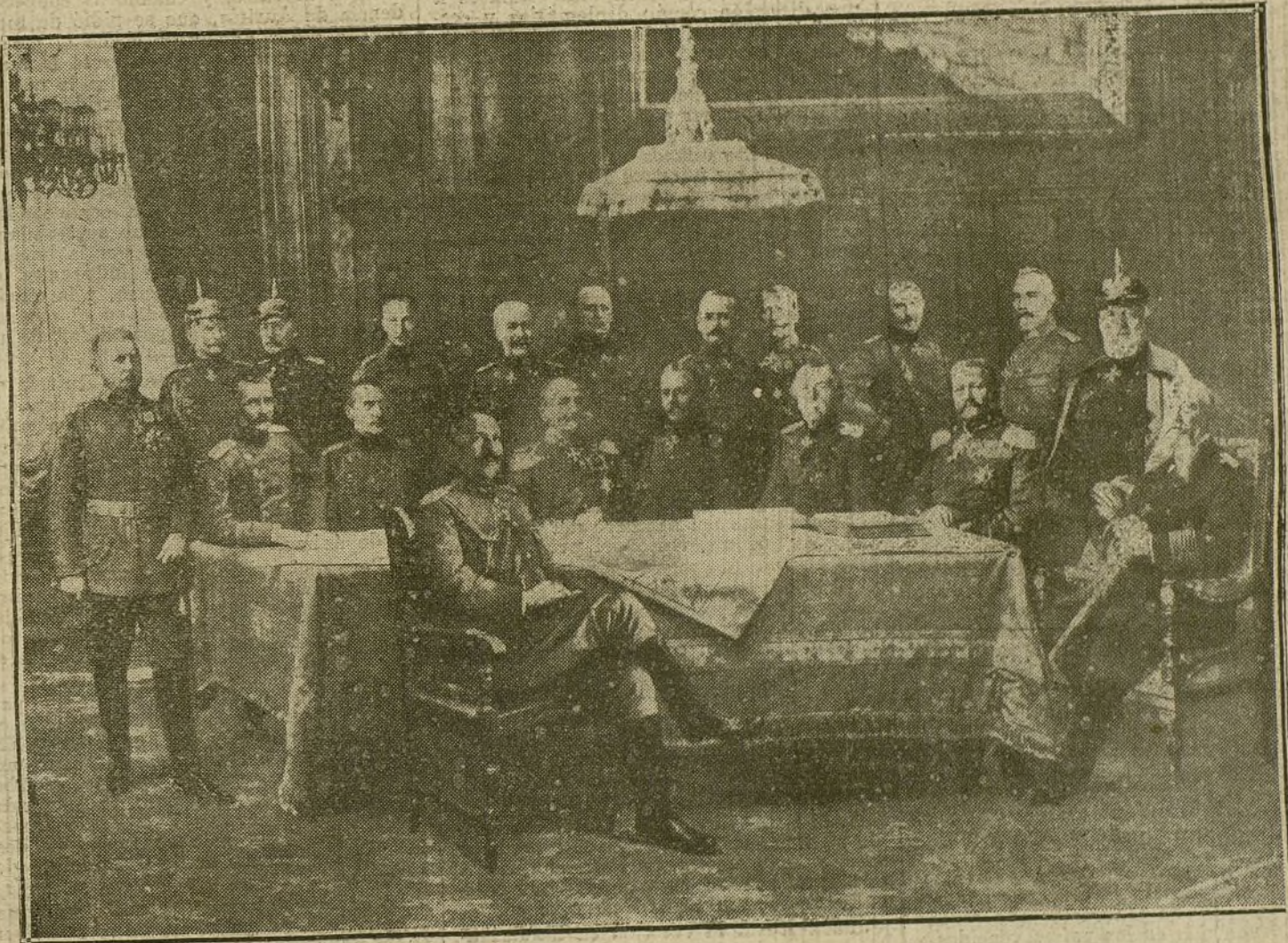
EL EMPERADOR DE ALEMANIA CON LOS PRINCIPALES JEFES DEL EJERCITO Y LA MARINA.—Sentados, de izquierda a derecha, Kronprinz Rupprecht de Baviera, duque de Württemberg, general-coronel von Kluck, general de Infantería von Emmich (vencedor de Lieja), general mariscal de campo conde von Haeseler (el más anciano de todos los generales alemanes), general mariscal de campo von Hindenburg, gran almirante von Tirpitz (secretario de Estado Imperial en el Departamento de Marina). De pie, de izquierda a derecha, general mariscal de campo von Bülow, general von Mackensen, general von Moltke, Kronprinz Wilhelm, general de Infantería von François, general Ludendorff (jefe del Estado Mayor del Ejército del Este, comandado por el mariscal von Hindenburg), general de Infantería von Falkenhayn (jefe del gran Estado Mayor del Ejército alemán), general von Einem, general de Infantería von Beseler (vencedor de Amberes), canciller del Imperio general von Bethmann Hollweg, general von Heeringen.

Dice además que sin la cooperación de fuerzas de desembarco fuertes por lo menos en 300.000 hombres, no hay que pensar en poder forzar los estrechos.