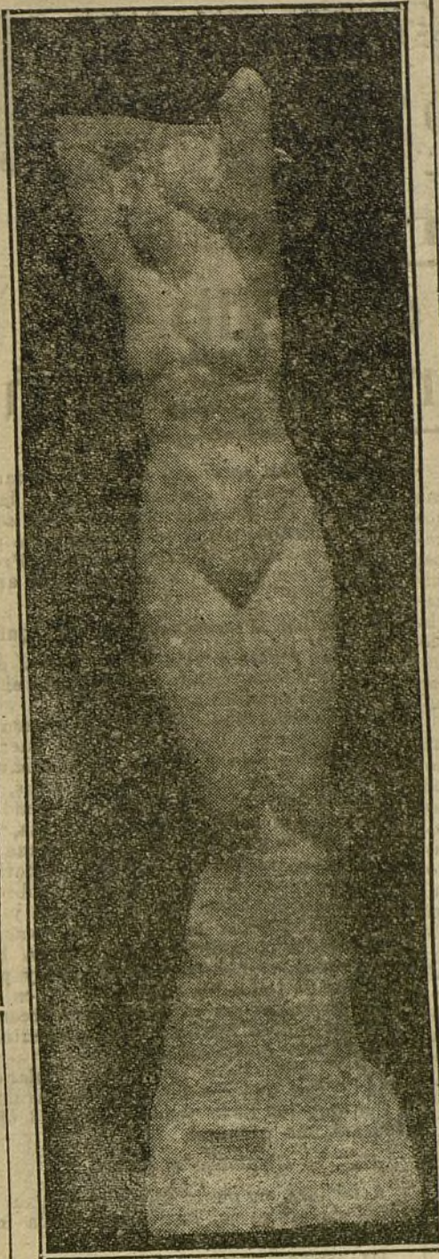
LA EXPOSICION DE BELLAS ARTES. «Aurora», por Antonio Navarro.