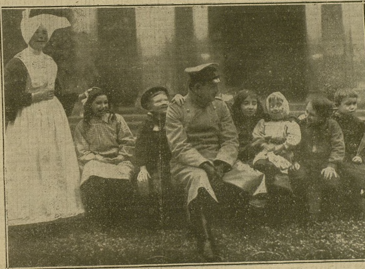
Un médico militar alemán con niñas francesas enfermas, a la puerta de un hospital, en territorio francés.

De ahora en adelante, los ingleses no enviarán más tropas indias a Europa; todo al contrario, será menester enviar soldados europeos a la India, porque el descontento es general y toma de día en día mayor extensión en el pueblo.»