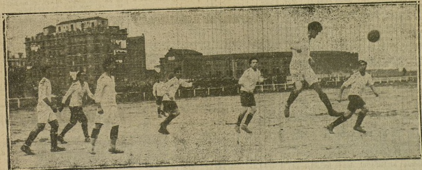
SELECCION CONTRA COALICION.—Un momento interesante del partido celebrado ayer entre los equipos selección y coalición, venciendo el primero por 5 «goals» a 0, y ganando, por consiguiente, las 11 copas ofrecidas

PARA TODO LO REFERENTE A PUBLICIDAD FRANCESA EN «LA TRIBUNA», DIRIGIRSE A NUESTRA AGENCIA EN PARÍS: 23, RUE VIENNE, 23.