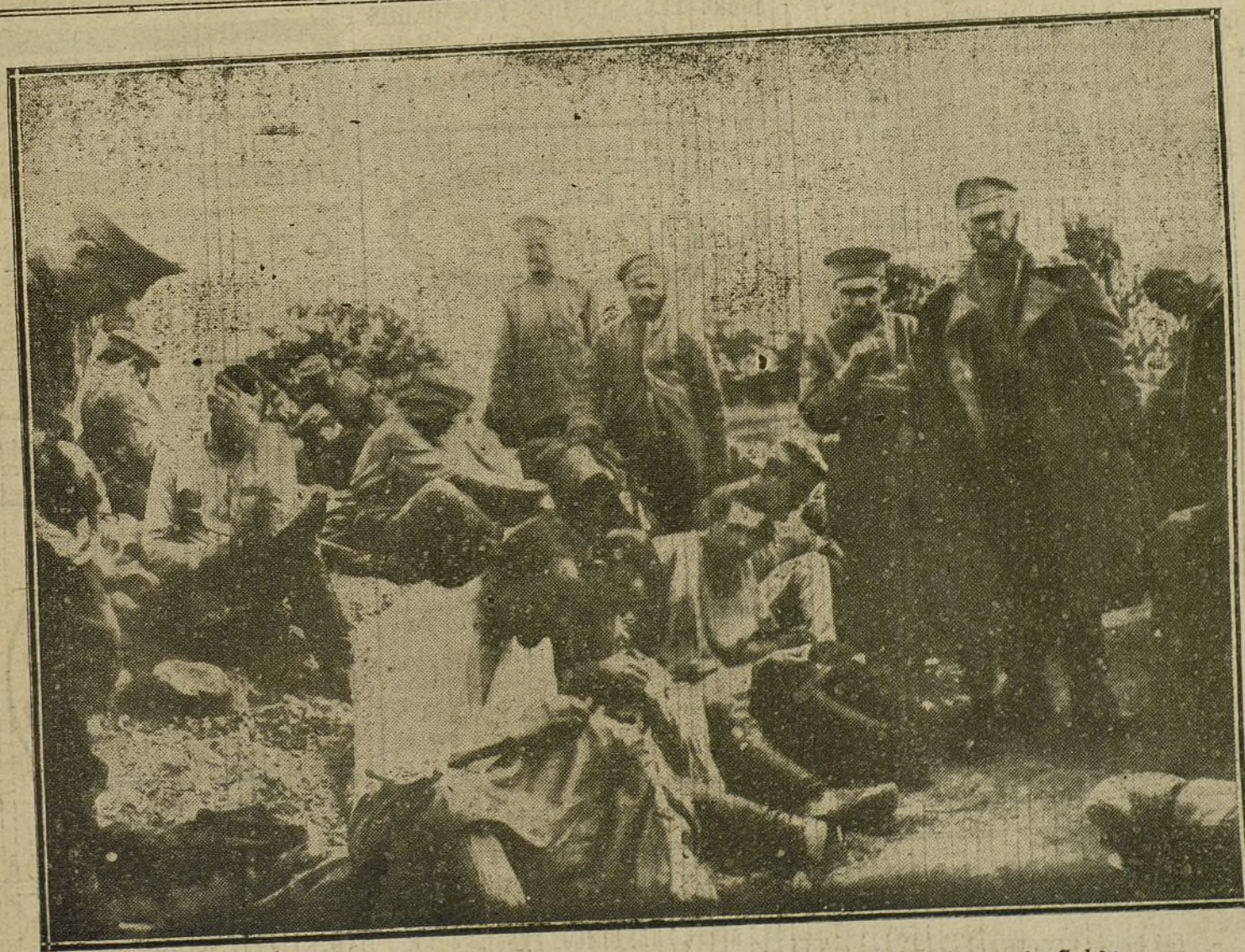
LOS PRISIONEROS DE GUERRA.—Soldados rusos prisioneros en el campamento de Guben.

Esta tarde conferenció el gobernador civil con el alcalde de Elda, dándole instrucciones para solucionar el conflicto.