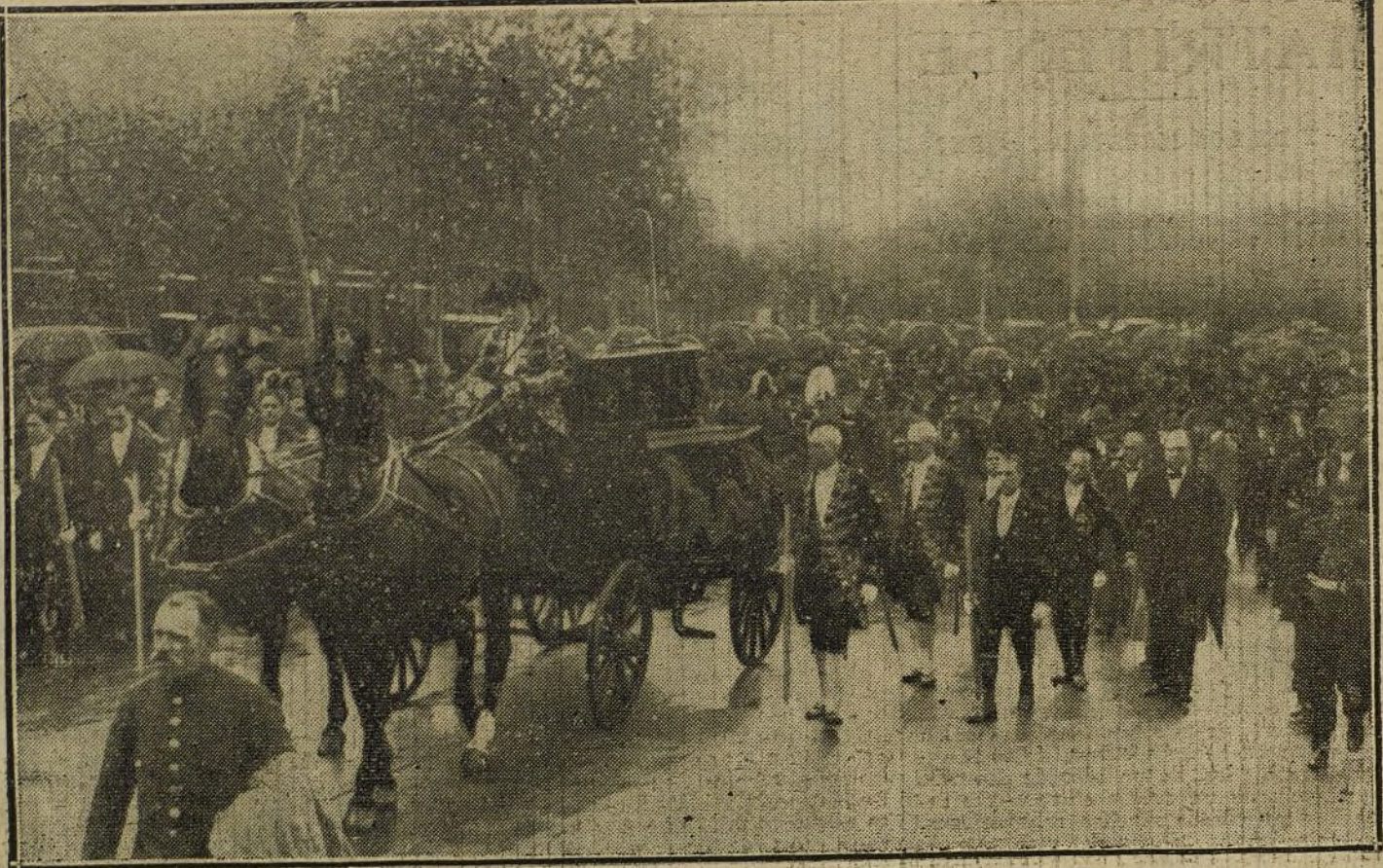
EL ENTIERRO DE LA MAJUESA DE SQUILACHE.—El coche fúnebre y la presidencia del duelo.

El primero de estos dos partidos—dice—, que es el catalanista, no fué comprendido por los Poderes, y Canalejas y Moret se encargaron, por medio de la astucia, de hacerlo desaparecer, principalmente Moret, que trató de disolverlo, para lo cual ayudó al otro partido siempre que pudo, y éste, que ya era fuerte, se vino robusteciendo con la ayuda del Poder, que pactaba con los radicales; radicalismo extraño, al que no era apropiado tal título, pues radical es todo lo que por medios distintos a los usados, por nuevos procedimientos, va al fin: radical es Wagner en música; Napoleón como estadista; Maura como gobernante; pero no quienes, fados en la inmunidad, contratan la tranquilidad y van por medio de la revolución a su me-