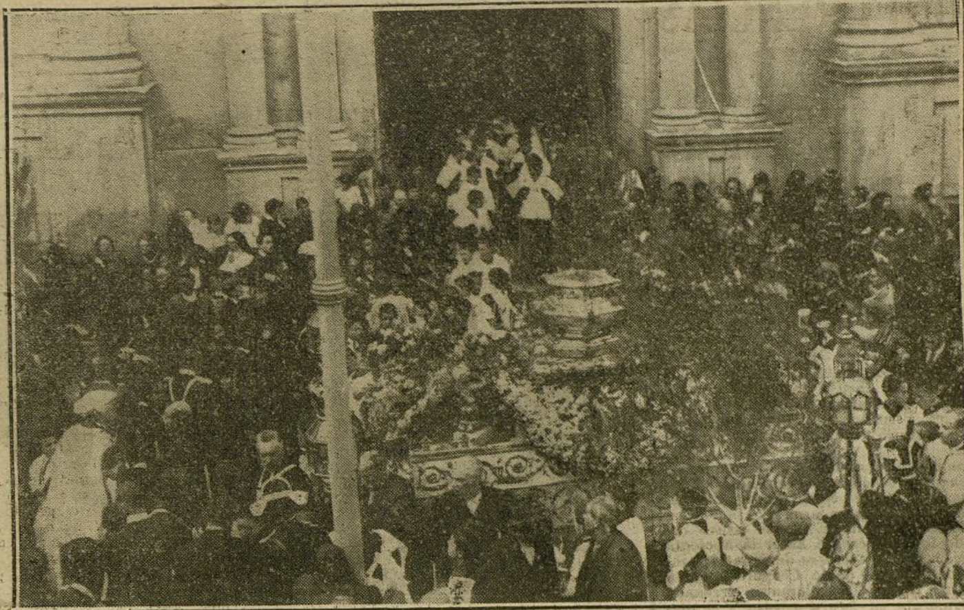
FIESTAS EN ALCALA DE HENARES.—La procesión de la Sagrada Forma, á la que concurrió una numerosa peregrinación de Madrid, á su salida de la catedral.