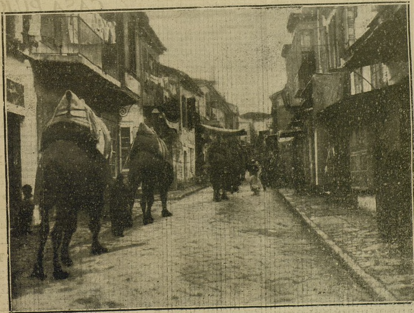
EL ATAQUE A LOS DARDANELOS.—Vista de una calle de Smirna, por la que atraviesa una caravana de camellos con dirección al frente de batalla.