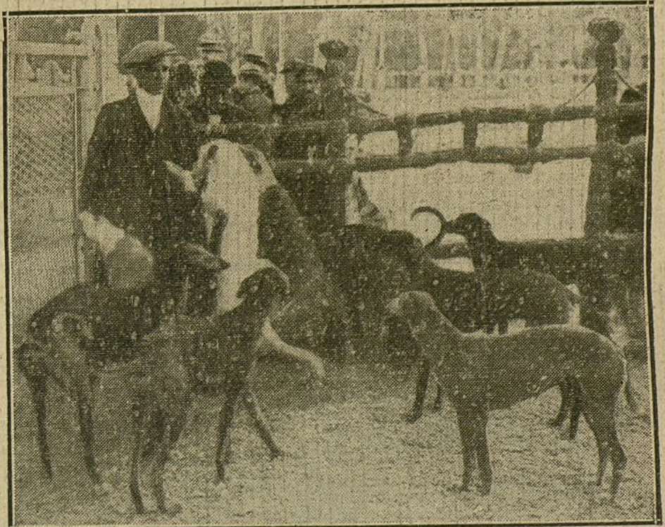
LA EXPOSICION CANINA.—Una de las instalaciones que figuran en la Exposición inaugurada ayer tarde.

Un bloque de tierra con un algarrobo cayó sobre el dartero-peatón, hiriéndole de alguna gravedad.