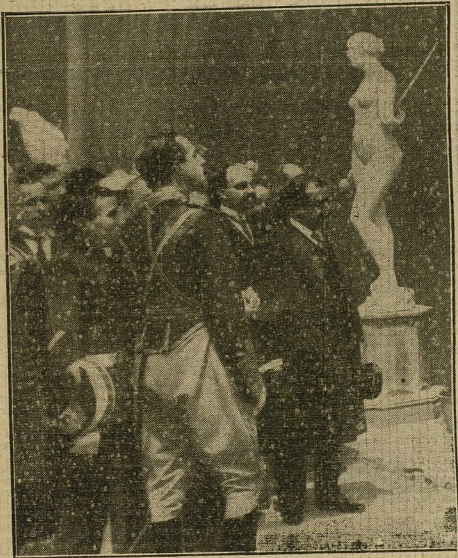
LA EXPOSICION DE BELLAS ARTES.—S. M. el Rey visitando el pabellón de esculturas.

PARA TODO LO REFERENTE A PUBLICIDAD FRANCESA EN «LA TRIBUNA» DIRIGIRSE A NUESTRA AGENCIA EN PARÍS: RUE VIVIENNE, 22.