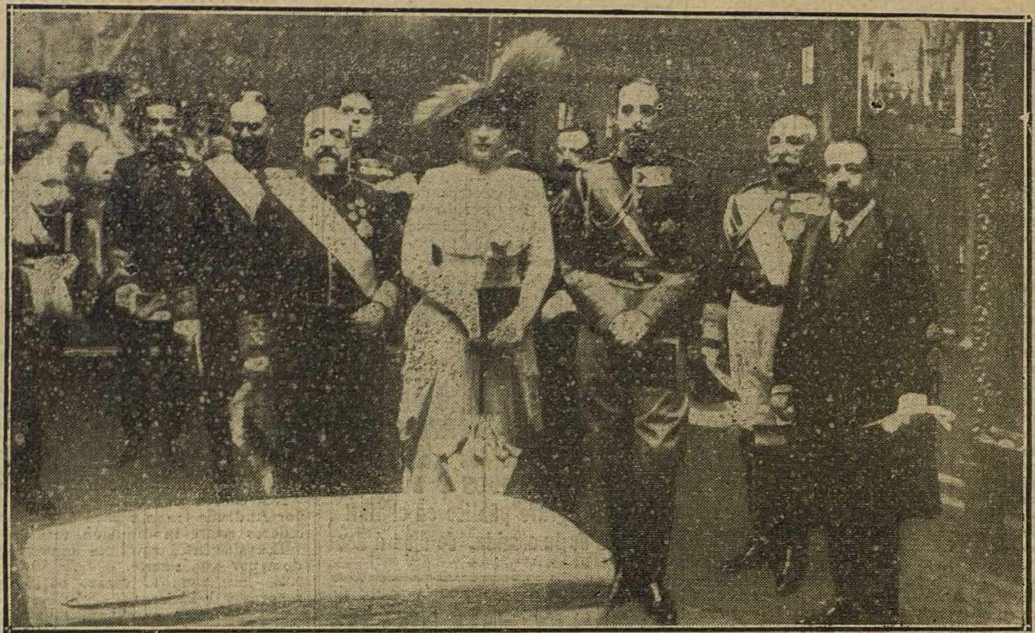
LOS REYES EN LA EXPOSICION DE BELLAS ARTES.—SS. MM., el ministro de Instrucción y el director general de Bellas Artes, Sr. Poggio, recorriendo la Exposición.

Faltan muy pocos centímetros para rebasar el muelle del Barranco.