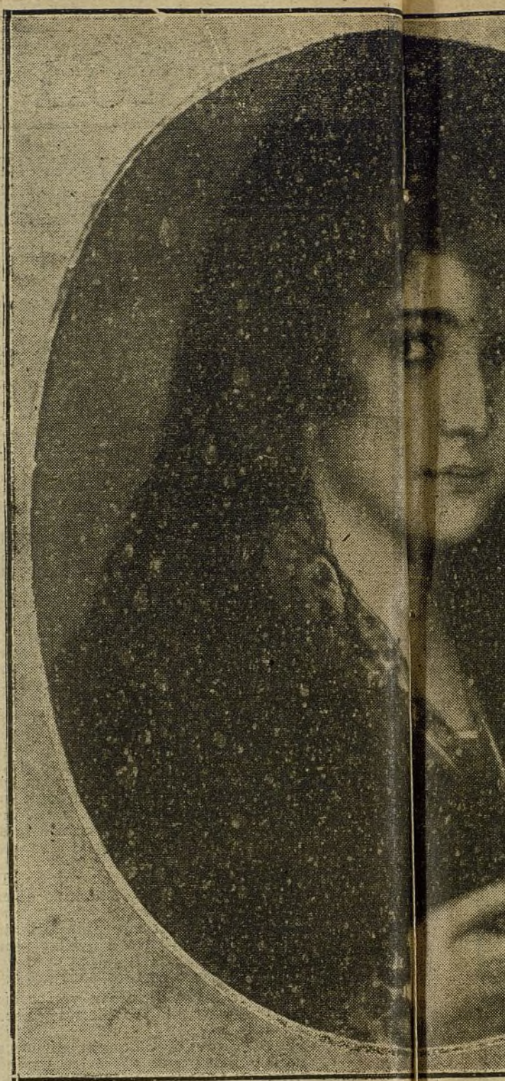
LA EXPOSICION DE BELLAS ARTES.—Retrat

PARA TODO LO REFERENTE A PUBLICIDAD FRANCESA EN «LA TRIBUNA» DIRIGIRSE A NUESTRA AGENCIA EN PARÍS: RUE VIVIENNE, 22.