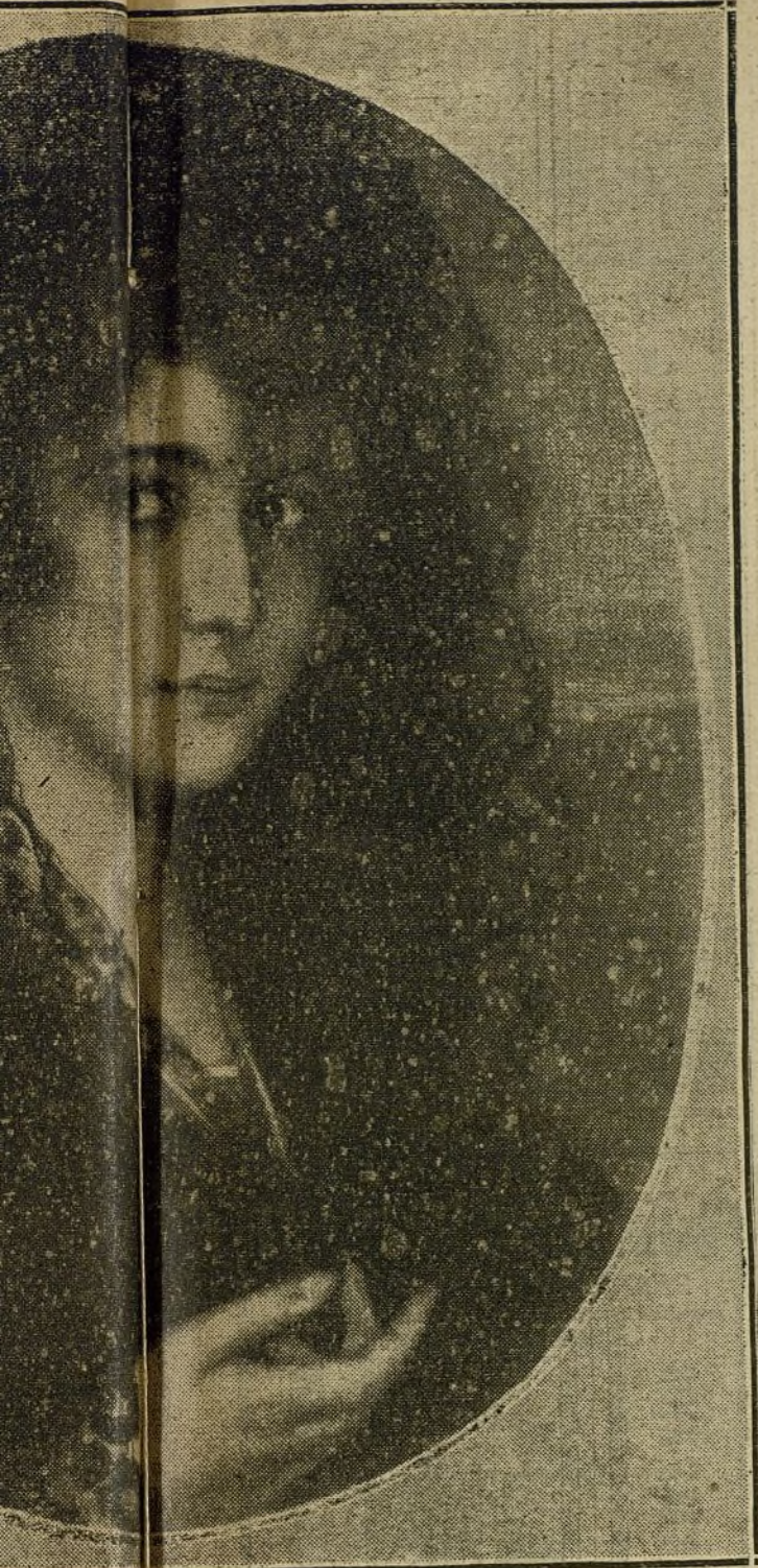
BELLAS ARTES.—Retrato, por Romero de Torres.

la acera y veo una cáscara de naranja en el suelo, la quito.