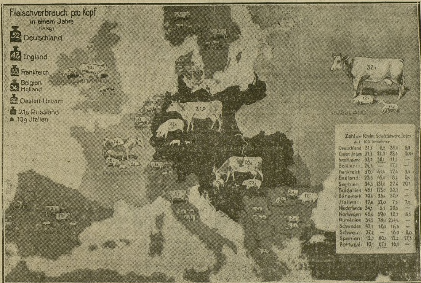
Gráfico de las existencias de carnes en los diferentes países. Los signos del ángulo izquierdo superior indican el consumo de carne por persona en un año; los signos de la derecha se refieren al número de vacas, ovejas, cerdos y cabras por cien habitantes.

Después de un violento bombardeo los franceses atacaron anoche las posiciones alemanas, entre el Mosa y el Mosela, cerca de Cropp-des-Carnes, logrando pene-