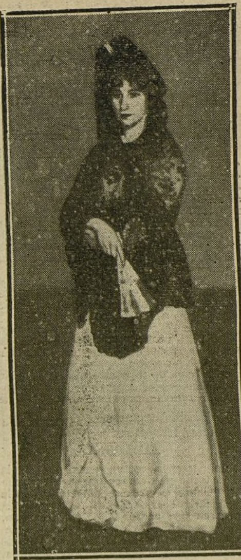
LA EXPOSICION DE BELLAS ARTES. Retrato de señora, por Ceferino Palencia Tubau.

El mecánico, Valentín Alvarez, prestó declaración, manifestando que no se ex-