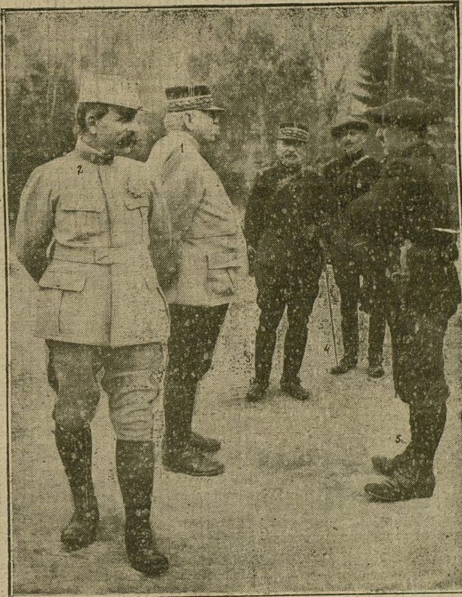
LAS RECOMPENSAS EN EL CAMPO DE BATALLA. —El general Joffre felicitando a un soldado heroico.—1, el general Dubail; 2, general Joffre; 3, general de Mand'huy; 4, general de Pouydrugin; 5, el soldado Lamadon.

Las existencias de numerario en los establecimientos de crédito demuestran la confianza del pueblo vienés. Los ah-