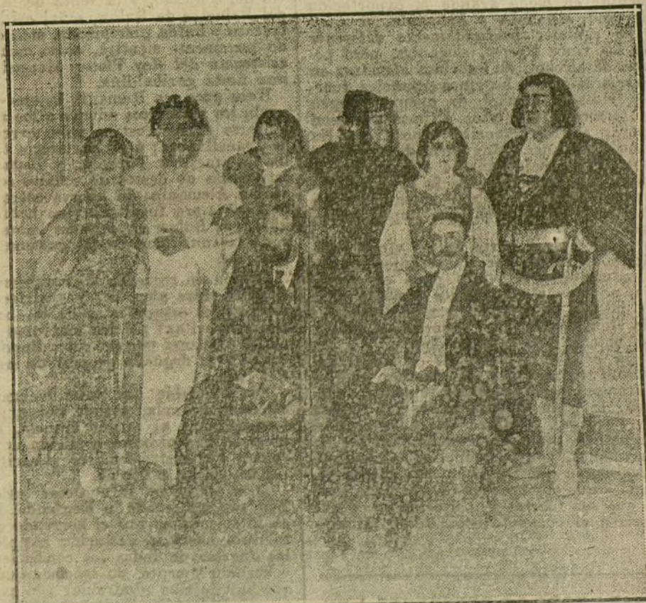
El maestro Conrado del Campo y los principales intérpretes de «La tragedia del buzo», ópera estrenada anoche en el teatro Real.

Instalaciones y aparatos eléctricos. Jaime Ruiz. Madrid: Arenal, 22; Goya, 4; Princesa, 43. Bilbao: Correo, 6. Santander: plaza Aduana, 1.