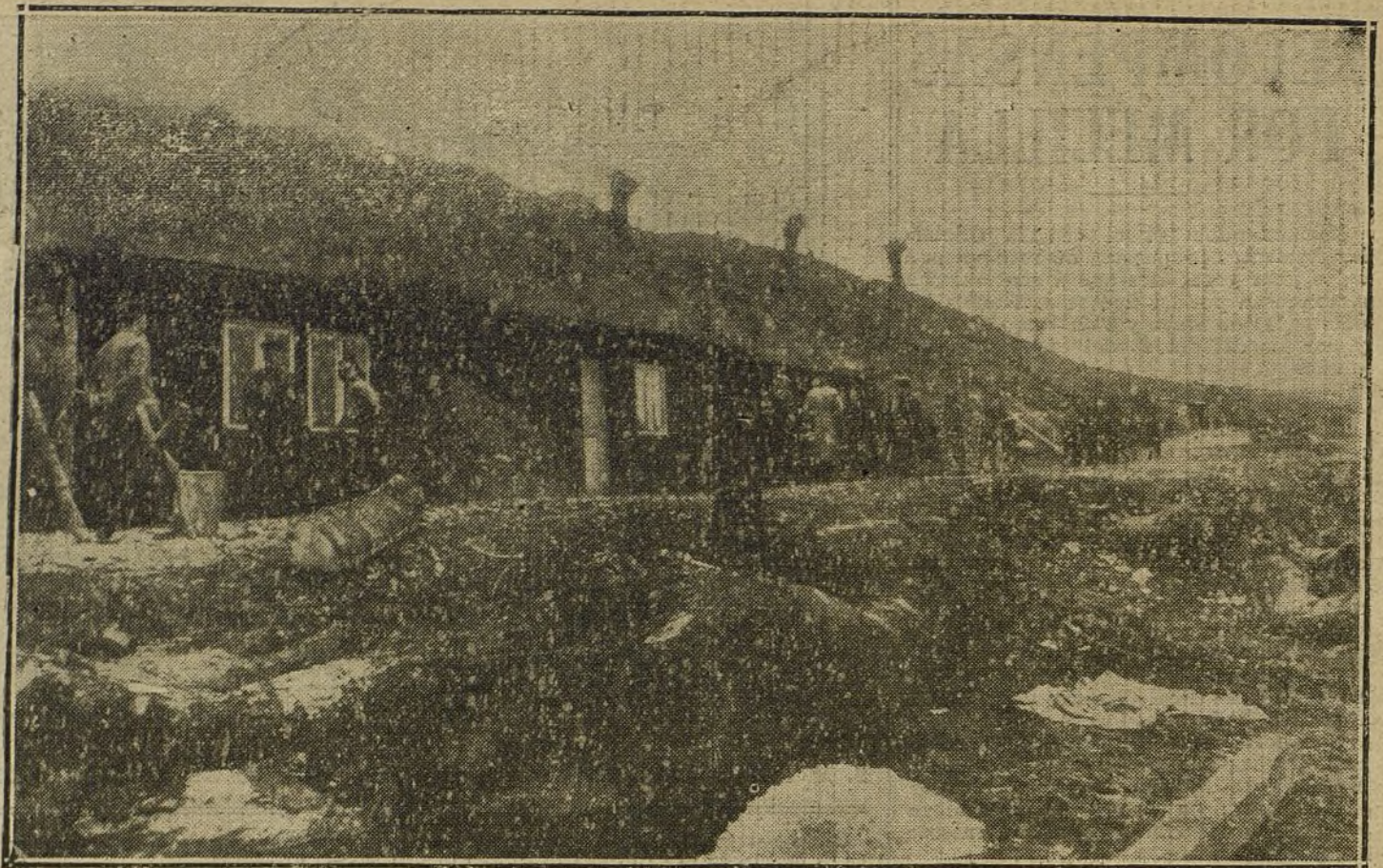
LA GUERRA EN OCCIDENTE.—Viviendas subterráneas construidas por los alemanes a lo largo de una colina en el Norte de Francia.

PARA TODO LO REFERENTE A PUBLICIDAD FRANCESA EN «LA TRIBUNA» DIRIGIRSE A NUESTRA AGENCIA EN PARÍS: RUE VIVIENNE, 22.