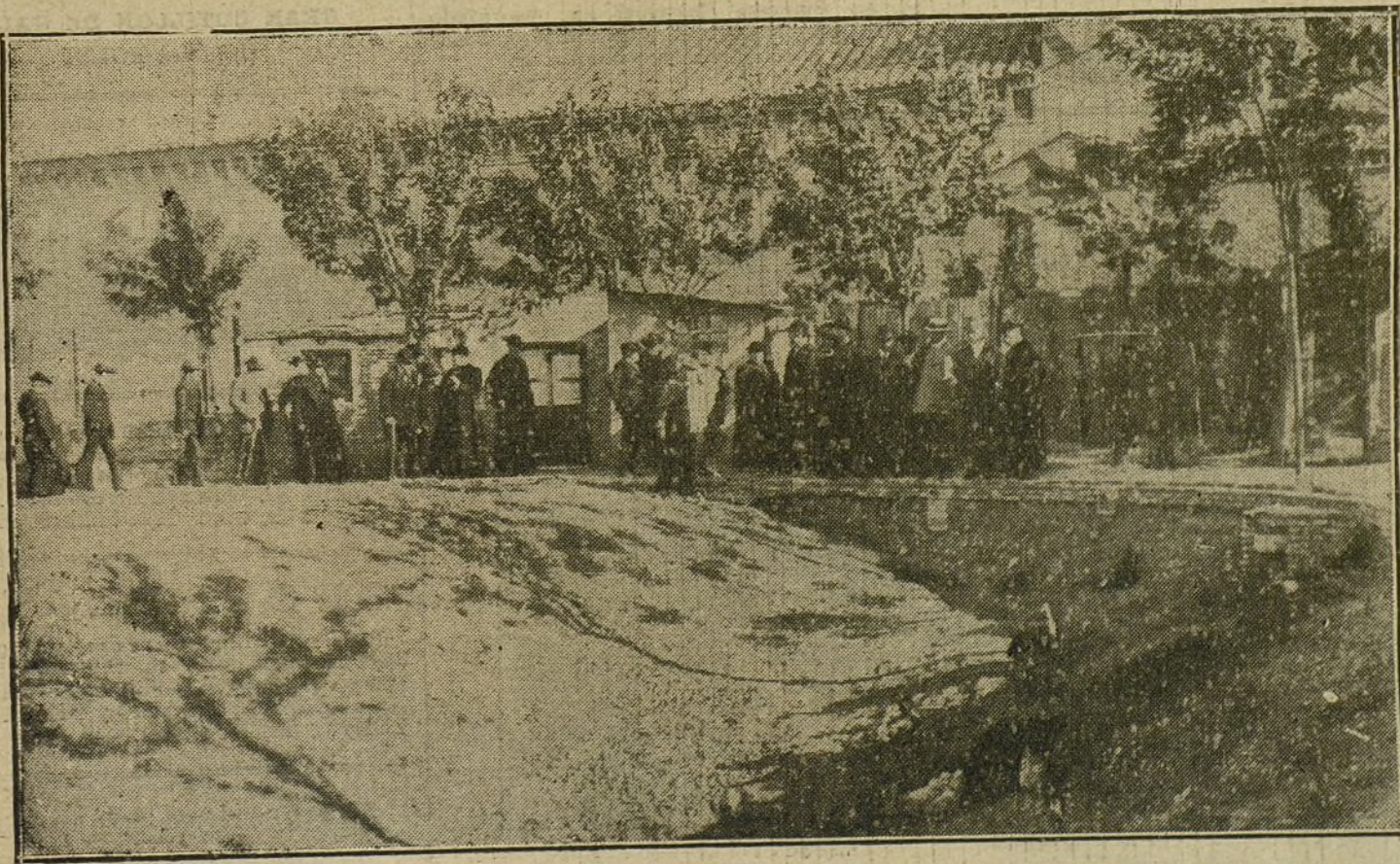
LA ASAMBLEA SOCIAL AGRARIA.—Grupo de asambleístas saliendo de visitar la granja del Carmen.

Definió las características políticas y comerciales de las tres regiones, leyendo una carta de un labrador de la provincia de Lérida, protestando contra el catalanismo y la mancomunidad. Excitó en la carta a que Castilla y Aragón impidan se implanten las zonas neutrales y los depósitos francos, que serían la ruina de la agricultura catalana.