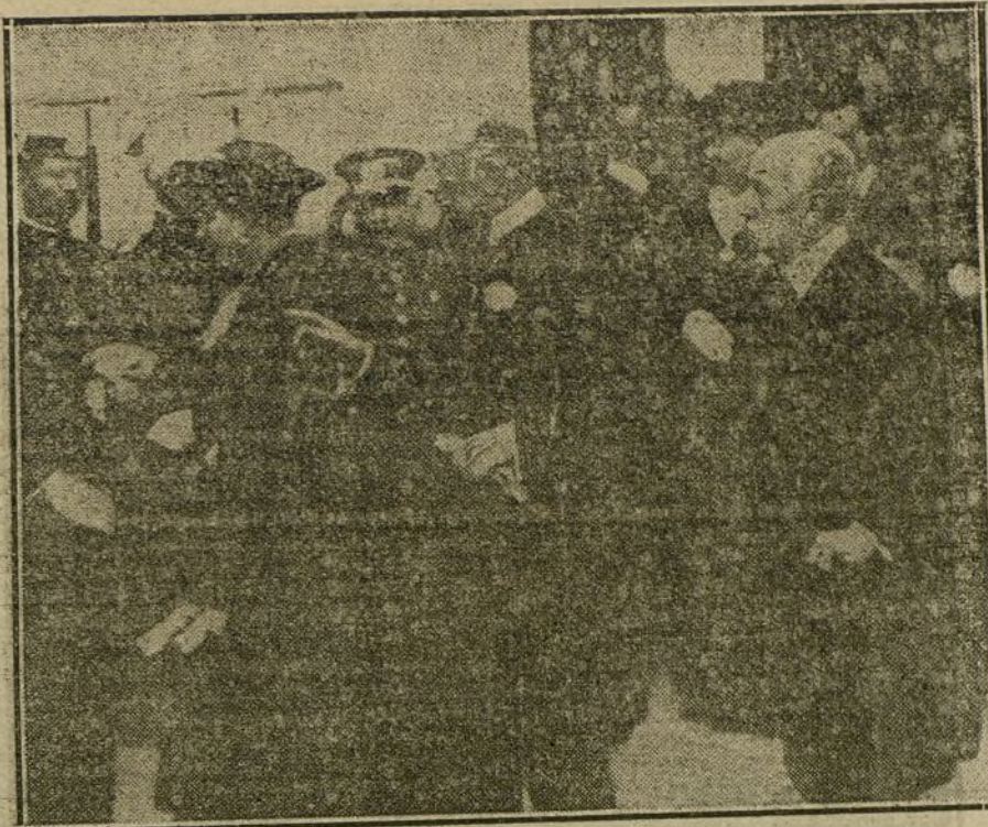
S. M. la Reina saliendo de inaugurar la Exposición de Encajes.