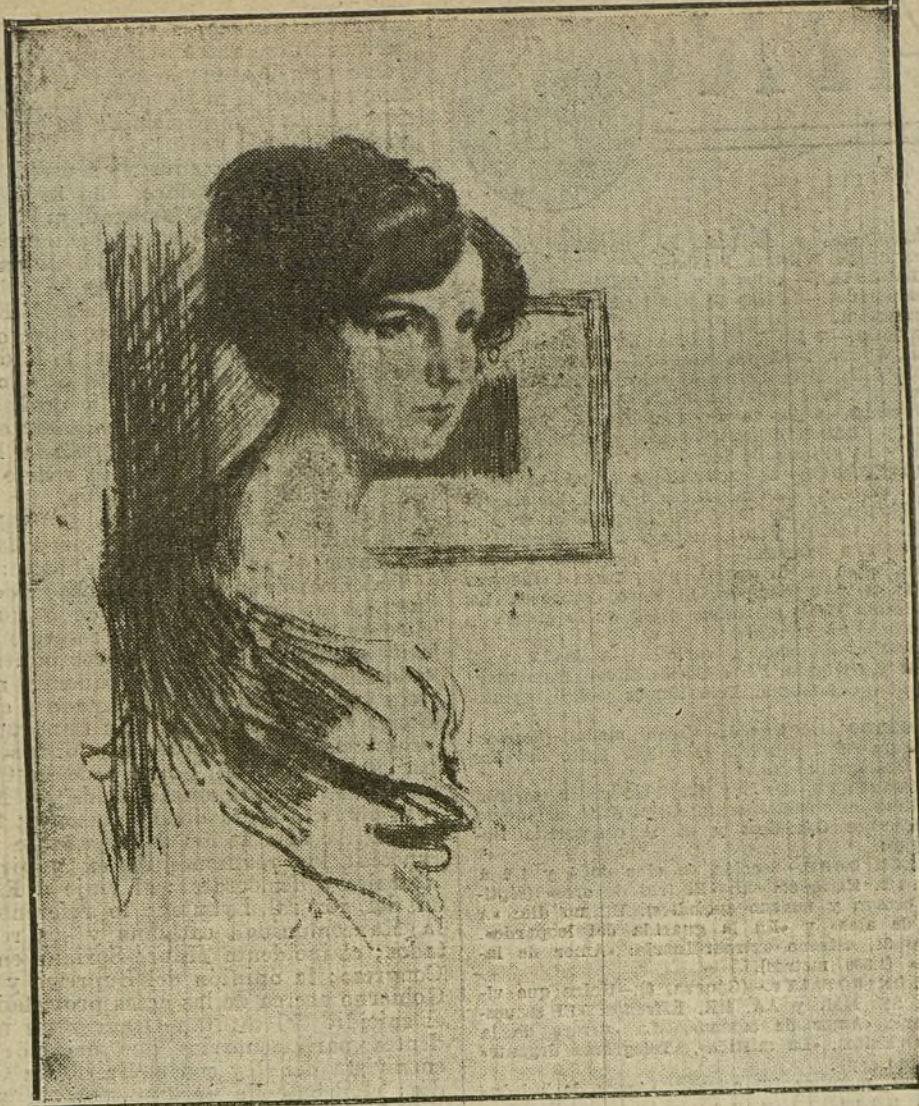
LA EXPOSICION DE BELLAS ARTES.—Aguafuerte de Fernando Labrada.

NUMERO DEL TELEFONO DE «LA TRIBUNA»: 4.444