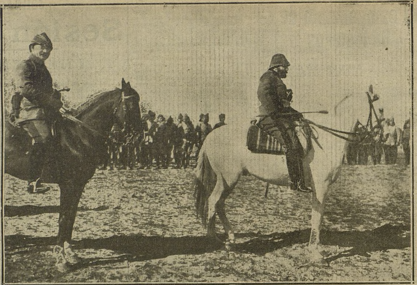
LOS TURCOS EN LA GUERRA.—Dschemal pachá con el coronel alemán von Frankenberg despidiendo en el desierto á las tropas turcas que marchan á incorporarse á las fuerzas del canal de Suez.

PARA TODO LO REFERENTE A PUBLICIDAD FRANCESA EN «LA TRIBUNA», DIRIGIRSE A NUESTRA AGENCIA EN PARIS: 22, RUE VIENNE, 22.