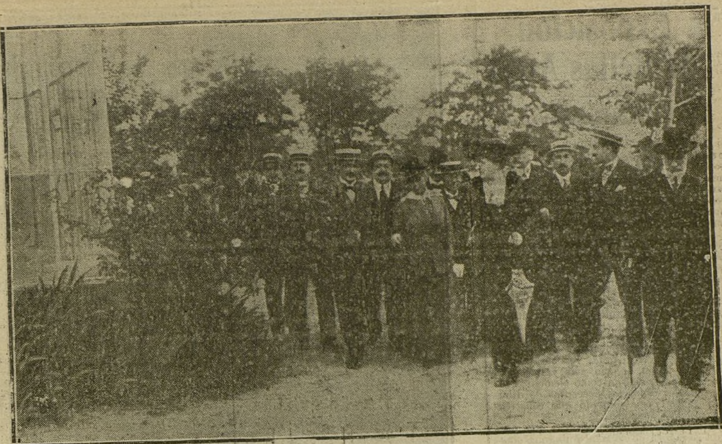
S. M. la Reina Victoria durante su visita al Sanatorio antituberculoso de Húmera, cuyo acto inaugural se ha verificado esta mañana.

Se asegura que la verdadera causa de no permitirse la publicidad del mensaje es que está redactado en términos amargos.