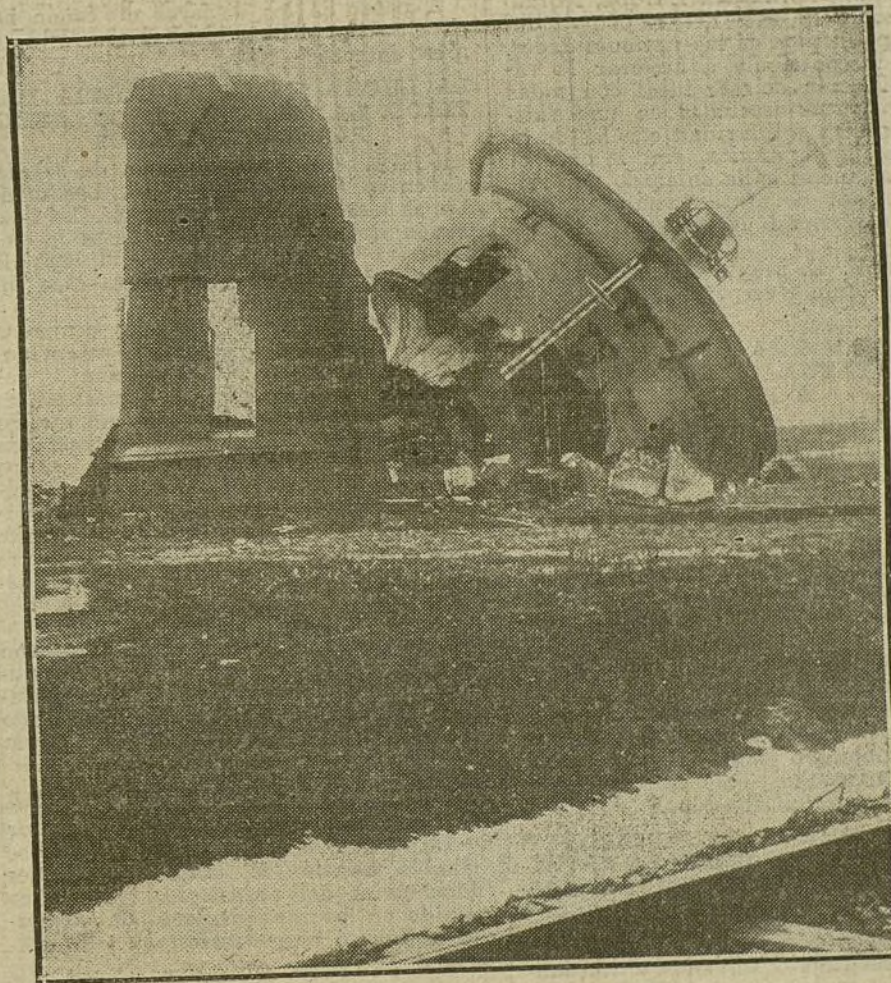
Depósito de agua de una estación ferroviaria de la Polonia rusa, destruido por los rusos en su retirada.