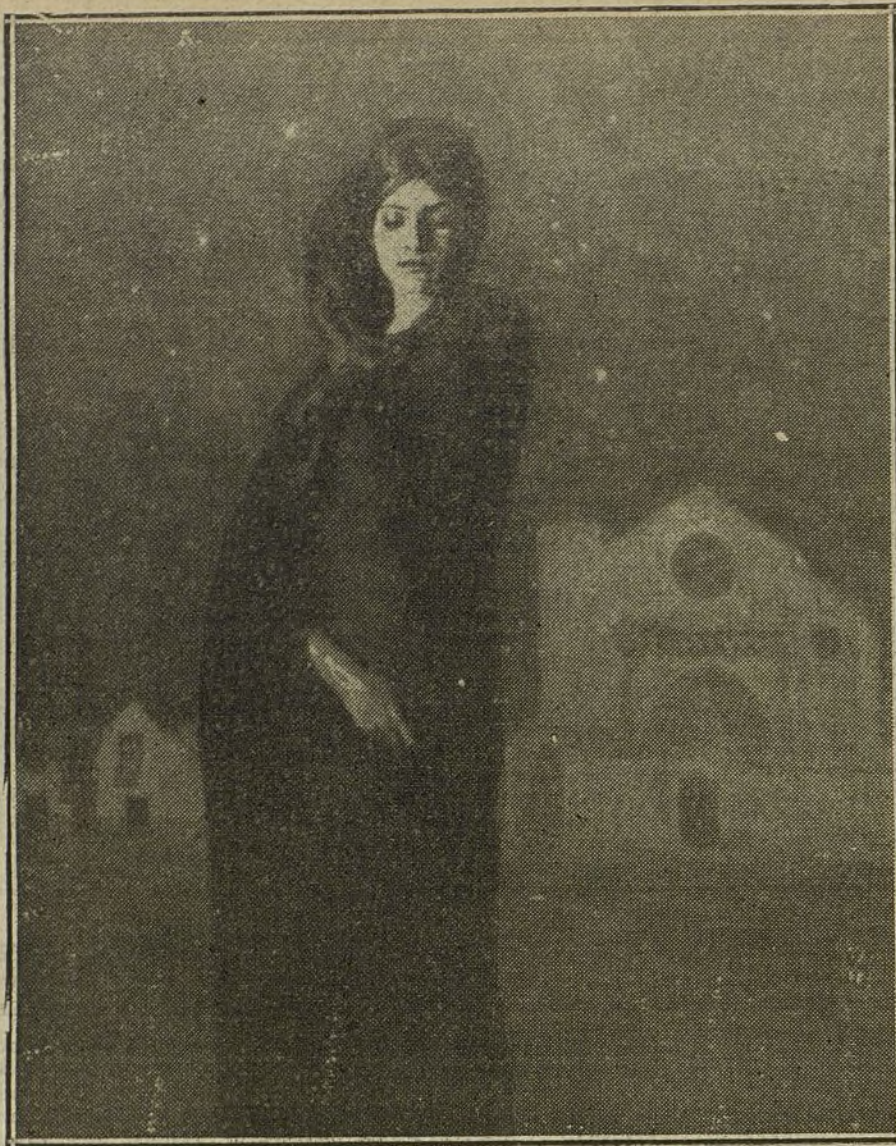
LA EXPOSICION DE BELLAS ARTES.—«Soleá», cuadro de Bacarissas.

En la Exposición de 1912 y en la actual ha dado dos pasos importantes, colocándose en primera línea. «Floreale» es un cuadro de dificultades concienzudamente vencidas que abre un brillante porvenir al notable pintor. Los detalles del cuadro son superiores al conjunto de la obra.