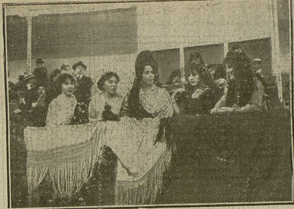
LA NOVILLADA DE AYER EN VISTA ALEGRE.—Grupo de señoritas que presidieron la fiesta. (Fot. VIDAL)

Nuestro material de guerra se debe calificar de excelente, y la organización en este sentido es sencillamente admirable.