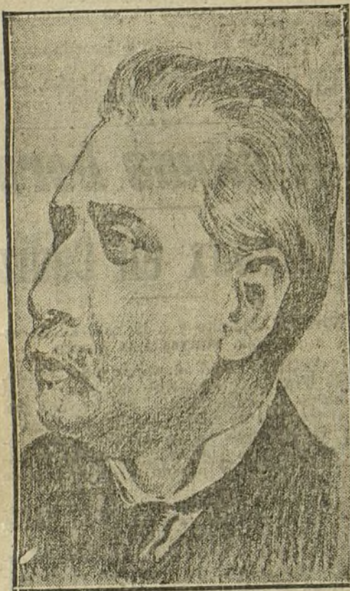
El nuevo presidente.

Durante todo el acto reinó el mayor entusiasmo, asomándose después Teófilo Braga, acompañado del Gobierno, los