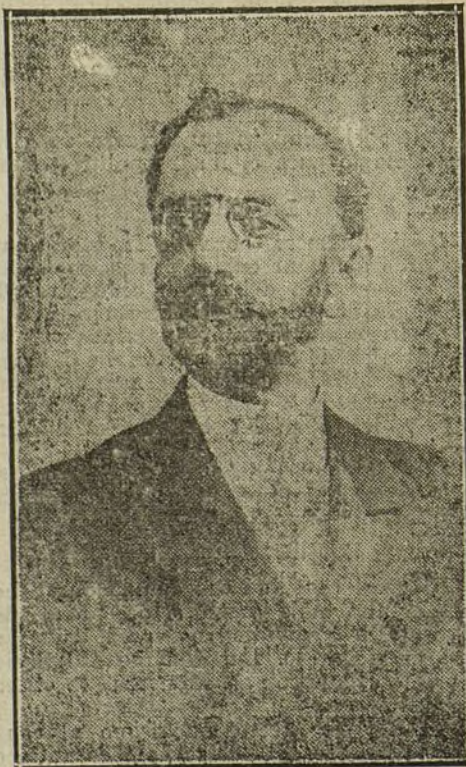
Don Pedro de Novo y Colson, cuya recepción se ha verificado hoy en la Real Academia Española.

Harto sabe este mozo que nadie es profeta en su tierra. Y habiendo expuesto tanta obra excelente en el salón Ituri-