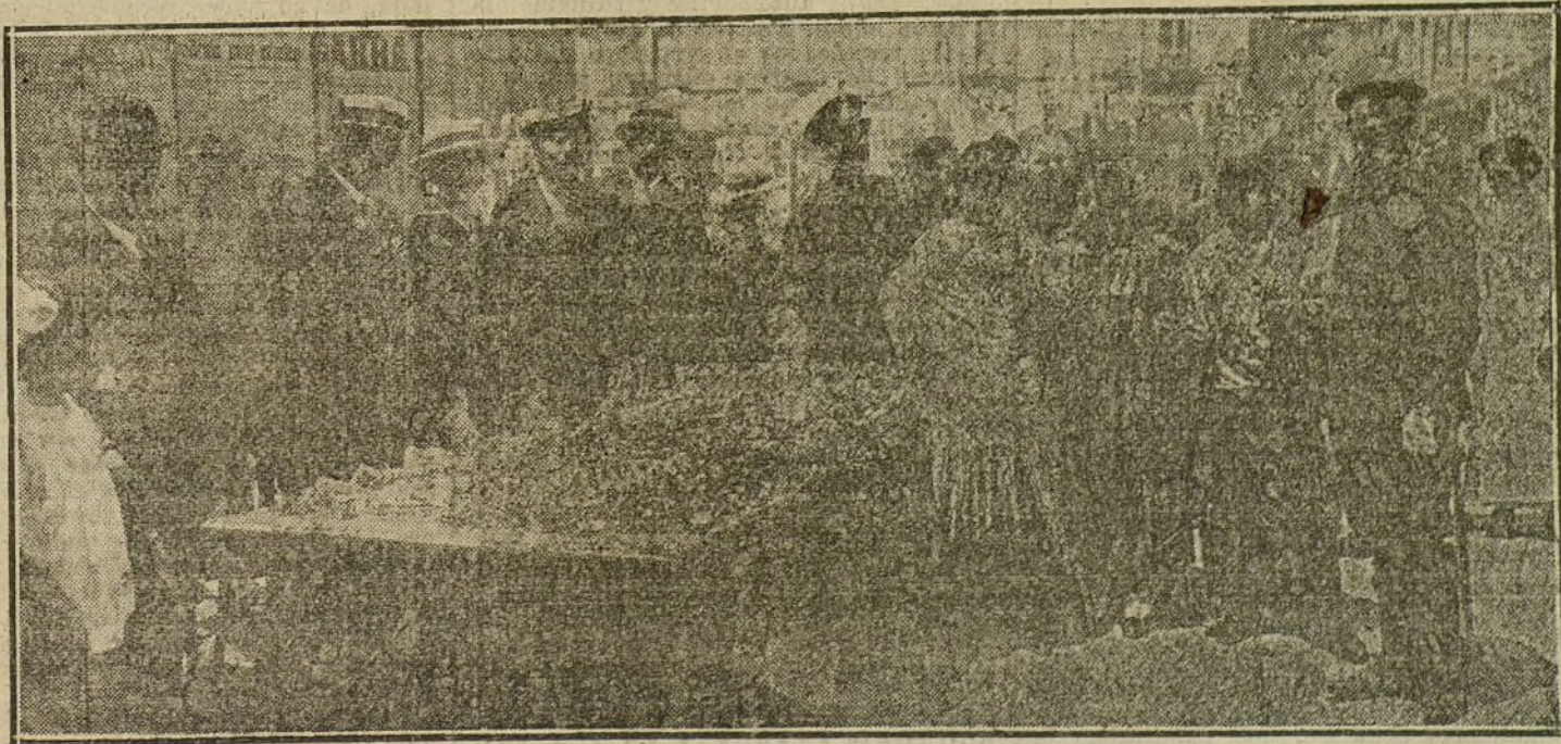
LA FIESTA DE LA FLOR.—Una de las mesas petitorias, establecida en la calle Mayor.