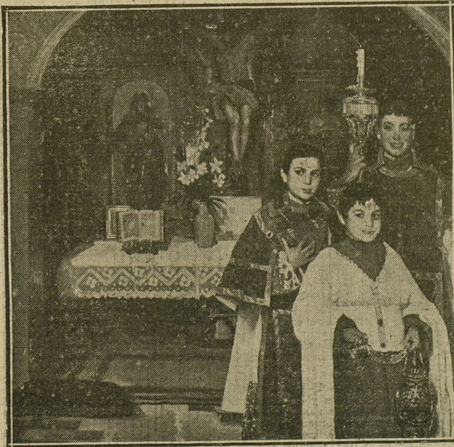
LA EXPOSICION DE BELLAS ARTES.—«La capilla del Cristo de la Misericordia de los duques de Osuna», cuadro de Cruz Herrera.

Al regresar las fuerzas a Cartagena desfilaron marcialmente por la población, presidiendo el desfile todo el vecindario.