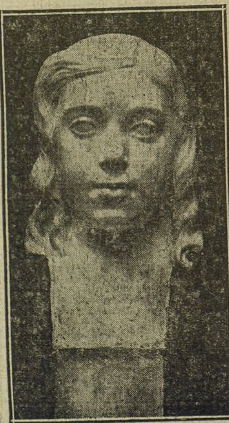
LA EXPOSICION DE BELLAS ARTES.—«Nenas», escultura de Marcos Coll.

El herido fué conducido al hospital, donde le amputaron el brazo.