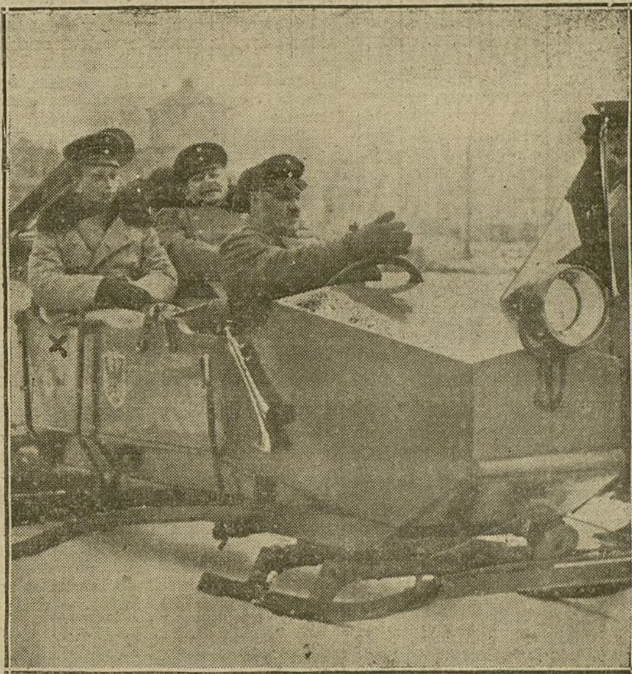
El Príncipe Joaquín de Prusia (X) en un trineo-automóvil, dirigiéndose al frente de batalla en la Polonia rusa.

Al Noroeste de Soissons, cerca de Moulin-Toutven, un asalto enérgico de los