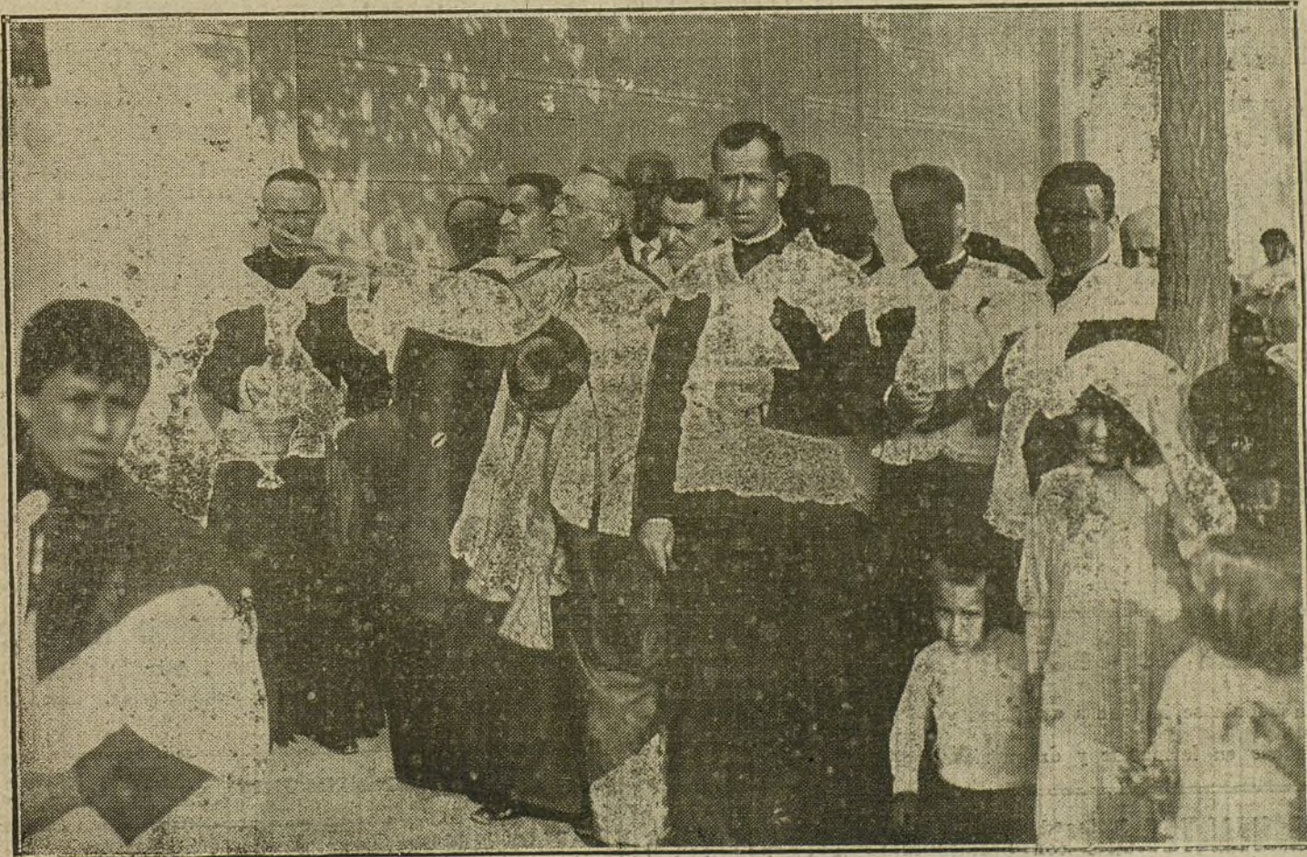
Inauguración de la nueva parroquia de Nuestra Señora de Covadonga (plaza de Manuel Becerra), acto verificado ayer tarde con gran solemnidad.

Pero D'Annunzio pertenece a aquella clase de personas, poco envidiables por cierto, que ya nada tienen que perder. «Creo que sería menos enemigo de los alemanes si tuviese menos acreedores». Deploro con toda mi alma la campaña insidiosa contra Alemania que se ha levantado en mi país. Sin tanto desconocimiento del mundo sería eso imposible; porque el que conozca Alemania y a los alemanes jamás hallará motivos de odio. Aún siempre tengo la esperanza de que el pueblo italiano reflexionará y volverá a su claro juicio, hoy perturbado. Pero vivimos en la época de los pulmones fuertes; el que sabe gritar con más fuerza es oído con el mayor agrado. Y allí donde no basta el pulmón se utilizan otras cosas que siempre se pueden obtener mercantilmente. Para esos fines no faltan nunca las ofertas.»