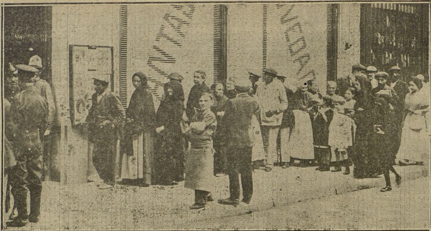
EL SANTO DE DON ANTONIO MAURA.—Cola formada á la puerta del Centro Maurista para recoger los bonos de las comidas repartidas ayer á los pobres con motivo del santo del Sr. Maura.

Sostiene el descrédito de los programas, de todos los programas esencialmente políticos. El pueblo está cansado de política verbalista; las necesidades económicas, todos los días agravadas; los problemas sociales agudizados, son patologías que no hallan remedio en un recetario retórico. El maurismo quiere ser, viene siendo desde el primer día, no un partido más, sino grupo político-social. Así