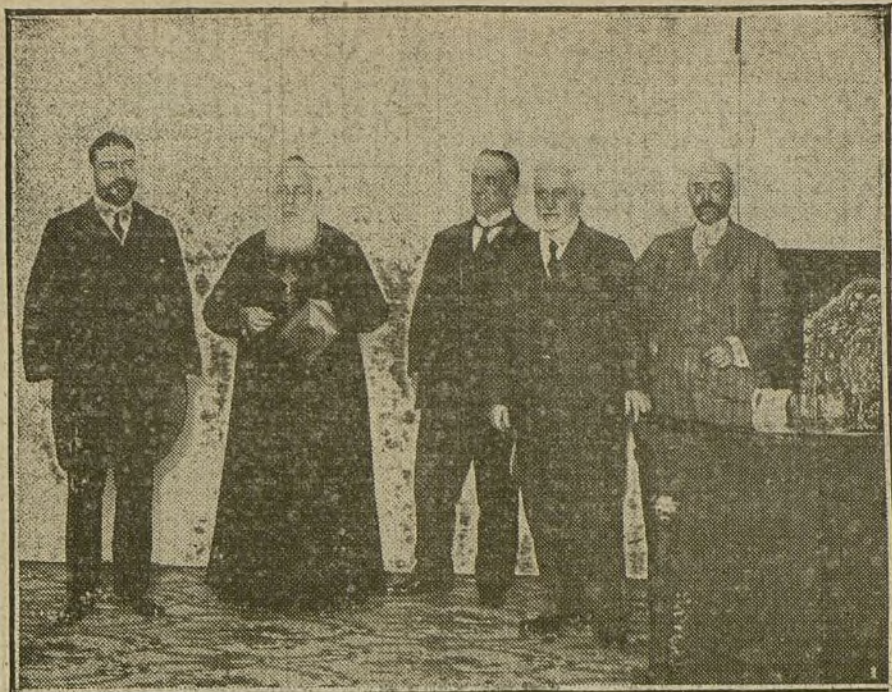
El obispo de Tignica, al terminar la conferencia dada ayer tarde en el Centro de Defensa Social, acerca de la acción de España en sus posesiones del Golfo de Guinea.

En el silencio de esta gigantesca ciudad casi vacía y cual vencida bajo el tórrido bochorno de las siestas abrasadoras, de las siestas reverberantes y sin viento, los aeroplanos franceses van, vuelven, giran majestuosos, como águilas que estuviesen emborrachándose de sol. Su moscardoneo se oye, día y noche, desde todas partes, y por igual sirve de consuelo