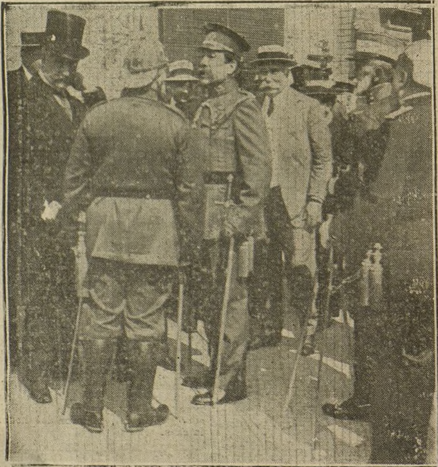
EL VIAJE DEL GENERAL ECHAGÜE.—El ministro de la Guerra rodeado de las autoridades locales á su llegada á Sevilla.

Habló de la democracia, y dijo que los mauristas la querían con la igualdad en la ley.