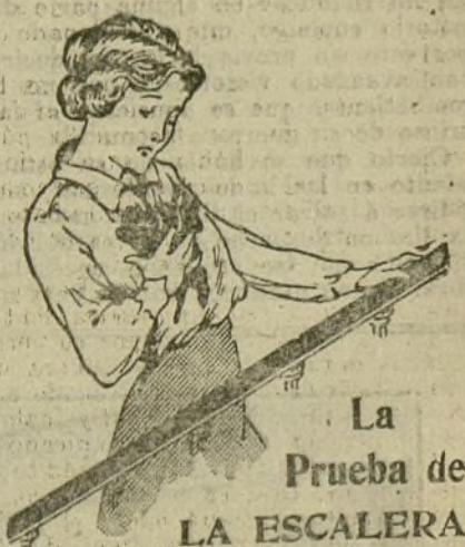
La Prueba de LA ESCALERA.

Los balcones de la calle de San Fernando aparecían engalanados.