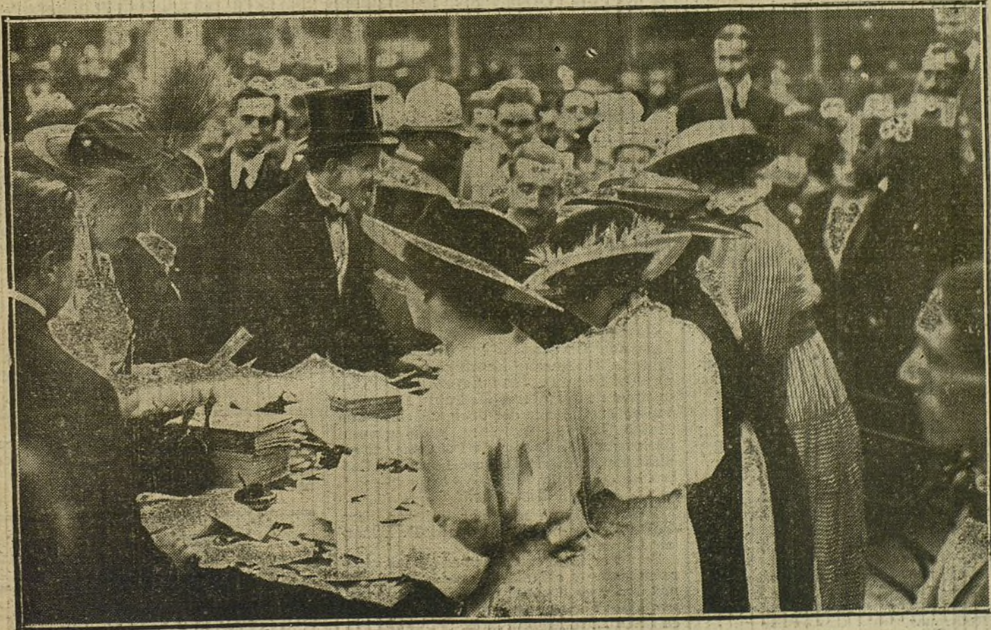
LA FIESTA DE AYER EN LA EXPOSICION.—SS. MM. en la «garden-party» celebrada ayer á beneficio de la Asociación de Pintores y Escultores.

La compañía Mendoza-Guerrero termina esta noche su campaña.