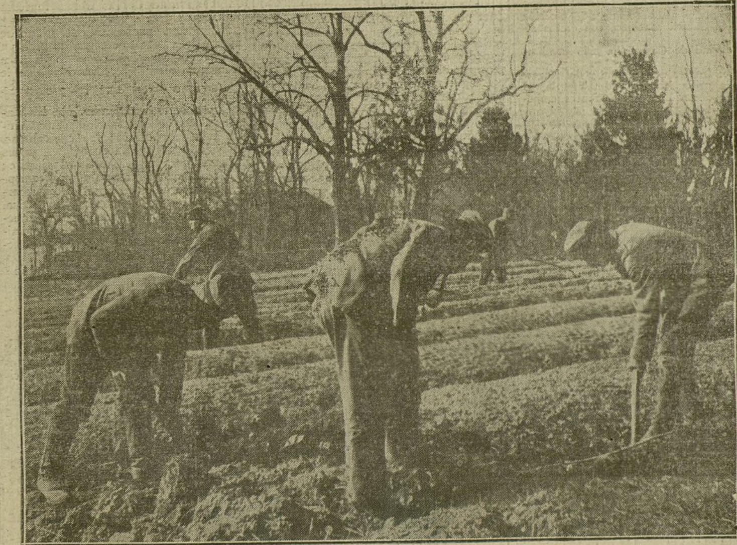
Soldados alemanes ocupados en cultivar de nuevo los campos devastados por los cosacos durante su huida por la Polonia rusa.

La esperanza de que Servia pudiese realizar en su totalidad las promesas iniciales que la Triple Entente hizo á Servia ha desaparecido casi por completo. Muchos políticos servios declaran abiertamente que Servia ha sido sacrificada por los aliados, y que de ninguna manera los servios cooperarían á la rea-