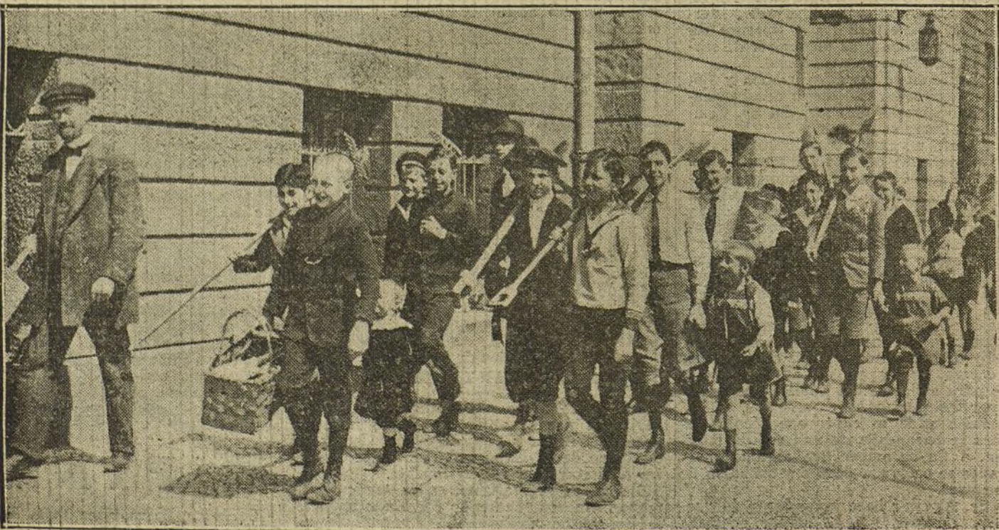
LA GUERRA, DESDE BERLIN.—Niños de las escuelas públicas dirigiéndose al campo para sustituir en las faenas agrícolas a los labradores que se encuentran en campaña.

Para el que quiera conocer un poco íntimamente los progresos de la nación vecina en los últimos cincuenta años y penetrar la índole de aquel pueblo hermano, resulta de un alto interés la lectura de este libro documentadísimo, escrito con arte supremo; la obra, en resumen, de un literato elegante y primoroso.