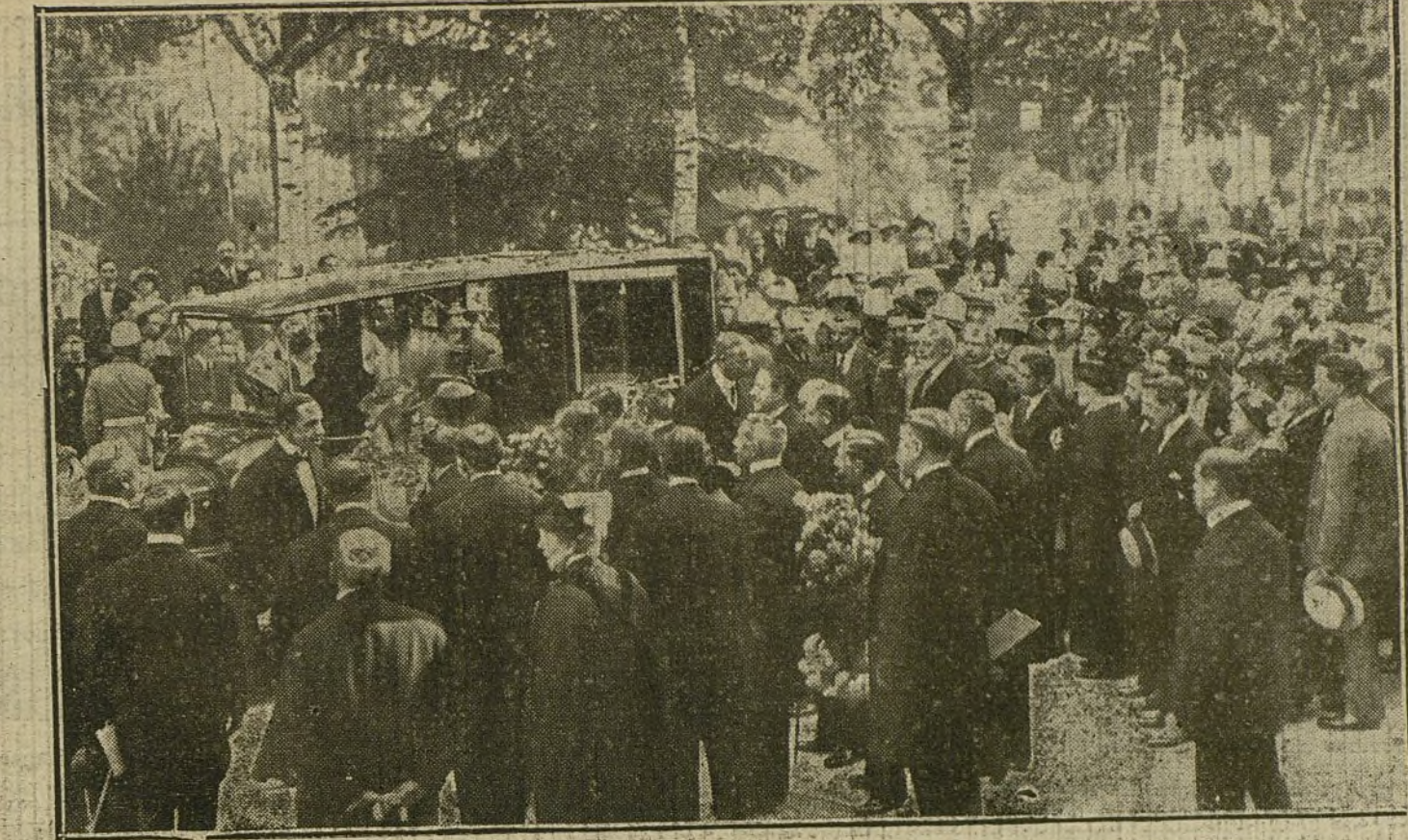
LA FIESTA DE AYER EN LA EXPOSICION DE BELLAS ARTES.—Llegada de SS. MM. al Retiro.