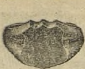
N.º 26143 Ptas. 25.