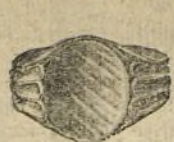
N.º 26143 Ptas. 30.