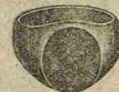
N.º 26156 Ptas. 60.