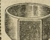
N.º 26185 Ptas. 90.