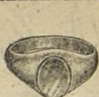
N.º 26141 Ptas. 15.