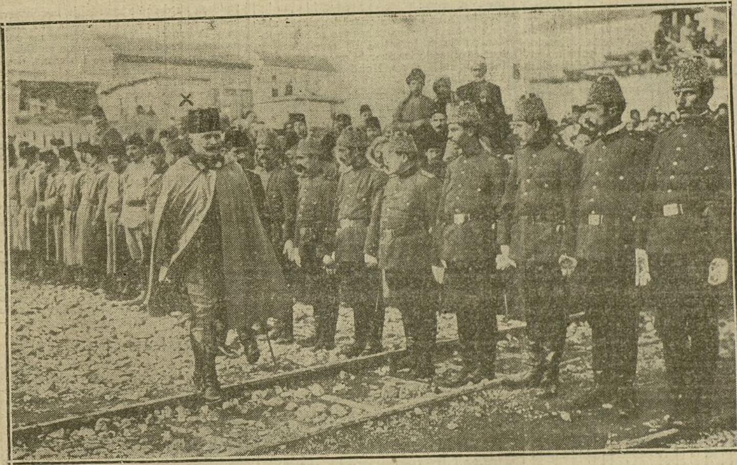
Fahkiddine Pascha, comandante de la 12 división turca, inspeccionando un regimiento de Damasco.

Las últimas derrotas rusas, que naturalmente no son desconocidas en las altas esferas políticas, el estancamiento total de la acción en los Dardanelos y, en último término, la intervención italiana, que hasta ahora ha producido casi ningún efecto, a pesar de las grandes esperanzas puestas en ella, han producido una gran desilusión en las más altas esferas rusas, dando a la vez mucha fuerza a los elementos favorables a la paz que existen ya en número bastante crecido entre los rusos, más influyentes en la política.