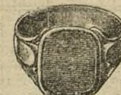
N.º 26157 Ptas. 70.