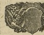
N.º 26179 Ptas. 75.