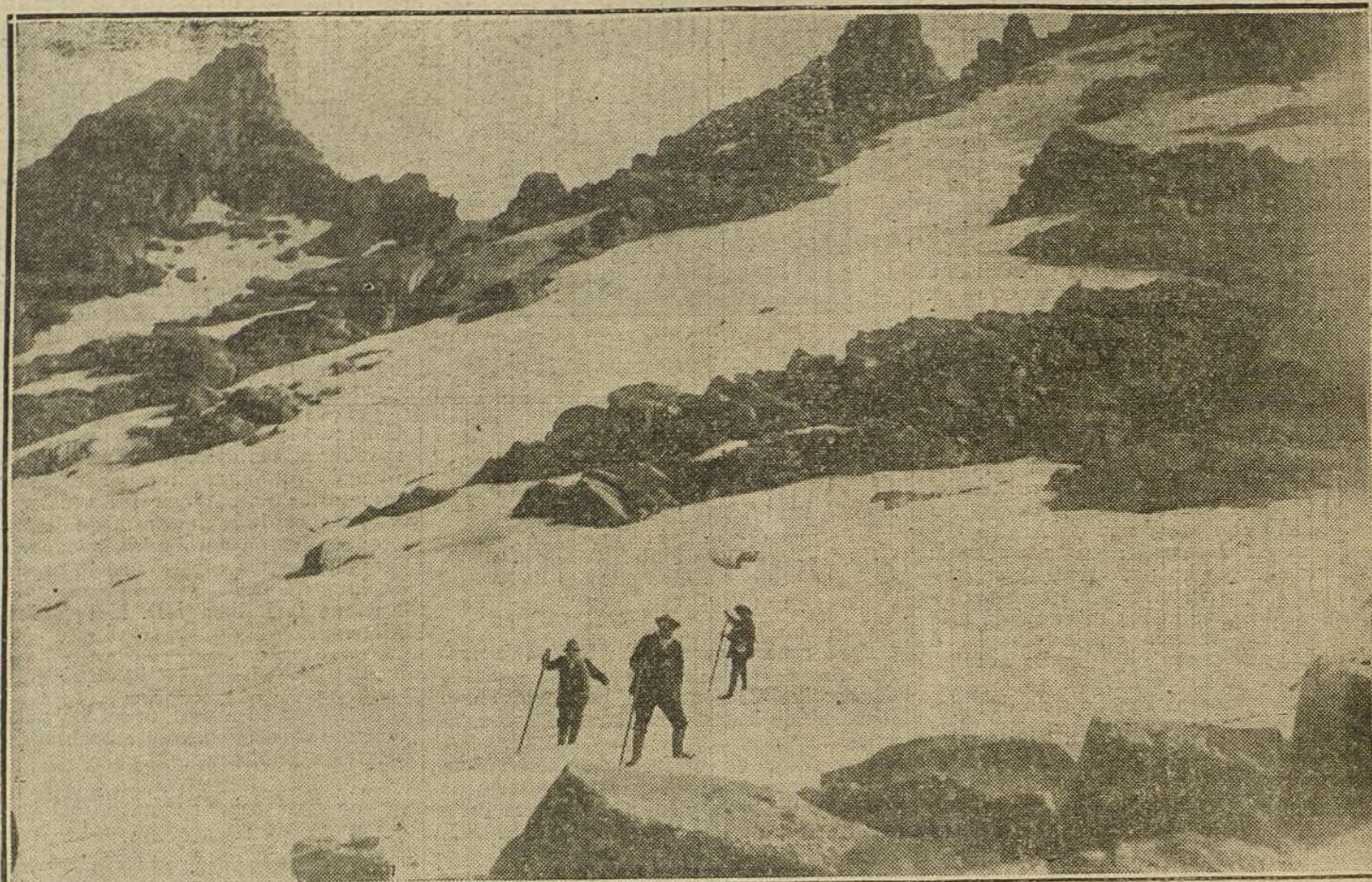
PANORAMAS ESPAÑOLES.—El Circo de Gredos. Excursionistas regresando de el pico Almanzor por el Cuchillar del Enano.

1.º Cardenal, en 2 h., 53 m., 39 s., 1 q.