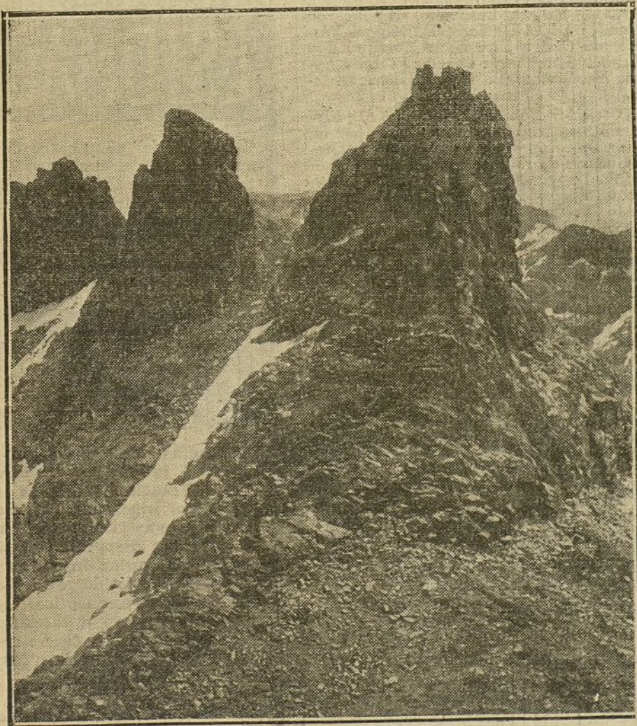
PANORAMAS ESPAÑOLES.—La sierra de Gredos. «El Ameal de Pablo».