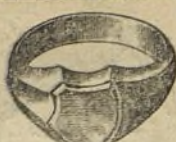
N.º 26143 Ptas. 20.