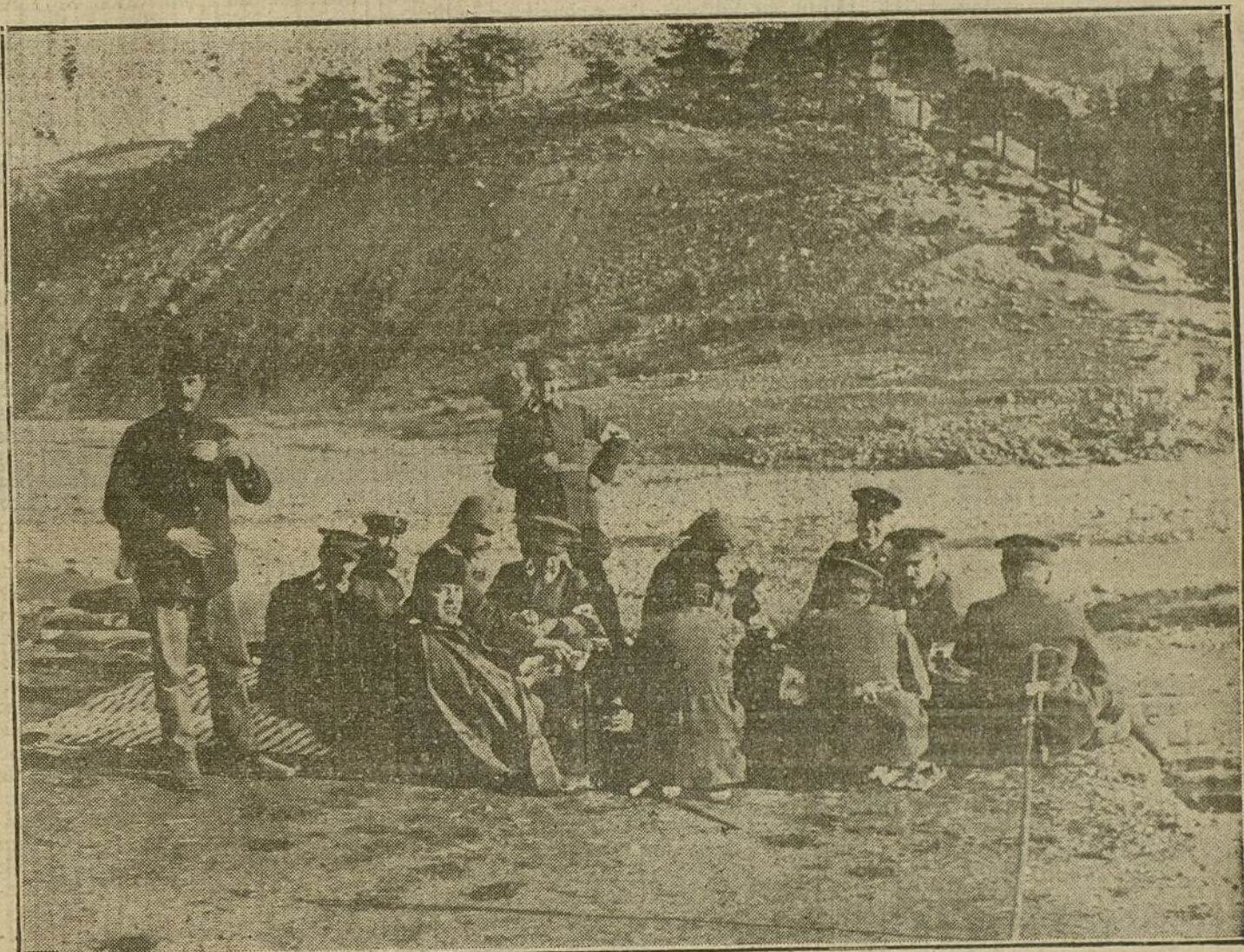
Soldados alemanes que han tomado parte en una expedición de la Cruz Roja, descansando en el monte Tauro.

FRANCIA Y «LOS EMBOSCADOS». —MATERIAL DE GUERRA A LOS RUSOS. — EL TRATO A LOS PRISIONEROS AUSTRIACOS.—LAS DECLARACIONES DEL PAPA, RECTIFICADAS.—COMBATE EN LOS DARDANELOS. — DIMISION DEL MINISTRO DE LA GUERRA RUSO. — DINERO ALEMAN PARA EL EMPRESITO DE GUERRA INGLES. LOS SUBMARINOS ALEMANES.—OTROS TELEGRAMAS Y RADIOGRAMAS