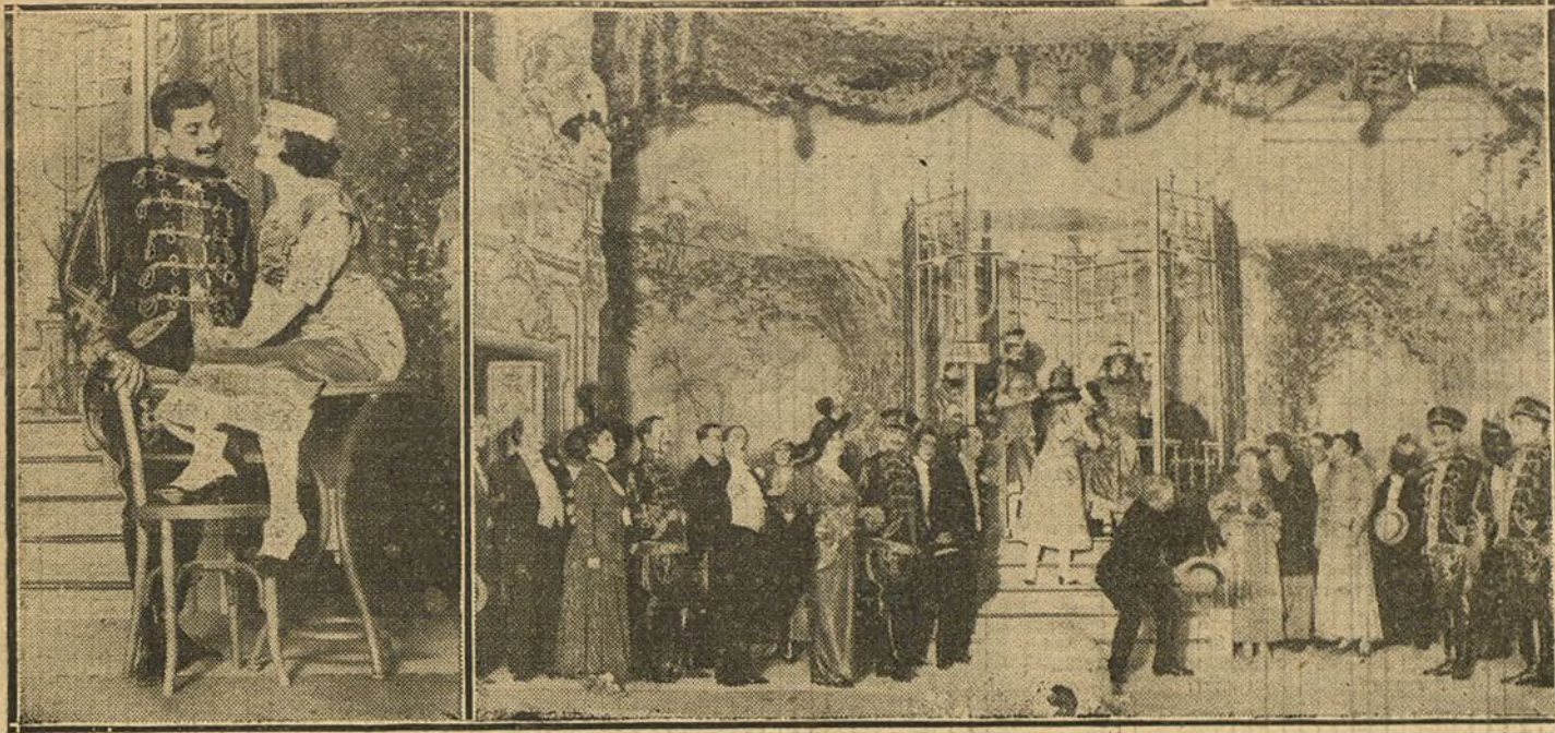
Dos escenas de «La invitación al vals», opereta estrenada anoche en el teatro de Eslava con feliz éxito.

ocutor tiene un acento de ilusión, de esperanza. ¡Quién había de decirnos que pretende ser hoy el salvador de Inglaterra el que ayer fué silbado y casi apedreado al salir de pronunciar sus radicales discursos!