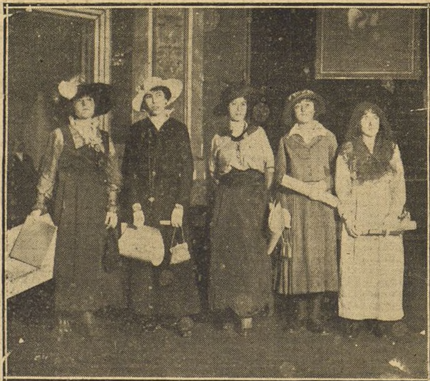
Señoritas que han obtenido premios en el pasado curso universitario, cuyos diplomas les fueron entregado en la solemne fiesta académica de ayer.

El ingeniero dió un banquete en honor del ministro turco.