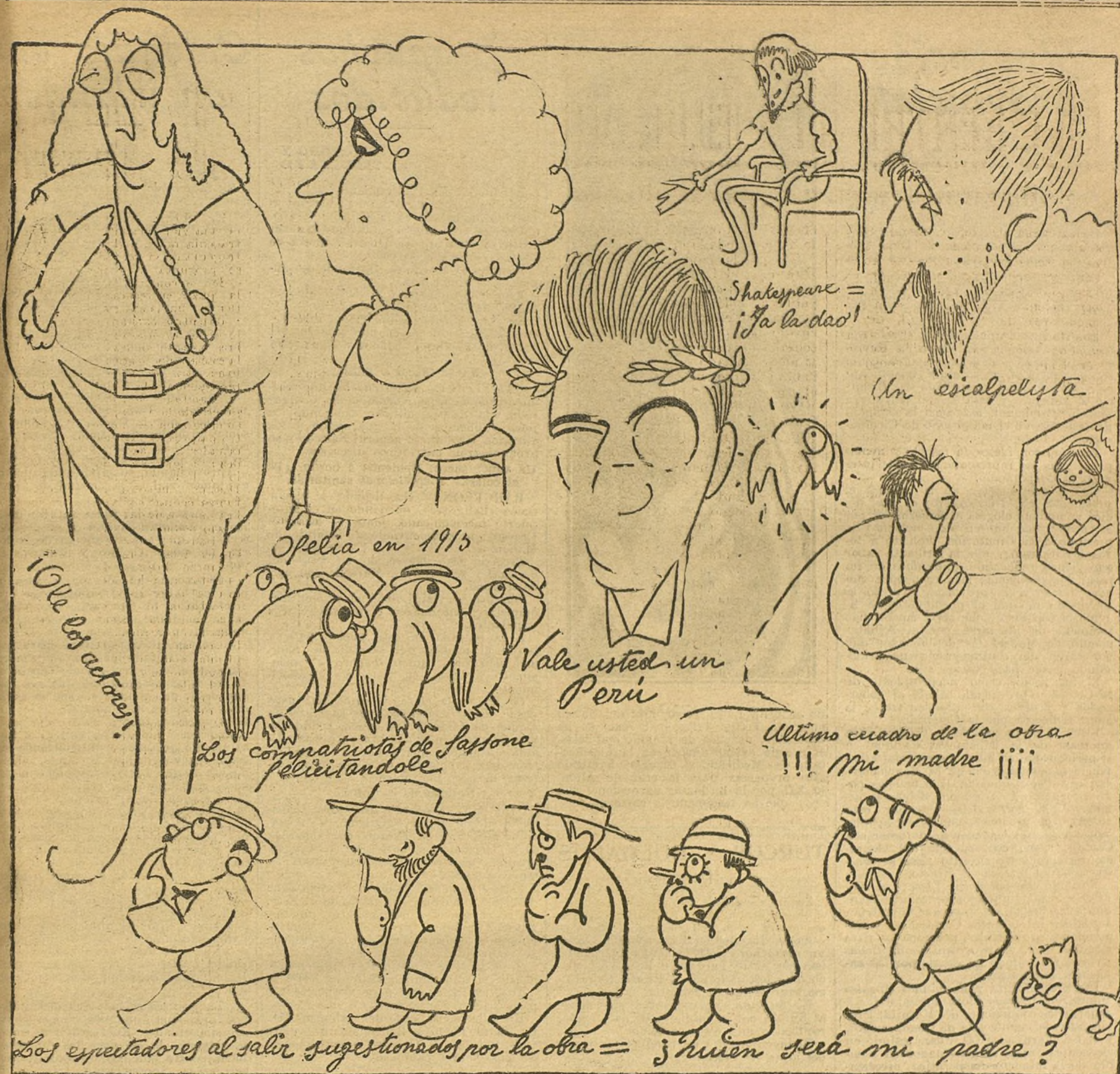
Apuntes de la representación de «El intérprete de Hamlet», por BAGARIA

tono predominante, á saltos bruscos, como es razón, por ser de un poeta anárquico á fuerza de ser libre, duro y sentimental, normal y pintoresco, bueno y anodaz. Tan pronto semeja la tragico-media un sainete, como alcanza las cimas de la tragedia, como es una comedia galana, como se despena en los abismos de la locura. Lógica, reglas preceptivas, moldes usuales, con todo eso Sassone se ha hecho unas pajaritas de papel. Escribe como le dicta su impulso, su estado momentáneo y el punto concreto que desarrolla. Unas veces se eleva con las alas del lirismo; otras, caricaturiza; luego, solloza; rie después... Es contradictorio como un niño, y como un niño, sano y afectivo.