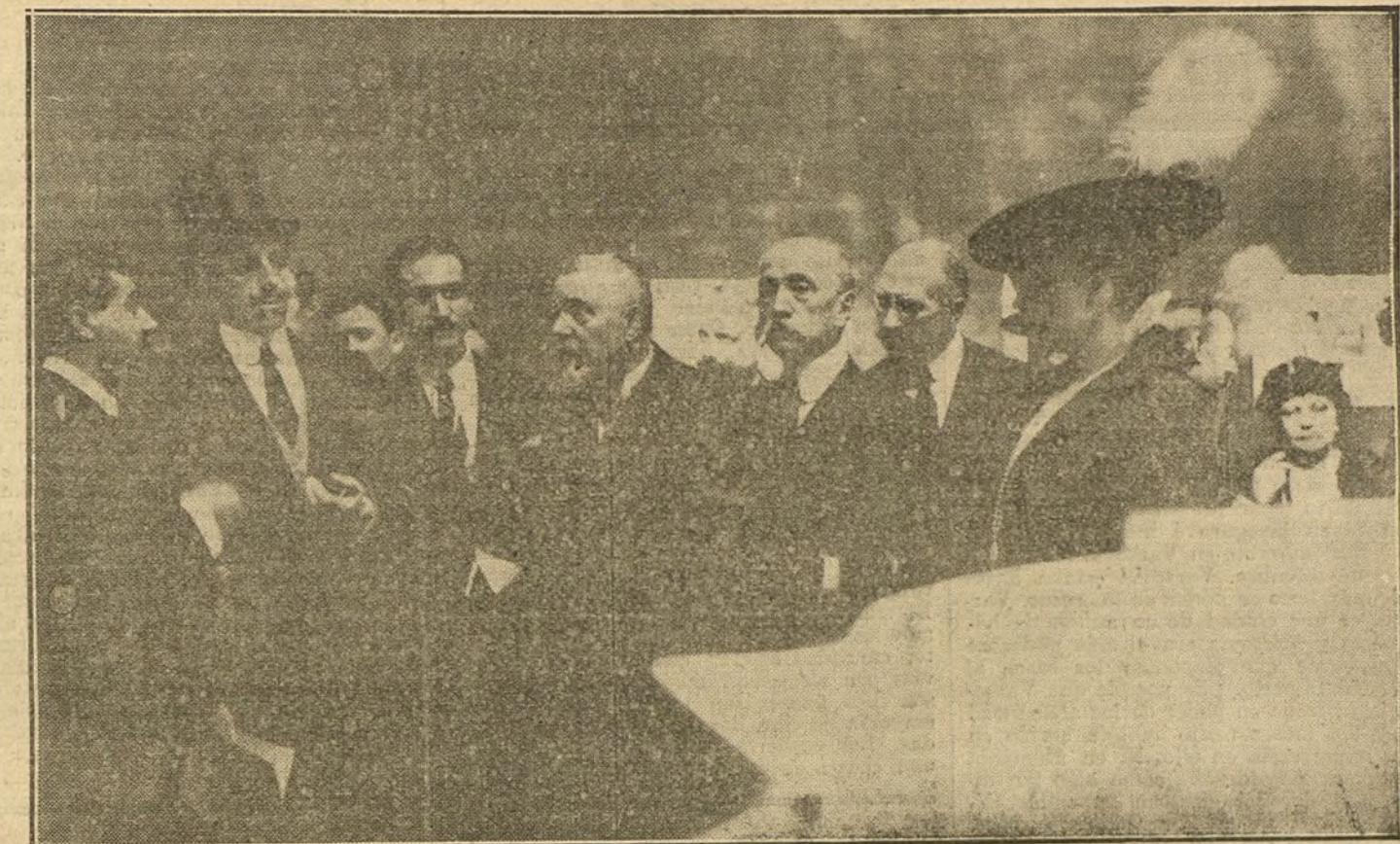
EL CENTENARIO DE CERVANTES.—SS. MM. y el presidente del Consejo, durante la inauguración de la Exposición de anteproyectos para el monumento a Cervantes.

Al pedir la hospitalidad a estas líneas trazadas a vuelo de pluma a LA TRIBUNA, sólo busco rendir un homenaje de simpatía y amistad a la familia del pobre José María, y un tributo de cariño y admiración