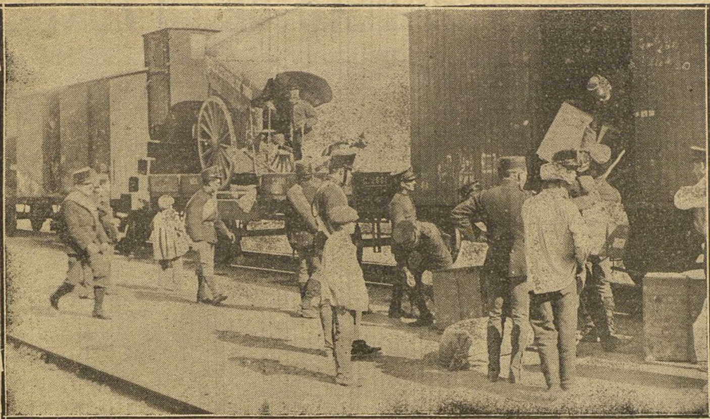
MANIOBRAS MILITARES.—Desembarco en la estación de Valdemoro de material y municiones con destino á las escuelas prácticas de ametralladoras.

claros, suaves y alegres y una sonrisa constante. Una de ellas, sobre todo, es toda una real moza, de una esplendorosa hermosura. A la mesa de al lado hay dos mujeres, las dos jóvenes también. Una viste completamente de negro y es de una belleza singular. Está pálida y su palidez lo es de tristeza. Apenas si habla con su compañera. En uno de los ángulos de la habitación hay dos jóvenes polacos. De uno de ellos se apoderó ya la embriaguez, el otro no tardará mucho en caer en sus brazos. Dos pájaros de alto vuelo se les andan en torno. En el ángulo opuesto dos señores parecen hablar de negocios. En una pequeña habitación contigua se ve á un señor de bastante edad trincando alegremente con una encantadora sirena de alquiler.