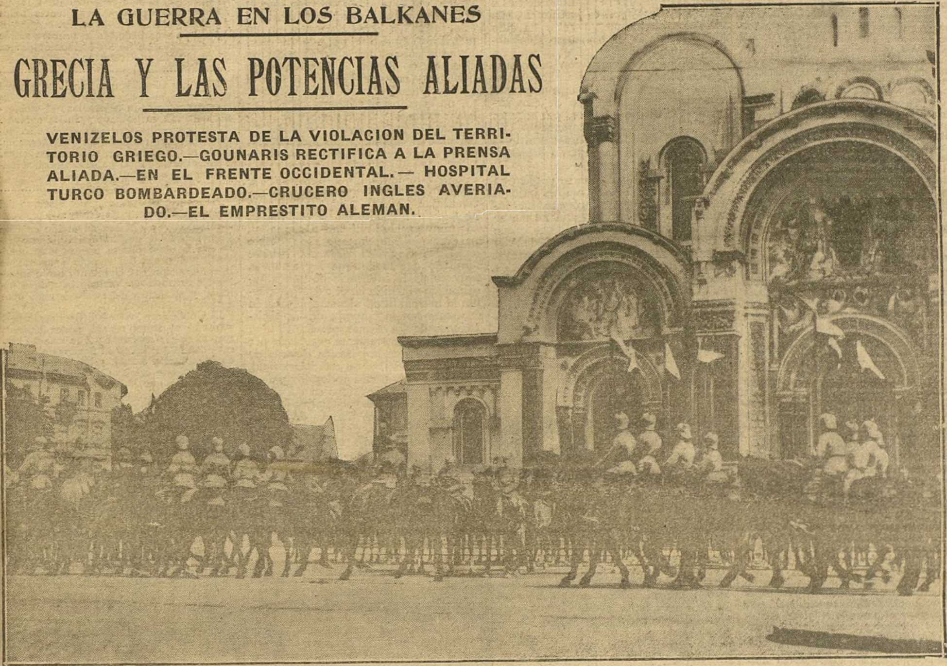
El conquistador de Varsovia, el Príncipe Leopoldo de Baviera, pasando revista á sus tropas delante de la catedral ortodoxa de Varsovia.

VENIZELLOS PROTESTA DE LA VIOLACION DEL TERRITORIO GRIEGO.—GOUNARIS RECTIFICA A LA PRENSA ALIADA.—EN EL FRENTE OCCIDENTAL.—HOSPITAL TURCO BOMBARDEADO.—CRUCERO INGLES AVERIADO.—EL EMPRESTITO ALEMAN.