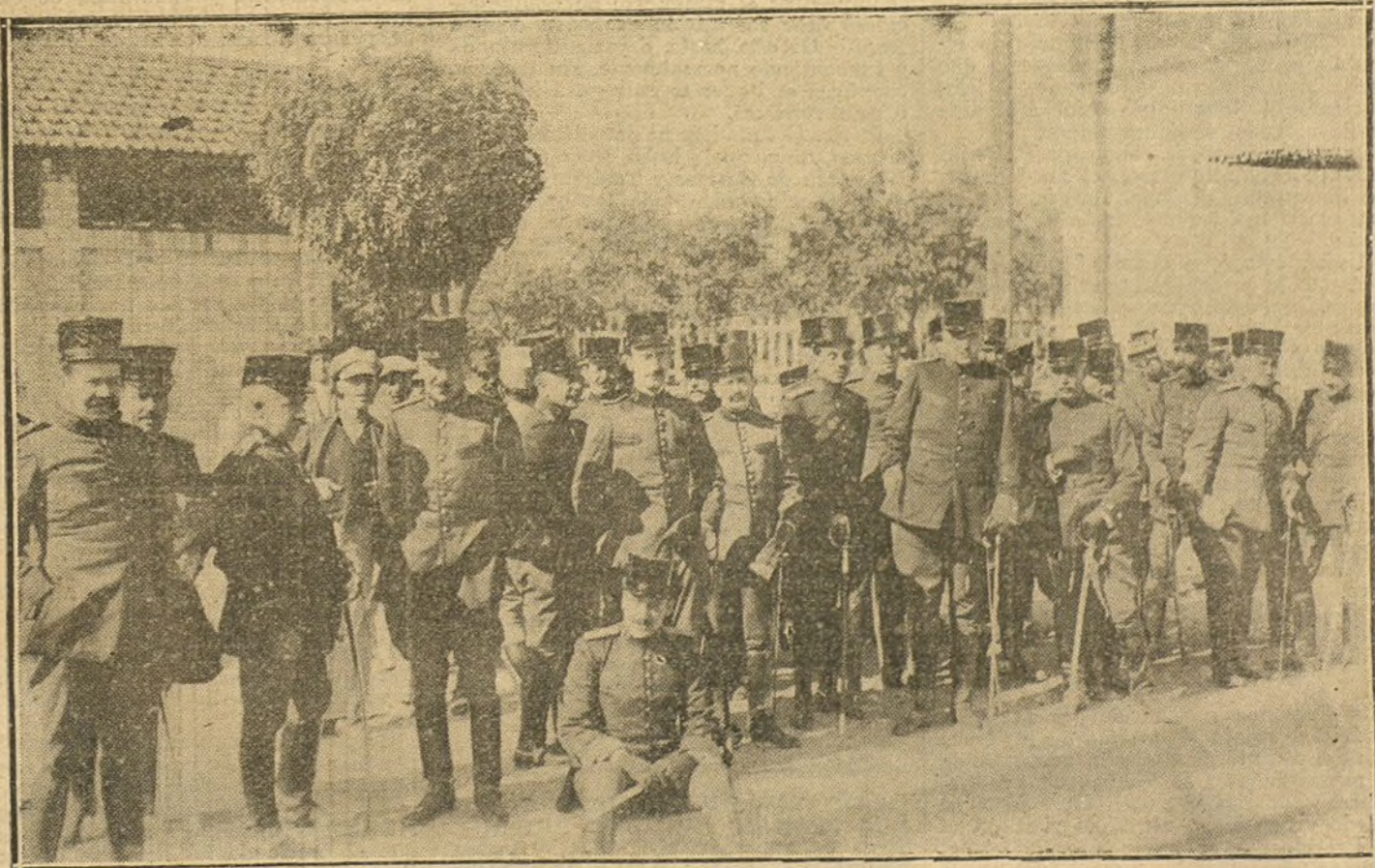
MANIOBRAS MILITARES.—Llegada á la estación de Valdemoro de los jefes y oficiales que asisten á las maniobras de ametralladoras.