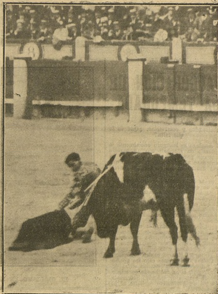
LA CORRIDA DE AYER EN MADRID.—Uno de los pases que dió Belmonte en su gran faena de muleta al sexto toro.

La fábula, que se expresa con la rudeza de una masa de hierro; las serranillas, que se cimbrean como flores abrilianas; los romances, elegantes y flexibles como el acero de una espada toledana; las novelas picarescas, sal y pimienta de nuestra tierra; el musical lenguaje que emplearon los místicos para trasladarnos sus arrebatos de amor divino; la prosa severa y hosca de nuestros historiadores; la gracia de las letrillas y de los madrigales; la encantadora ingenuidad de las églogas; la robusta musa de nuestros dramaturgos, nos hará en esa fiesta del idioma acordar-