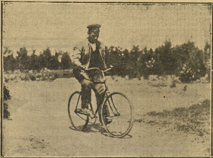
Un antiguo campeón ciclista alemán, que ha perdido los brazos en la guerra, y gracias a los progresos de la ortopedia puede seguir montando en bicicleta.

PARA TODO LO REFERENTE A PUBLICIDAD FRANCESA EN «LA TRIBUNA», DIRIGIRSE A NUESTRA AGENCIA EN PARIS: 22, RUE VIENNE, 22