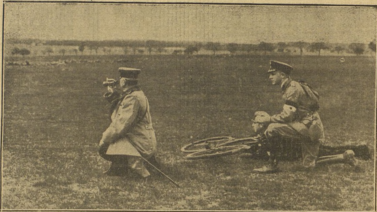
EL CICLISMO EN LA GUERRA.—Sanitarios militares presenciando un combate.

Nosotros oímos decir á muchos: «Esto no está mal; pero aquel Kindelán y aquel Machín sabían y saben más que todos juntos.»