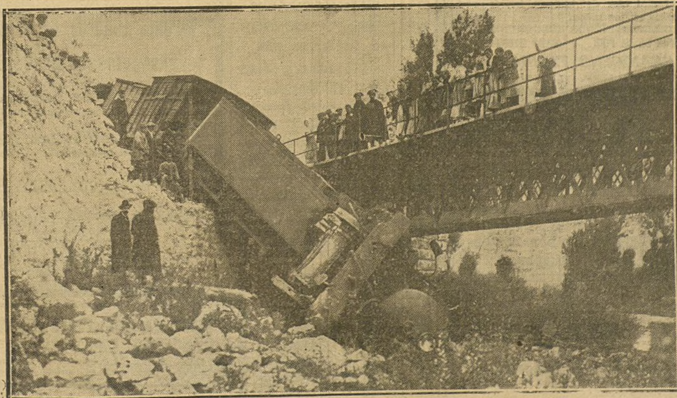
Estado en que quedó la máquina del tren descarrilado en el puente de la Horadada, suceso del que resultaron varios heridos.