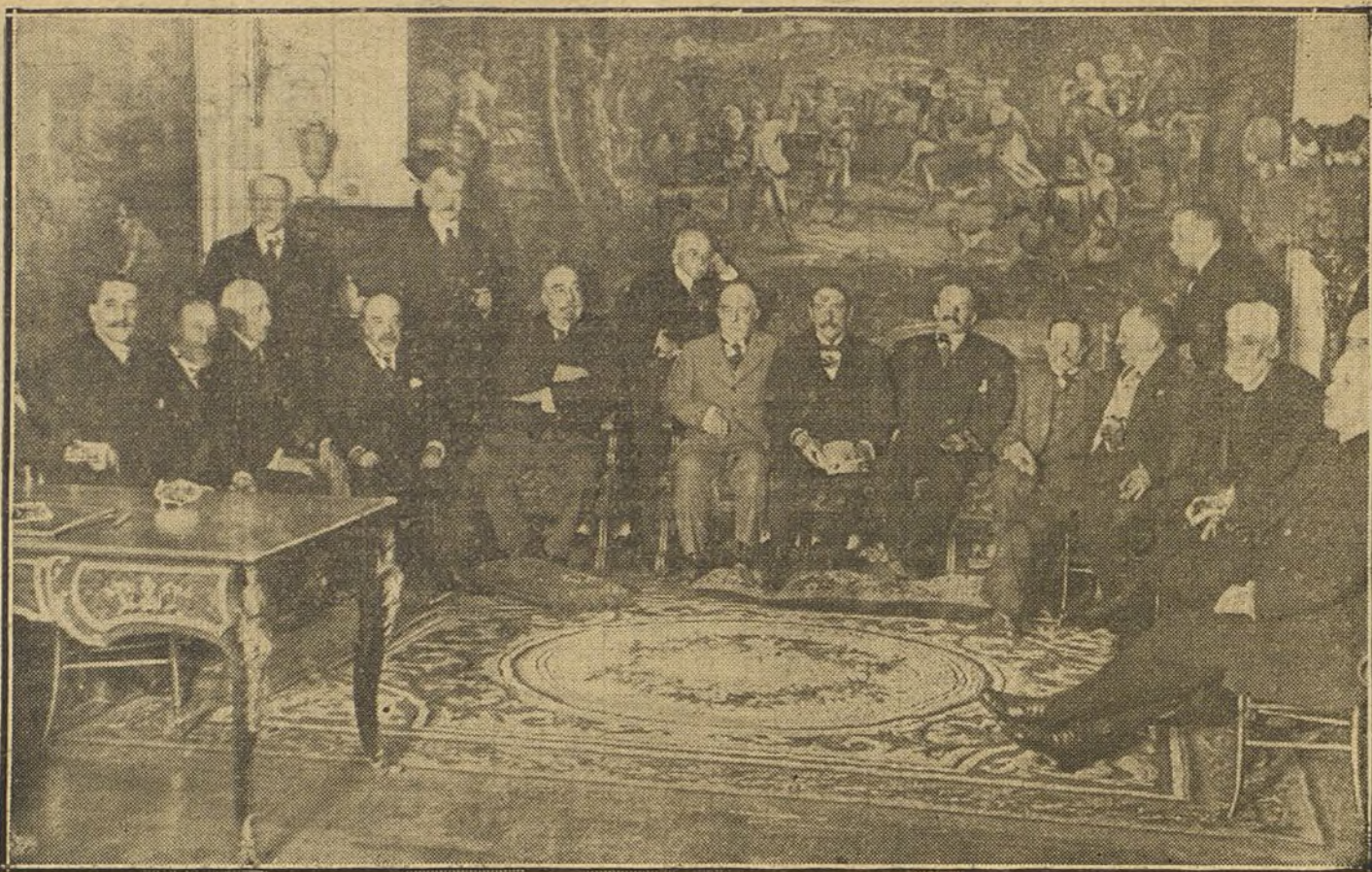
Grupo de ex ministros liberales que asistieron ayer á la reunión en casa del conde de Romanones.

El secretario del Comité de exploradores ha recibido un telegrama diciendo que S. A. la Infanta Doña Beatriz no asistirá á la fiesta de la bendición de la bandera; pero figurará como madrina, enviando especial delegación para esta parte.