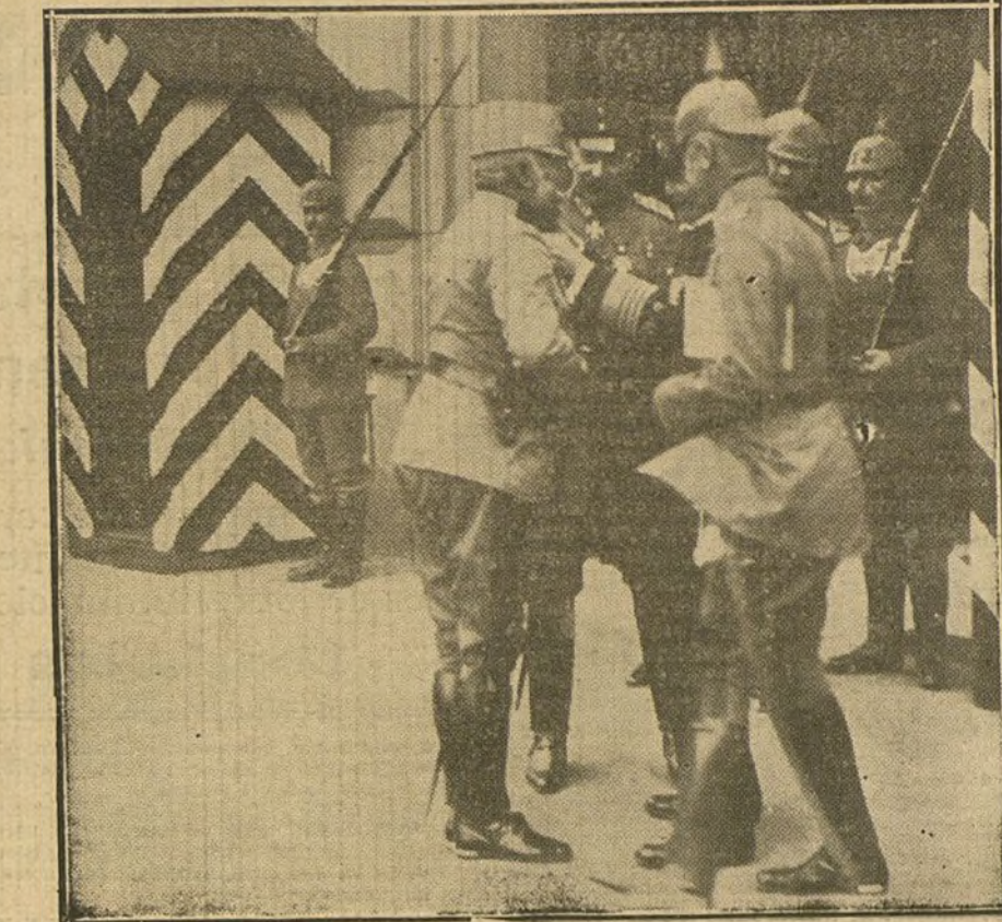
El Emperador de Alemania imponiendo la Orden «Por el mérito» al Archiduque Federico de Austria.

Quiero suponer que tiene razón el señor Dato y que nos encontramos en una época de gran prosperidad, nunca vista. Si así fuera, lo natural sería que Cataluña y el Gobierno se preocupasen de consolidar y aumentar esta fortuna. El hombre sano, el hombre que tiene salud, lucha para conservarla y consolidarla; el hom-