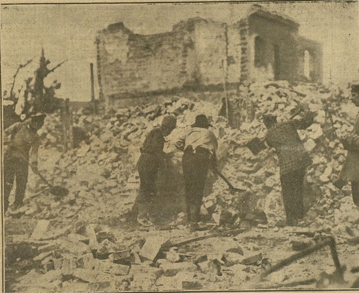
Soldados y paisanos rusos, prisioneros de los alemanes, desescombrando las ruinas de un caserío de la Polonia rusa.

En la Lorena francesa perdieron los franceses la tan disputada altura del Sur