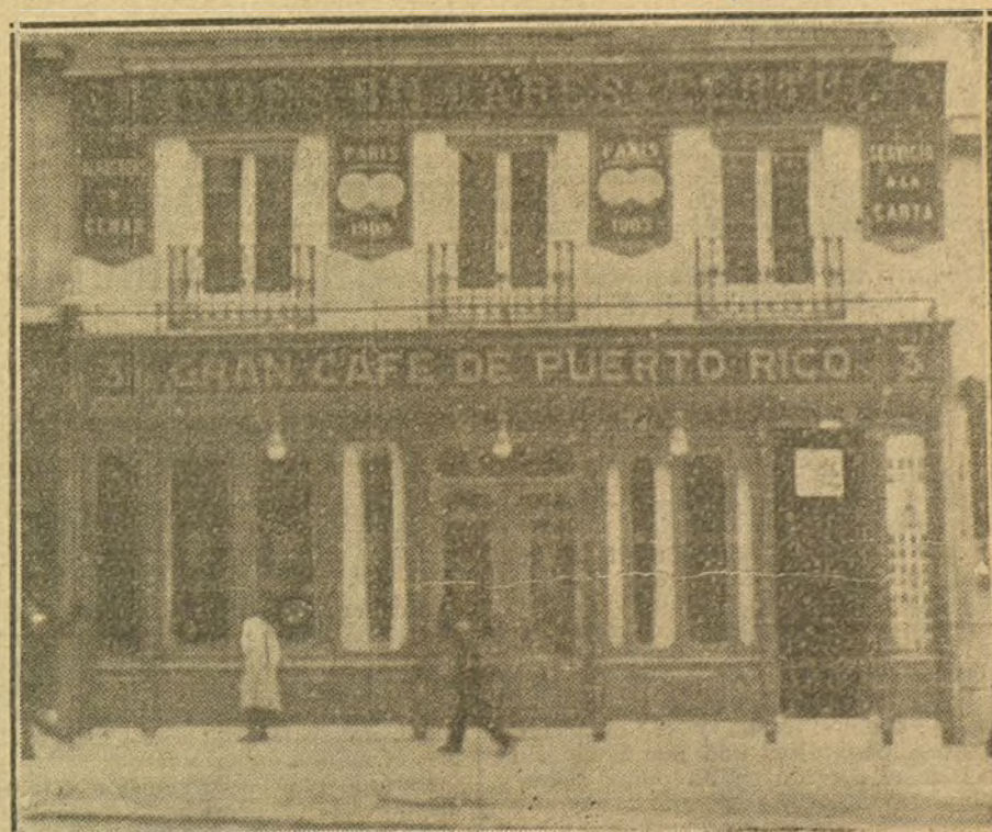
El gran café de Puerto Rico, que anoche abrió de nuevo sus puertas al público.