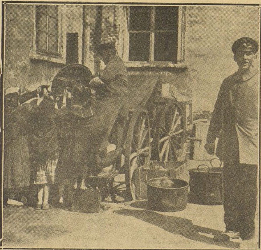
Niñas judías, de la Polonia rusa, recibiendo el rancho de los soldados alemanes.