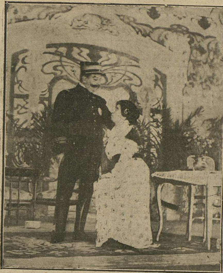
Una escena de «La llamarada», melodrama estrenado anoche en el teatro de la Princesa.

sión de juzgar más cumplidamente la labor de los artistas que ayer cantaron con entusiasmo, buen deseo y el beneplácito del público, pero con un poquito de pánico.