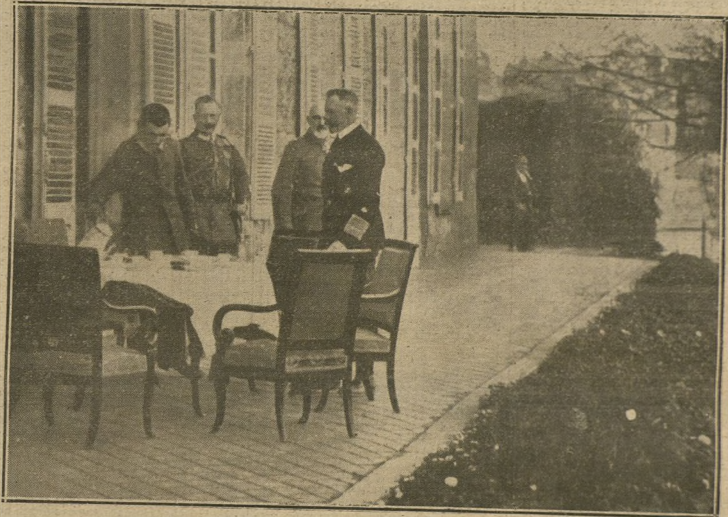
El Kaiser y su hermano el Principe Enrique de Prusia durante una visita al general von Haeringen.

Los rumores sobre victorias en el frente occidental no forman ningún contrapeso para los graves acontecimientos en los Balcanes. Los Dardanelos están muy lejos de nuestro alcance informativo y de nuestras esperanzas. No vemos por ninguna parte que se están tomando medidas para preparar al país para el esfuerzo que tendrá que hacer ahora. Es evidente, y nadie dirá lo contrario, que el número de reclutas no aumenta. El sistema fracasado no se reemplaza por otros; todo lo que