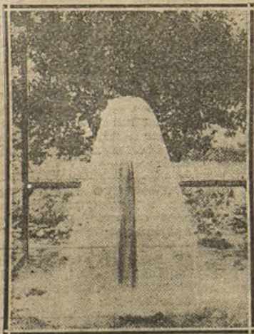
POZO ARTESIANO.—Rendimiento de este pozo: 3.000 litros por minuto.

De venta en Madrid: Farmacia de Gayoso, Arenal, 2; perfumería de Alvarez Gómez, Peligros, 1 duplicado; perfumería viuda de Gómez, Serrano, 7; Pablo Moreno, Mayor, 85; hijos de Carlos Ulzurran, Esparteros, 9; Sucesores de Traviña, Postas, 28, y en las droguerías, perfumerías y farmacias más importantes. Al por mayor: Pérez y Martín, y Martín y Durán, Madrid, y Perfumería Inglesa, Carrera San Jerónimo. AGENTE GENERAL PARA ESPAÑA: Casa Francisco Loyarte SAN IGNACIO DE LOYOLA, 9, SAN SEBASTIAN.