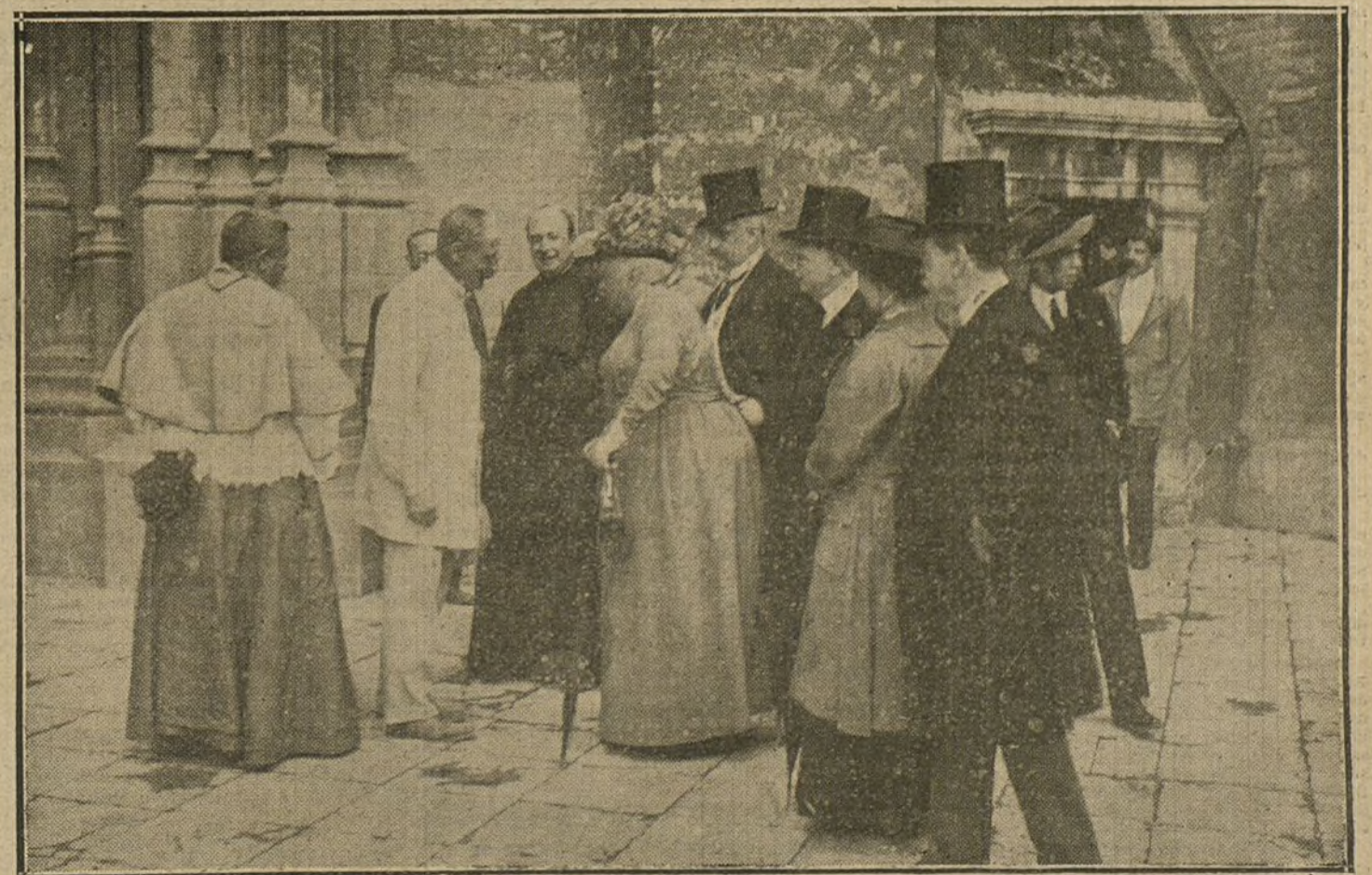
LA INFANTA ISABEL EN SEVILLA.—S. A. conversando en el patio de la Giralda con el escultor que actualmente está reconstruyendo la catedral.