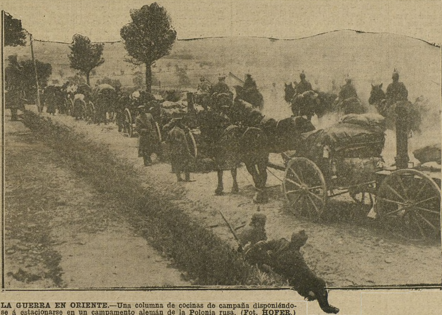
LA GUERRA EN ORIENTE.—Una columna de cocinas de campaña disponiéndose a estacionarse en un campamento alemán de la Polonia rusa.

«De la caída del Sr. Venizelos se desprende que Grecia ha decidido no hacer nada, y, por consiguiente, la situación es de un carácter sumamente grave. Los serbios son valerosos, pero no se puede esperar que resistan a ataques de dos frentes. No exageramos afirmando que es posible que la suerte de toda esta guerra dependa de lo que nuestro Gobierno decida hacer ahora en este asunto. Si decide obrar, hay que hacerlo en el acto y con energía. Hemos consentido que Alemania se adelante a nosotros con demasiada frecuencia. Le hemos dado tiempo para destrozar Bélgica y para ocupar el Norte de Francia. Hemos consentido que se aprovisione y luego que