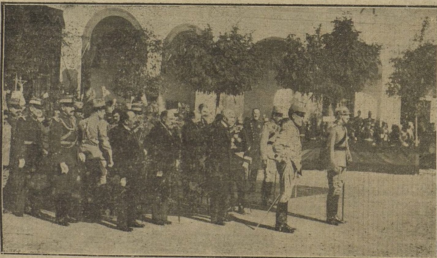
EL REY EN VALLADOLID.—S. M. presenciando la jura de la bandera por los nuevos cadetes en la Academia de Caballería.

La tarea de devolver todos los trabajos que no publicamos sería abrumadora, y para evitarla, como para prevenir reclamaciones, que resultaría imposible atender, recordamos que no se devuelven los originales.