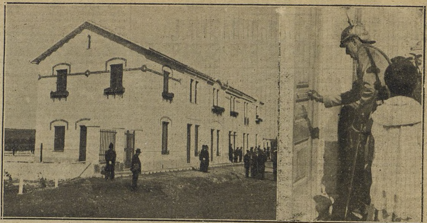
EL REY EN VALLADOLID.—S. M. durante el acto de inauguración de la «Ciudad Jardín Alfonso XIII», abriendo la primera casa construida y que ha sido regalada á una familia obrera.—Al lado, primer grupo de casas de la «Ciudad Jardín».