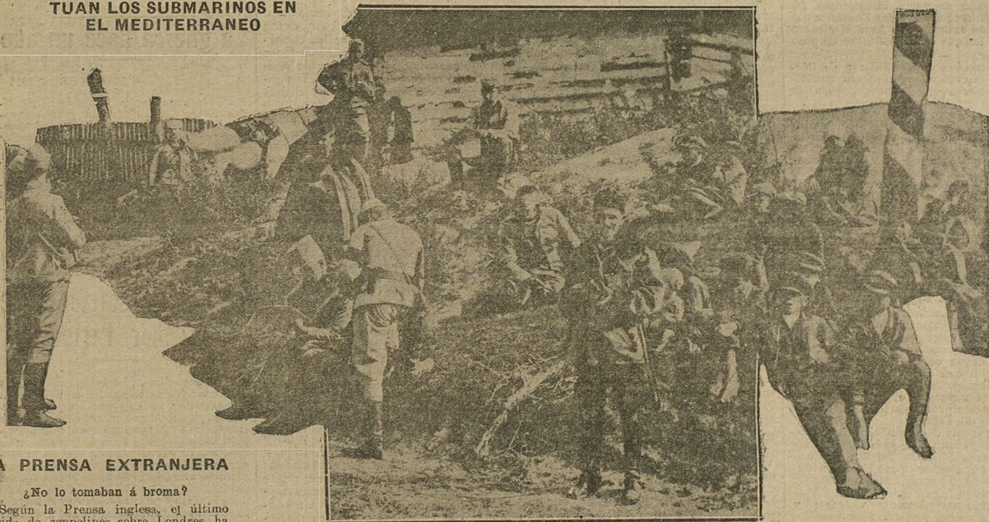
Tropas austriacas durante un descanso en una aldea polaca.

LA OFENSIVA DE LA CHAMPAGNE.—QUE ELEMENTOS INTERVINIERON EN ELLA.—EL ESPERADO AUXILIO DEL JAPON.—COMO ACTUAN LOS SUBMARINOS EN EL MEDITERRANEO