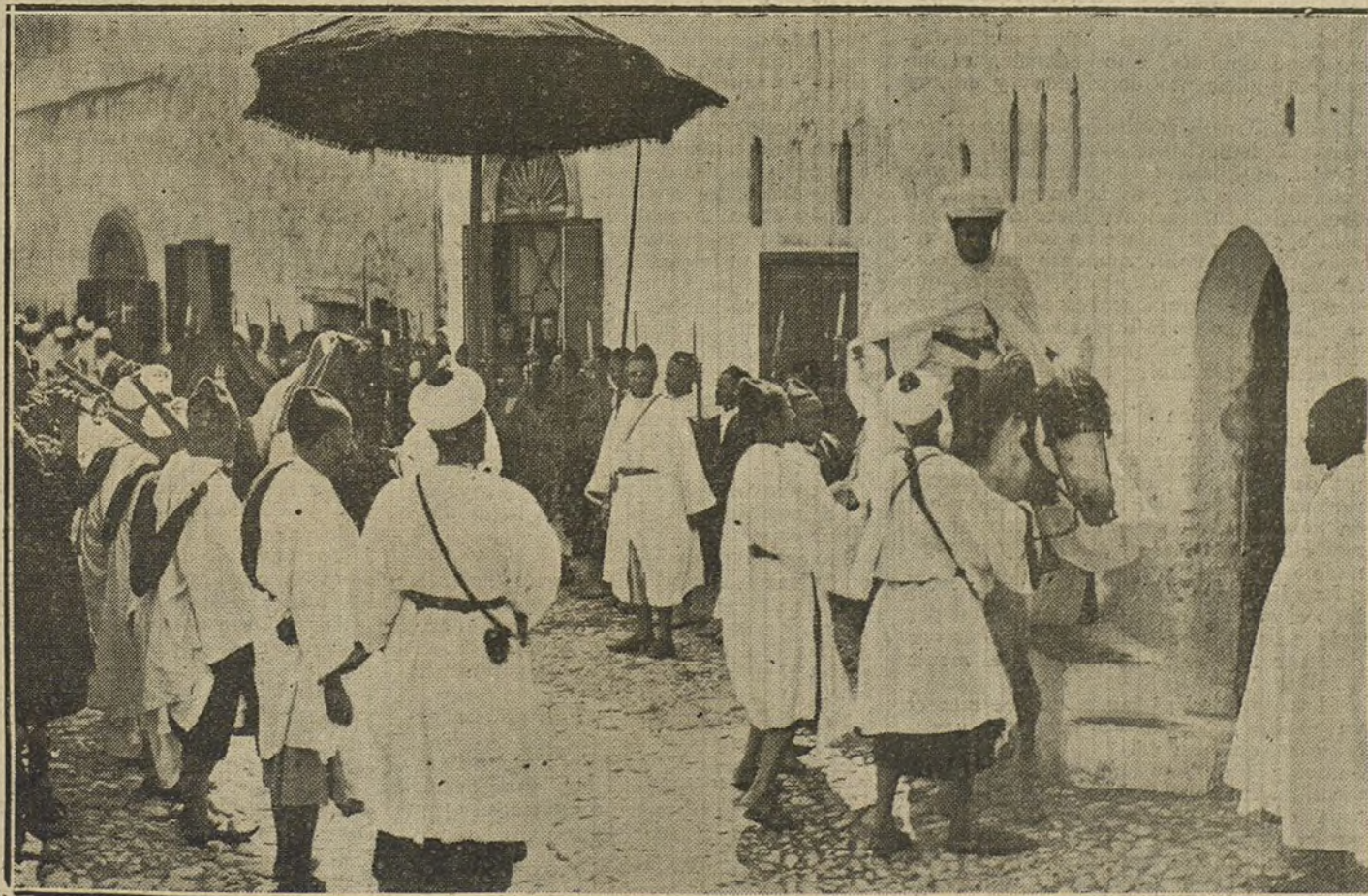
COSTUMBRES MUSULMANAS.—S. A. I. el Jaliía Mulay-el-Mehdi, representante del sultán en Tetuán, al llegar á la mezquita, donde acude todos los viernes para rezar sus oraciones.