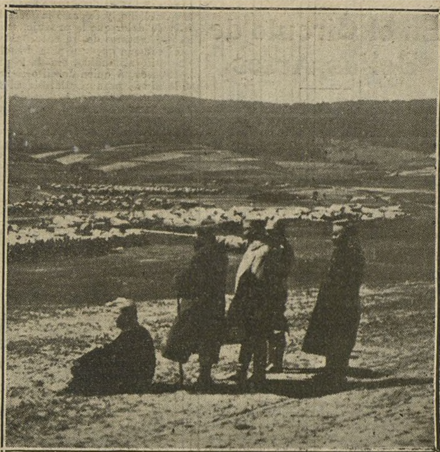
LA LUCHA EN GALITZIA.—Jefes del ejército austrohúngaro presenciando desde una altura un combate en la frontera rusa.