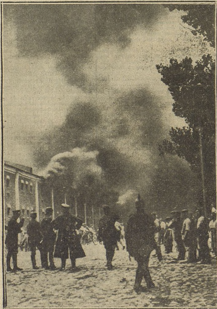
LA LUCHA EN ORIENTE.—Tropas alemanas trabajando en la extinción del fuego de la ciudadela de Brest, incendiada por los rusos al retirarse.