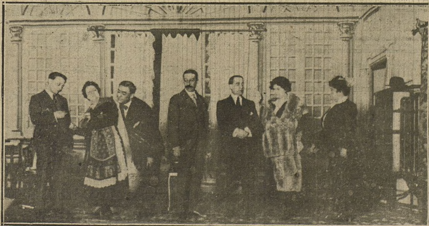
Una escena de «El fiaco de Quintanilla», juguete cómico estrenado ayer en el teatro de la Zarzuela.

Mañana termina la temporada de conciertos que en el boulevard de la Banda Municipal.