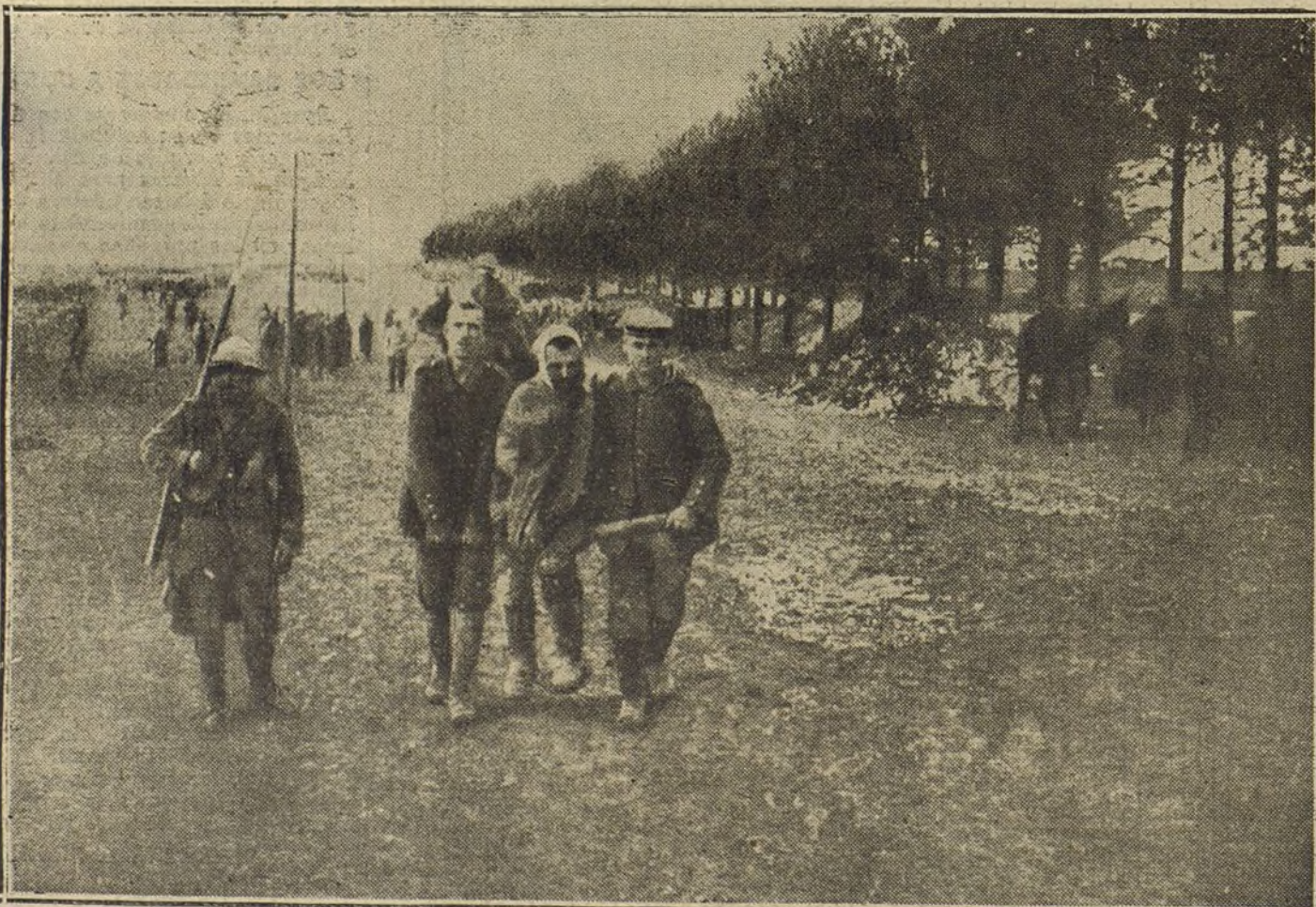
DESPUES DEL COMBATE.—Soldados alemanes prisioneros de los franceses trasladando á un herido grave.

LA TAREA DE DEVOLVER TODOS LOS TRABAJOS QUE NO PUBLICAMOS SERIA ABRUMADORA, Y PARA EVITARLA, COMO PARA PREVENIR RECLAMACIONES, QUE RESULTARIA IMPOSIBLE ATENDER, RECORDAMOS QUE NO SE DEVUELVEN LOS ORIGINALES.