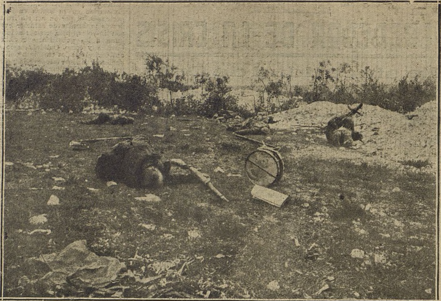
DESPUES DEL COMBATE.—Aspecto del campo de batalla de la Champagne después de un encarnizado encuentro.

Momentos antes de las doce fueron exhumados de la sepultura los restos de D. Nicolás Salmerón, encerrados en lujosa caja, y precedidos de varios estandartes y banderas de distintos partidos