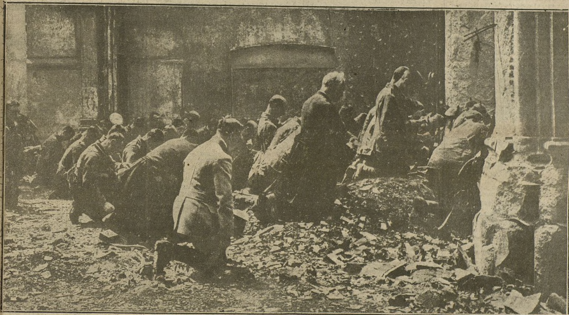
Soldados ingleses oyendo misa en una iglesia derrumbada.

LOS OFRECIMIENTOS DE LA ENTENTE Y LA CONTESTACION DEL GABINETE GRIEGO.—LA ACTITUD DE RUMANIA.—INTERVENCION DE RUSIA EN EL CONFLICTO BALKANICO.—EN EL FRENTE ORIENTAL.—LA ACCION NAVAL DE ALEMANIA.—SERVICIO RADIOTELEGRAFICO.—DOCUMENTOS OFICIALES.—OTRAS NOTICIAS