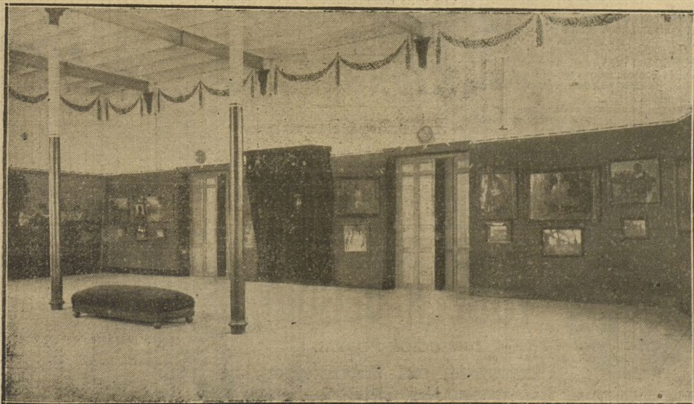
LA EXPOSICION DE MELILLA.—Uno de los espaciosos salones dedicados a Exposición de Bellas Artes.

Por su parte, el Comité ejecutivo está realizando trabajos para conseguir importantes rebajas de transportes y pasajes de la Compañía de correos de África y de las de ferrocarriles a los puertos de Almería y Málaga.