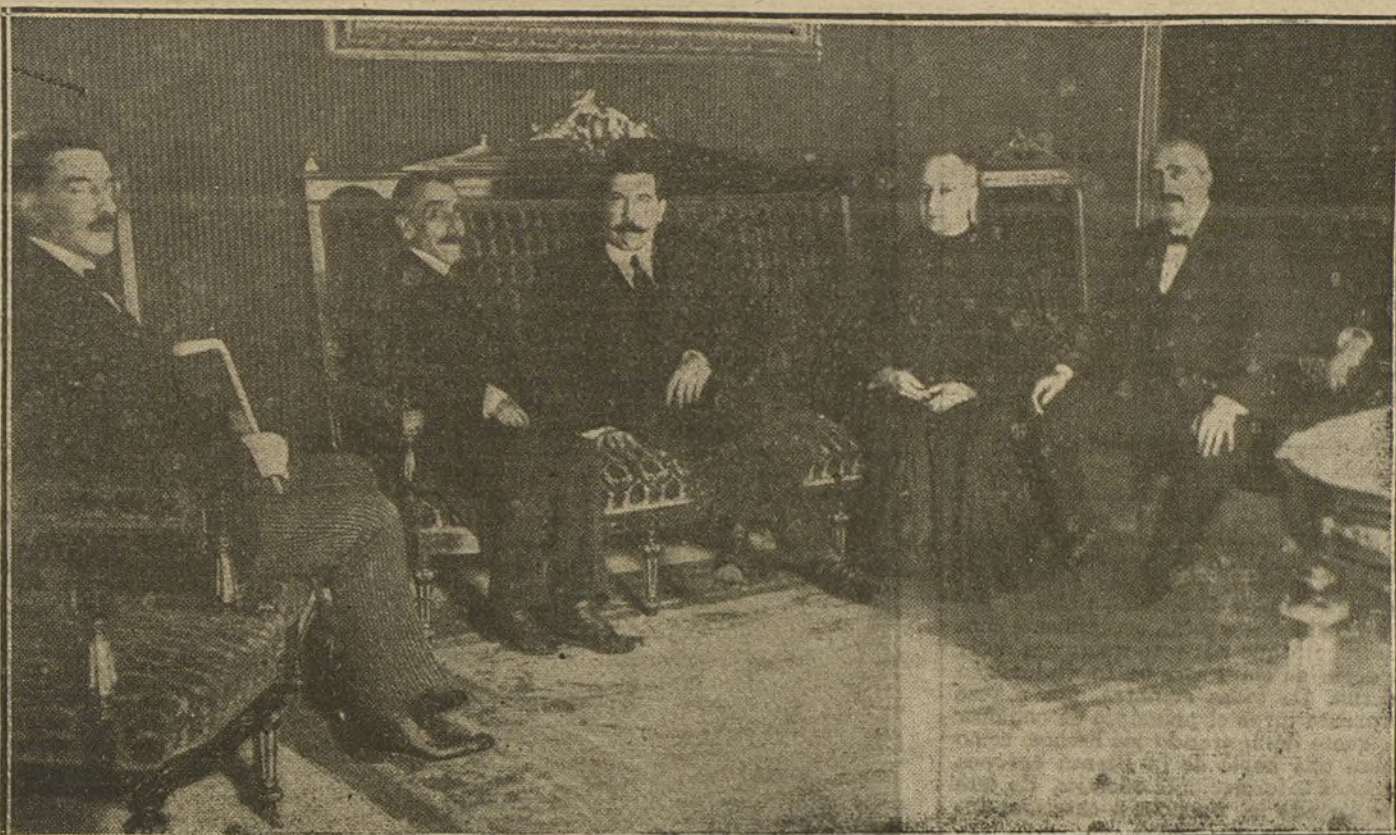
El nuevo gobernador de Barcelona en su despacho conversando con varios amigos poco después de su llegada a la ciudad condal.

La que ha llevado a cabo en «The Tango» ha de llamar seguramente la atención del público y valerle nuevos y numerosos encargos. Tal es nuestro deseo, así como también que los Sres. Casado y Ruiz obtengan gran éxito en su nuevo establecimiento.