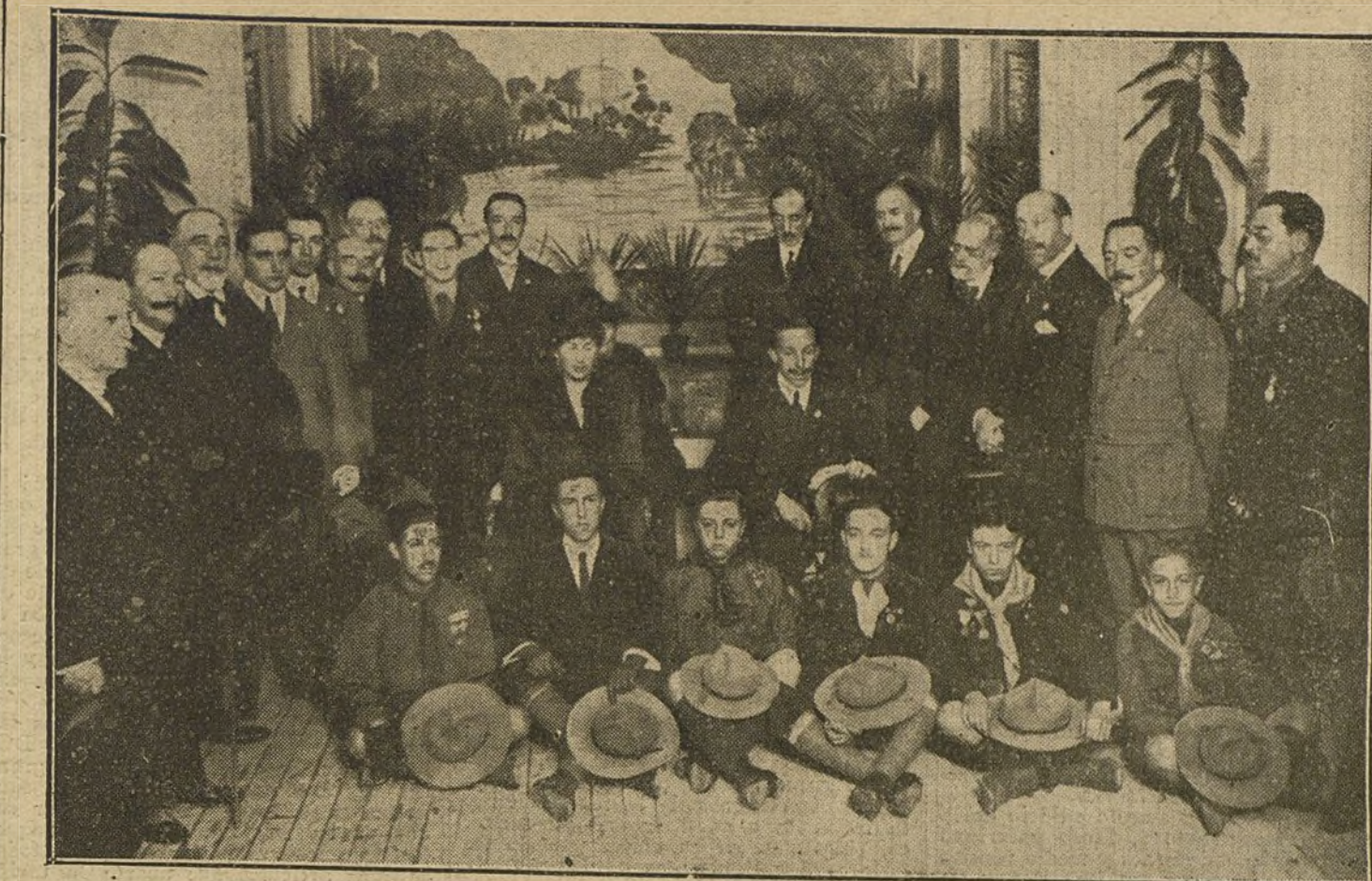
INAUGURACION DEL CLUB DE LOS EXPLORADORES.—SS. MM. y las autoridades y personalidades invitadas al acto, durante la fiesta.

Es indispensable divulgar el conocimiento de lo que son los intereses marítimos, los capitales que representan, los beneficios que proporcionan y a quienes