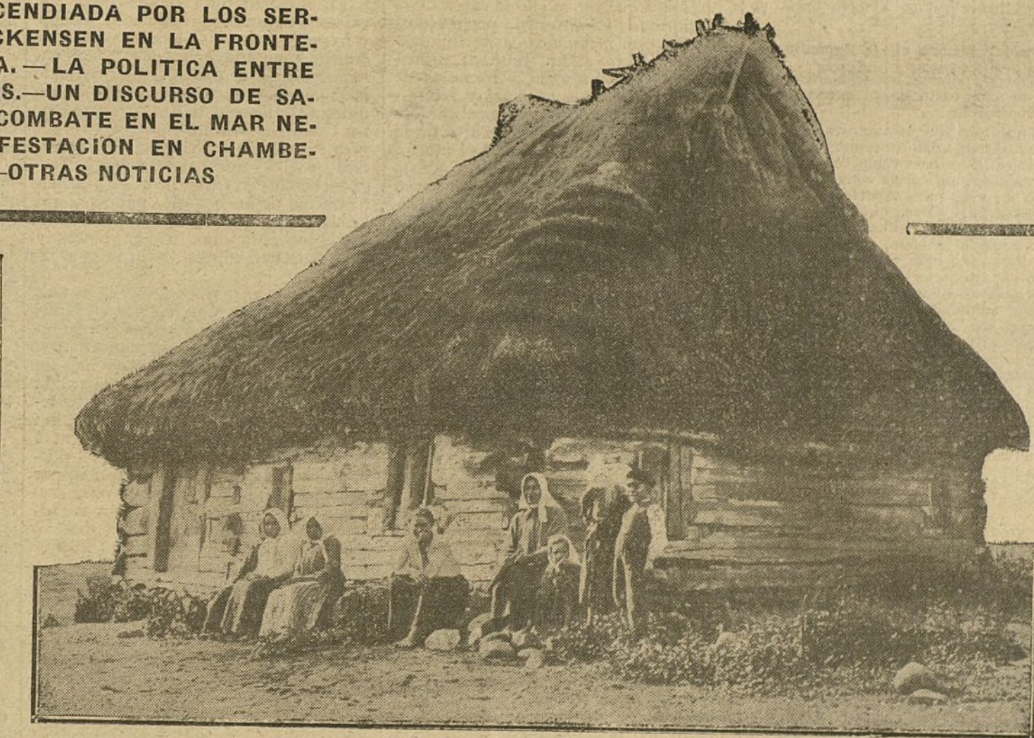
LA GUERRA EN ORIENTE.—Una casa típica de campesinos polacos en las cercanías de la línea de fuego.

La censura no impide que las noticias lleguen a conocimiento del enemigo; pero la forma en que aquélla se emplea impide que nuestra propia nación sepa la verdad siempre que las noticias no son buenas. Nuestra gente no es cobarde, y si se tratase de haber sufrido un revés, sabría soportarlo, tomando la decisión de «mirar la guerra hasta su fin». En varias ocasiones se nos ha informado que nuestras armas han obtenido brillantes victorias,