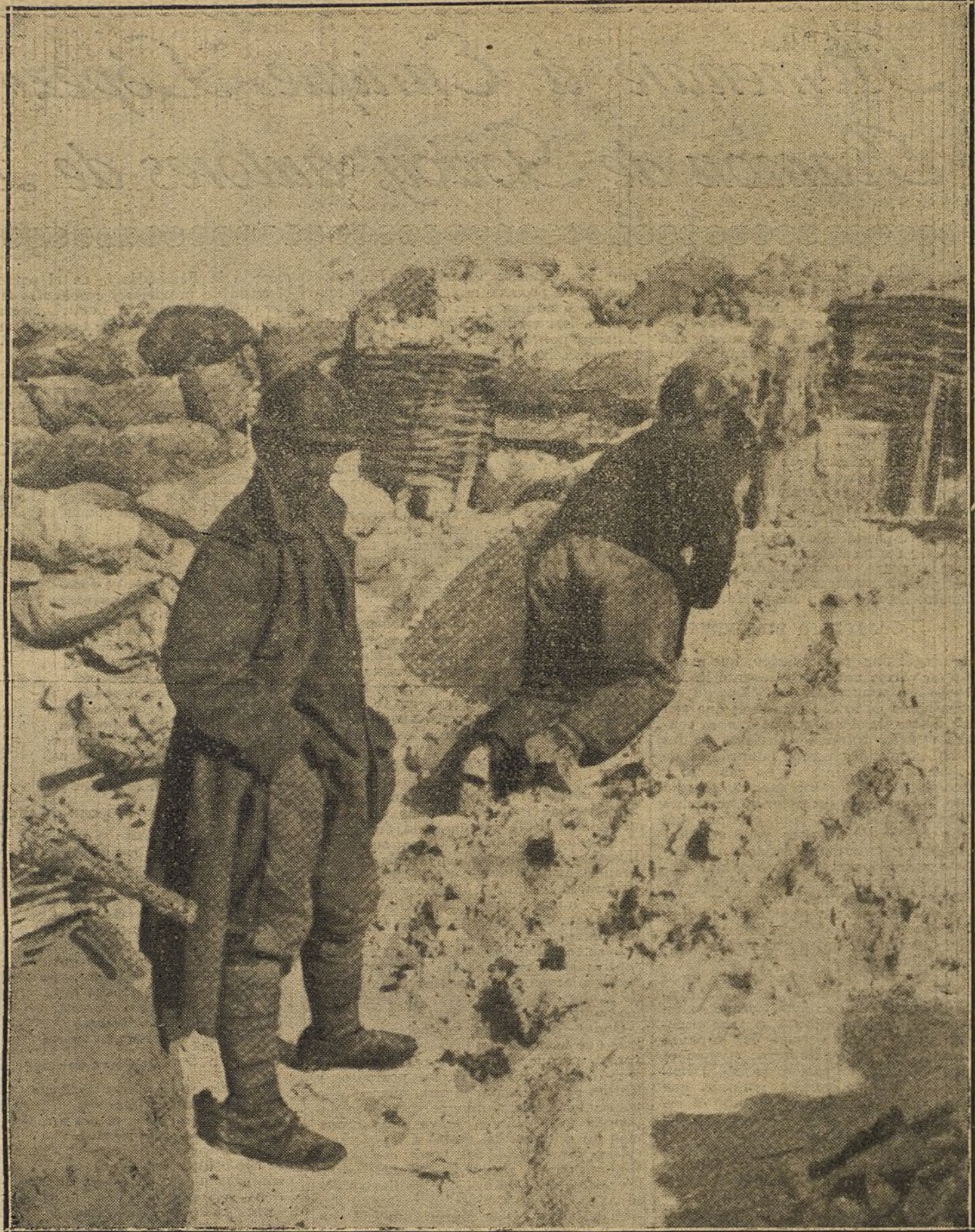
LA LUCHA EN LAS TRINCHERAS.—Soldados franceses con los nuevos cascos contra los shrapnels, en una trinchera avanzada.

Cada hombre lleva consigo su máscara para librarse de los gases asfixiantes, y a veces una cogulla para preservar el rostro de los líquidos inflamables que suele