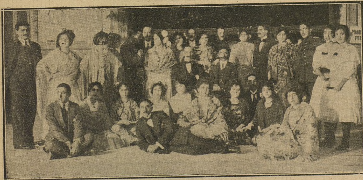
FIESTA BENEFICA EN ALGECIRAS.—Grupo de distinguidos jóvenes que han dado una representación teatral para recaudar fondos con destino á la fundación de Casas de Socorro.