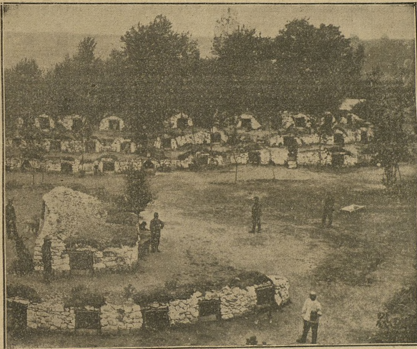
Instalación de perros sanitarios en un campamento inglés del Norte de Francia.

La historia de Rusia de los últimos cincuenta años está llena de una serie de