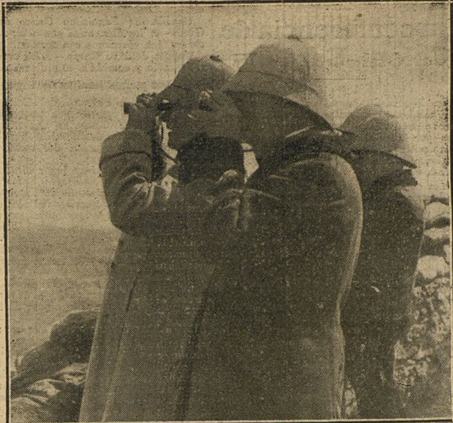
VISITA DEL COMISARIO GENERAL A CUDIA FEDERICO.—Los generales Miláns del Bosch y Sánchez Monjón explicando al general Jordana los principales hechos de armas ocurridos en aquella zona.

Es necesario que sepa el país que para la zona francesa se anuncia el 14 de Octubre para el 4 del corriente su-