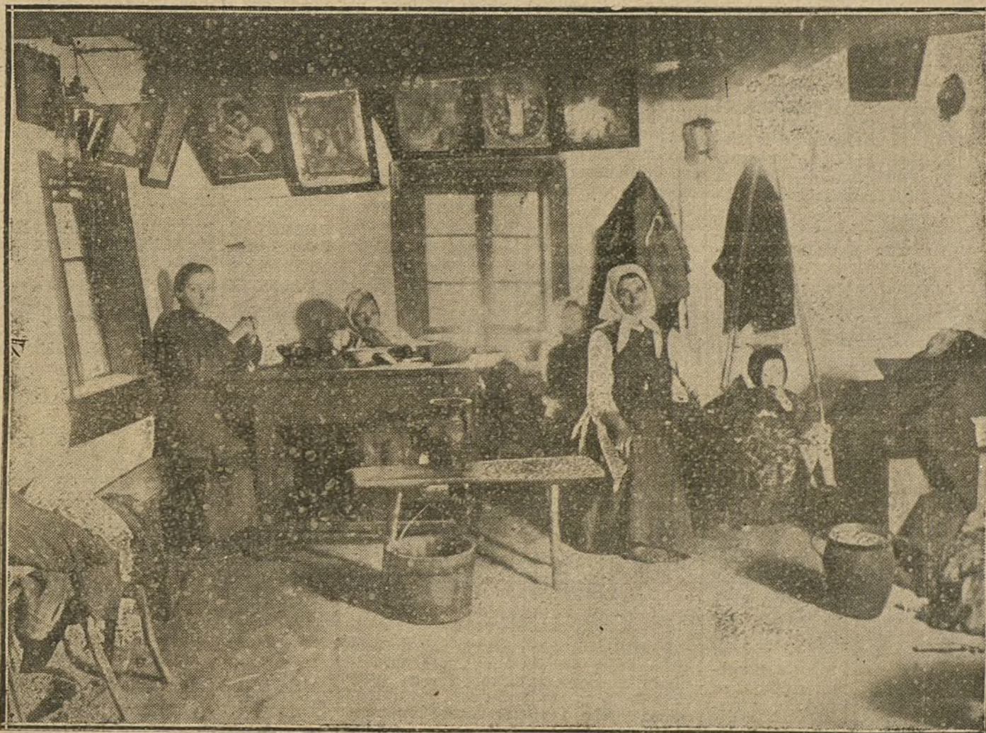
LA GUERRA EN ORIENTE.—Interior de una casa de la Polonia rusa, poco después de ocupada la localidad por los alemanes.

el día 6 de Noviembre. Del lado de Rabrovo, las tropas francesas consolidan las posiciones conquistadas.