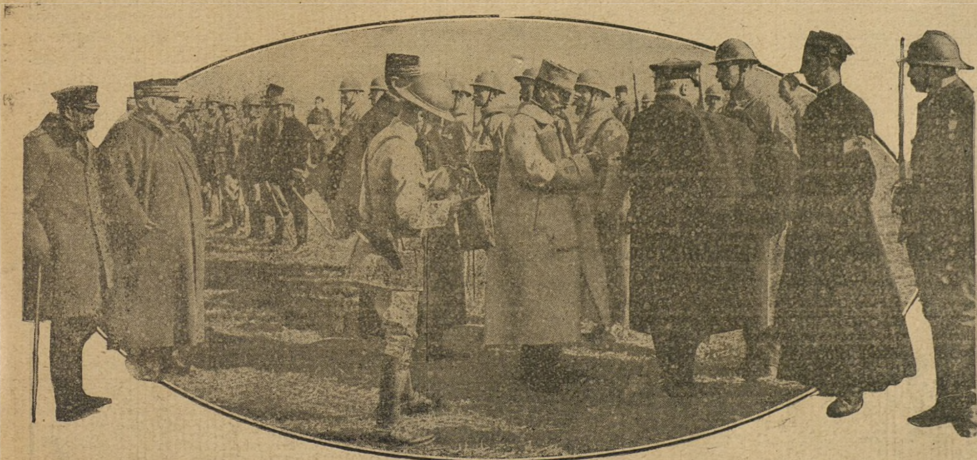
El Rey de Inglaterra y M. Poincaré inspeccionando el frente francés, durante cuya visita sufrió Jorge V un grave accidente.

Nuestros aviones bombardearon ayer las estaciones de Sandanielle y de Nabresina, así como otros objetivos militares en la meseta del Carso.