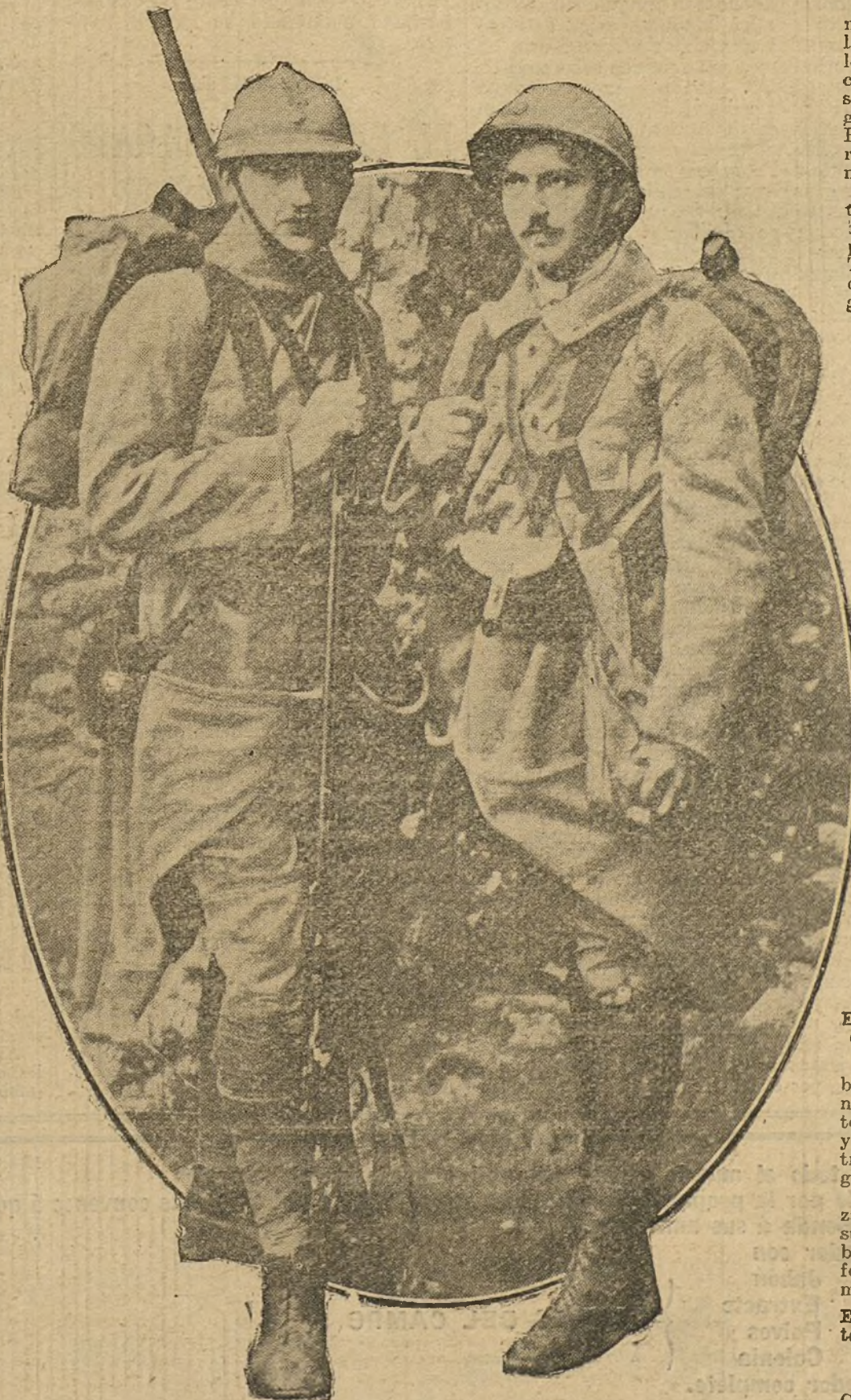
LA VIDA EN CAMPANA.—Soldados franceses con el nuevo equipo para su permanencia en las trincheras.

Alemania acaba de cubrir su tercer empréstito, que era de 12.000 millones, y nosotros, el país clásico de la «media de lana», de la gente que ahorra; nosotros, que en tiempos de paz encontrábamos miles de millones para prestar todos los años a todas las naciones extranjeras, ¿es que sería demasiado atrevido pedirnos de un solo golpe un gran número de miles de millones para la patria?