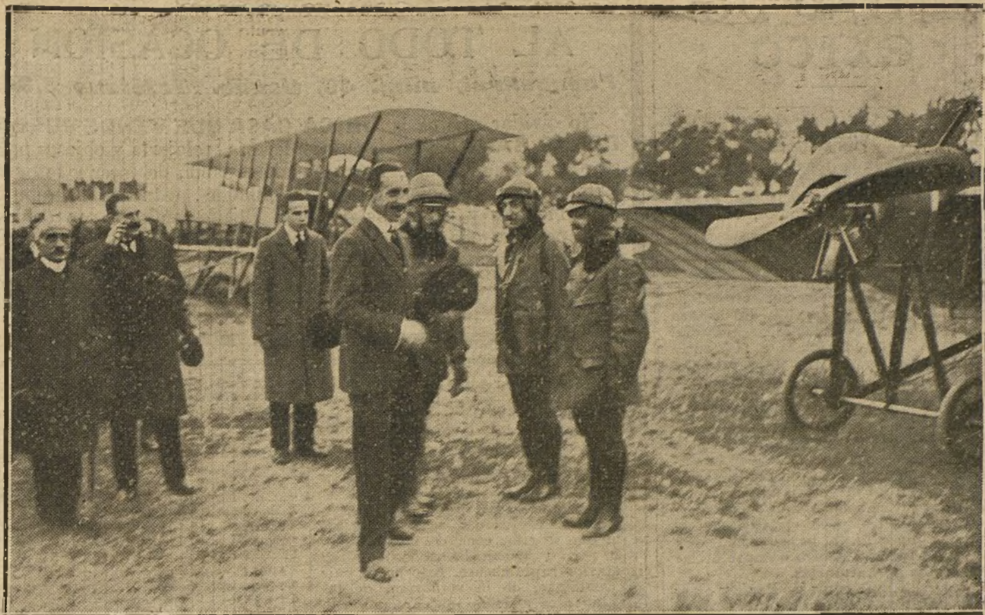
El Rey en la Escuela de aviación de Getafe, conversando con los aviadores que realizaron ante SS. MM. interesantes vuelos.

«Peer Gynt» (segunda suite). a. El momento de Ingrid. b. Danza árabe. c. Peer Gynt vuelve á su Patria. Tempestad. Canción de Solveig. Grieg: Polaca de concierto, Chapi; Marcha militar, Schubert; «Cádiz» (selección del acto segundo), Chueca y Valverde.