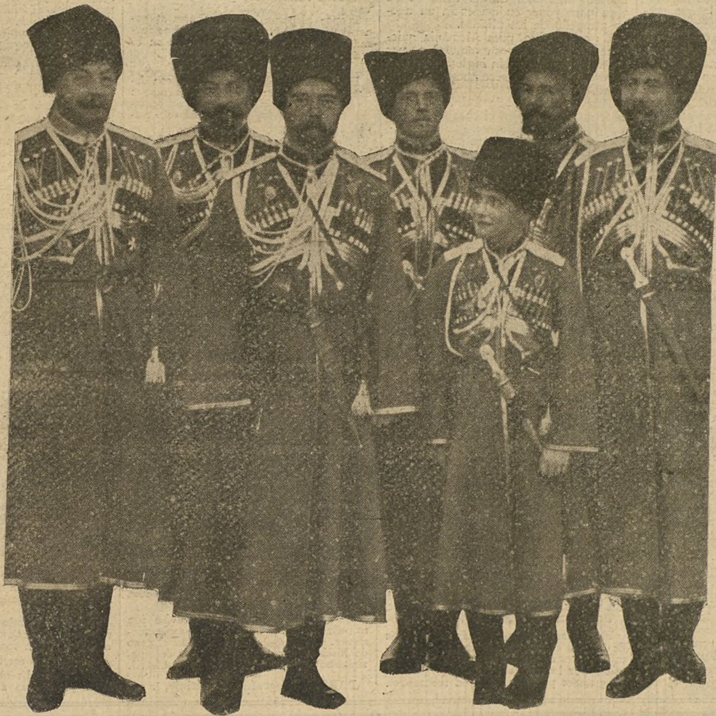
El Zar de Rusia y su hijo vestidos de cosaco durante la revista de sus tropas en el campo de batalla.

La misión de la cual se ha encargado lord Kitchener le ocupará probablemente durante un tiempo considerable, y, por consiguiente, es muy urgente resolver la cuestión de una dirección eficaz de la guerra en estas nuevas circunstancias. Mr. Asquith, como ministro civil encar- gado de un departamento militar, nece- sita forzosamente de un Estado Mayor general, cuyo jefe debe ser un personaje muy capaz.