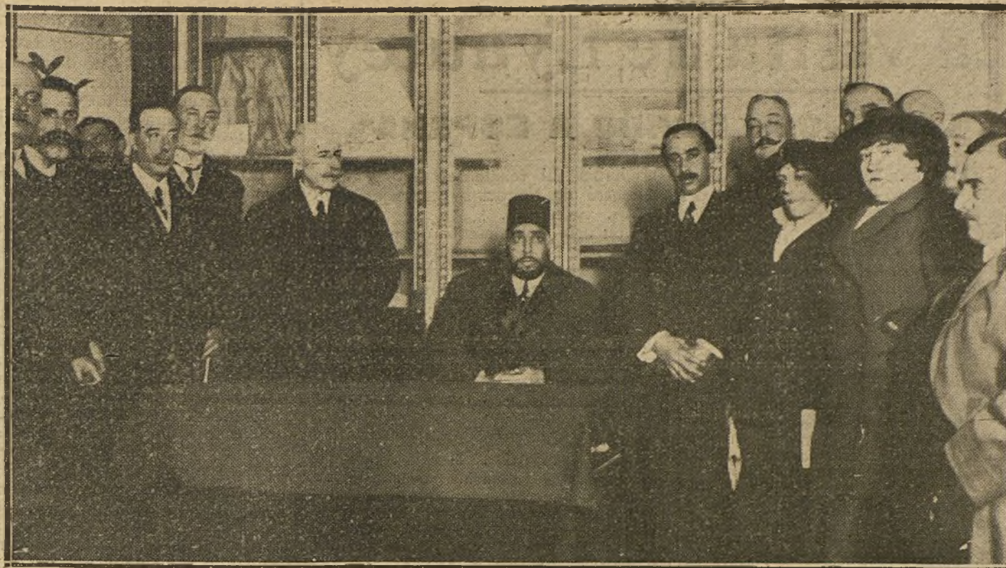
Muley Hafid durante la visita que hizo ayer tarde al Centro Hispano Marroquí.

piensa hacer, sino que ya está haciendo discos de cobre para enviarlos a Francia. ¿Por qué, Sr. Dato? ¿Con qué objeto y para qué fin? ¿Cuáles son las garantías de su uso? ¿Cuáles las causas de ese convenio tan extraño?