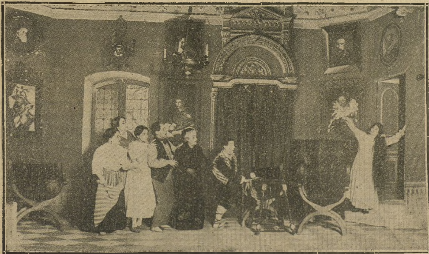
Una escena de la zarzuela de Arniches «La casa de Quirós», estrenada anoche en el Cómico con feliz éxito.