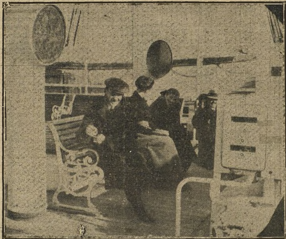
Los pasajeros del «Tubantia» embromando a un joven sobre el que recayeron durante la travesía sospechas de espía.

contesté sin mostrar interés por el conflicto, y él hizo lo mismo. Me preguntó si me eran simpáticos los alemanes, y yo le dije que todo el mundo me inspiraba respeto. Al ver que escribía una postal, me preguntó a quién la dirigía, y me rogó le dejase ver el dibujo; al dejarla otra vez sobre la mesa la volvió, como para mirar la dirección. ¿No es verdad que cualquiera habría sospechado que se trataba de un espía? Pues la aventura tuvo un final cómico, porque a los dos días me convencí de que el pasajero sospechoso tenía más miedo que yo de los espías.