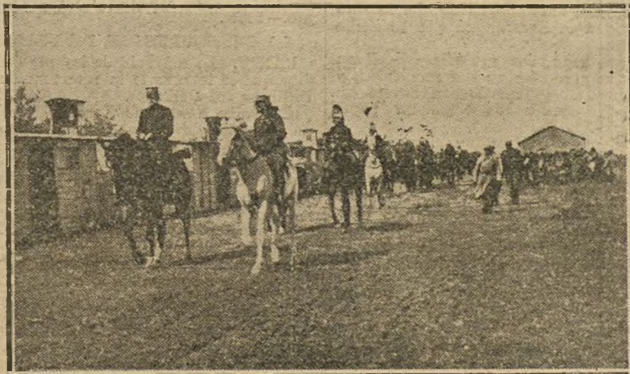
El general francés Serrail, jefe de las tropas expedicionarias, á su llegada á los campamentos de Salónica.

El Cuartel general inglés dice en su parte del 15 de Octubre, con referencia á nuestro ataque al Sudoeste de Loos, el día