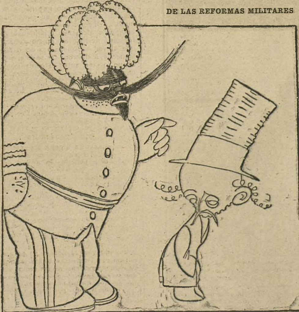
EL MILITAR.—¿Y a ustedes quién les reforma...?