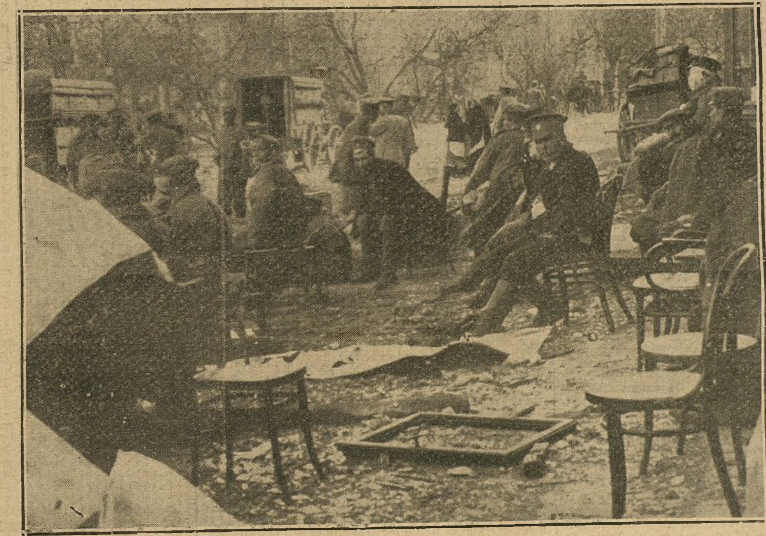
Tropas rusas prisioneras de los alemanes en los combates de la región de Finaburg, en un lazareto provisional.

tas aliadas sabrán, por lo menos, lo que tienen que hacer en este caso.»