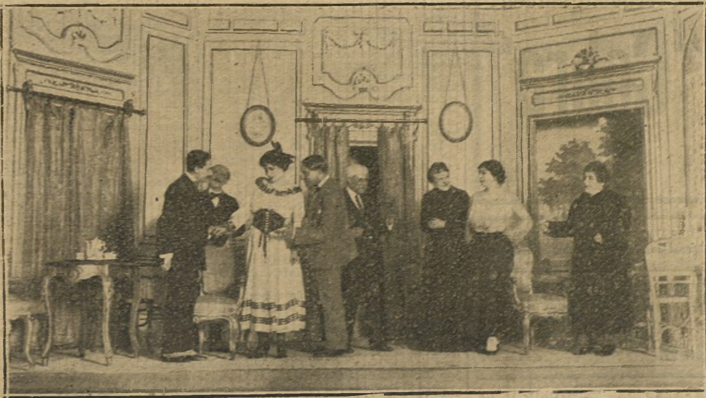
una escena de «La gloria de los Pirzanes», comedia estrenada anoche en el teatro Infancia Irabel.

El producto se destina a erigir un monumento que perpetúe la memoria del malogrado maestro.