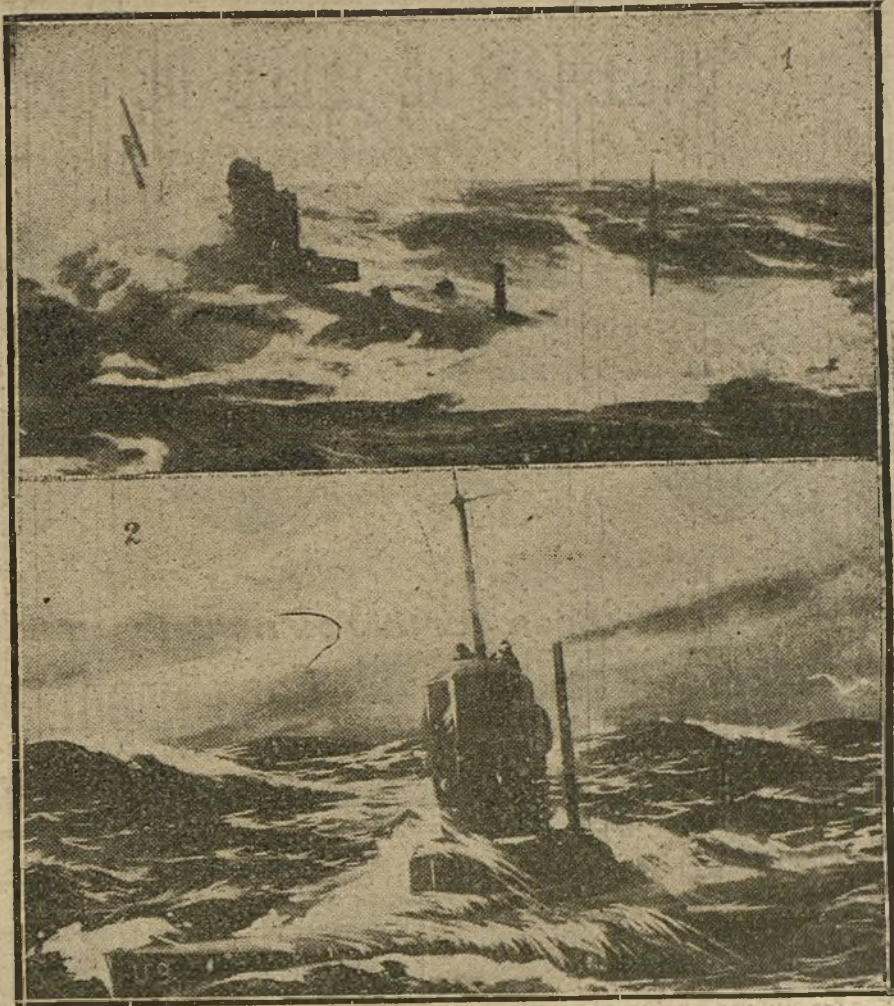
LOS SUBMARINOS ALEMANES.—Dos tipos de sumergibles.

—Lo que ya no se puede recuperar: la juventud.