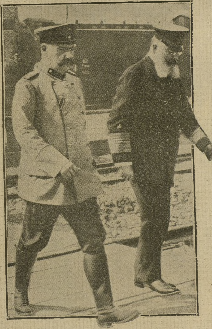
DOS FIGURAS INTERESANTES DEL MANDO ALEMAN.—El almirante von Tirpitz y el mariscal Hindenburg.

«El Popular del Centro» añadió «Le Temps» ha dirigido acres censuras á la Comisión administrativa permanente del partido socialista por haberse atrevido á desautorizar á los dos miembros que en Emsenwaki conferenciaron con socialis-