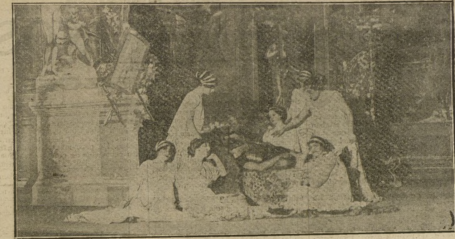
Escena primera del cuarto acto de «Aníbal», tragedia estrenada anoche con éxito en el Español.

Ebora, una saguntina apresada por el cartaginés, teje los hilos misteriosos del destino de Aníbal en la obra de Oliver. He aquí un carácter complicado, cuyo análisis desconcertaría al psicólogo más sagaz. Ebora, libre, defendiendo a su ciudad contra el enemigo, a quien odia furiosa-