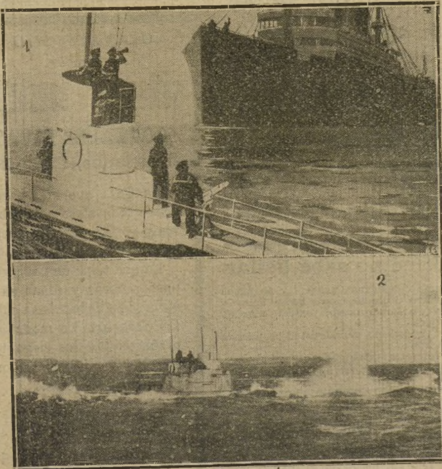
LOS SUBMARINOS ALEMANES.—Hablando con el capitán de un buque mercante detenido.—Submarino navegando.

Art. 2.º Se autoriza al ministro de la Guerra para elevar temporalmente dicha cifra, si lo considera necesario, dando en otros meses las licencias temporales precisas para que los gastos no excedan en ningún caso de los créditos consignados en el presupuesto.»