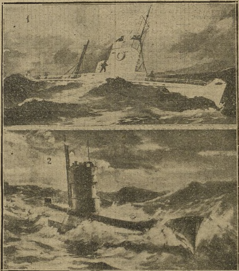
LOS SUBMARINOS AUSTROHUNGAROS.—Dos tipos de sumergibles.

El submarino que me señalaba el capitán estaba arrimado al muro de la dársena y apenas sobresalía del agua. Recordaba por su forma y magnitud visible esos barquichuelos sutiles de re-