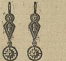
Núm. 200/44.—Pendientes ocho brillantes sobre platino. Ptas. 275.