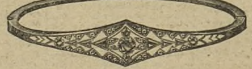
Núm. 203/82.—Pulsera oro de ley con platino, tres brillantes, diamantes y zafiros. Ptas. 475.