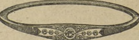
Núm. 203/81.—Pulsera oro de ley con platino, siete brillantes y diamantes. Ptas. 425.