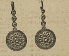
Núm. 200/59.—Pendientes 24 brillantes sobre platino y rubíes ó zafiros. Ptas. 350.