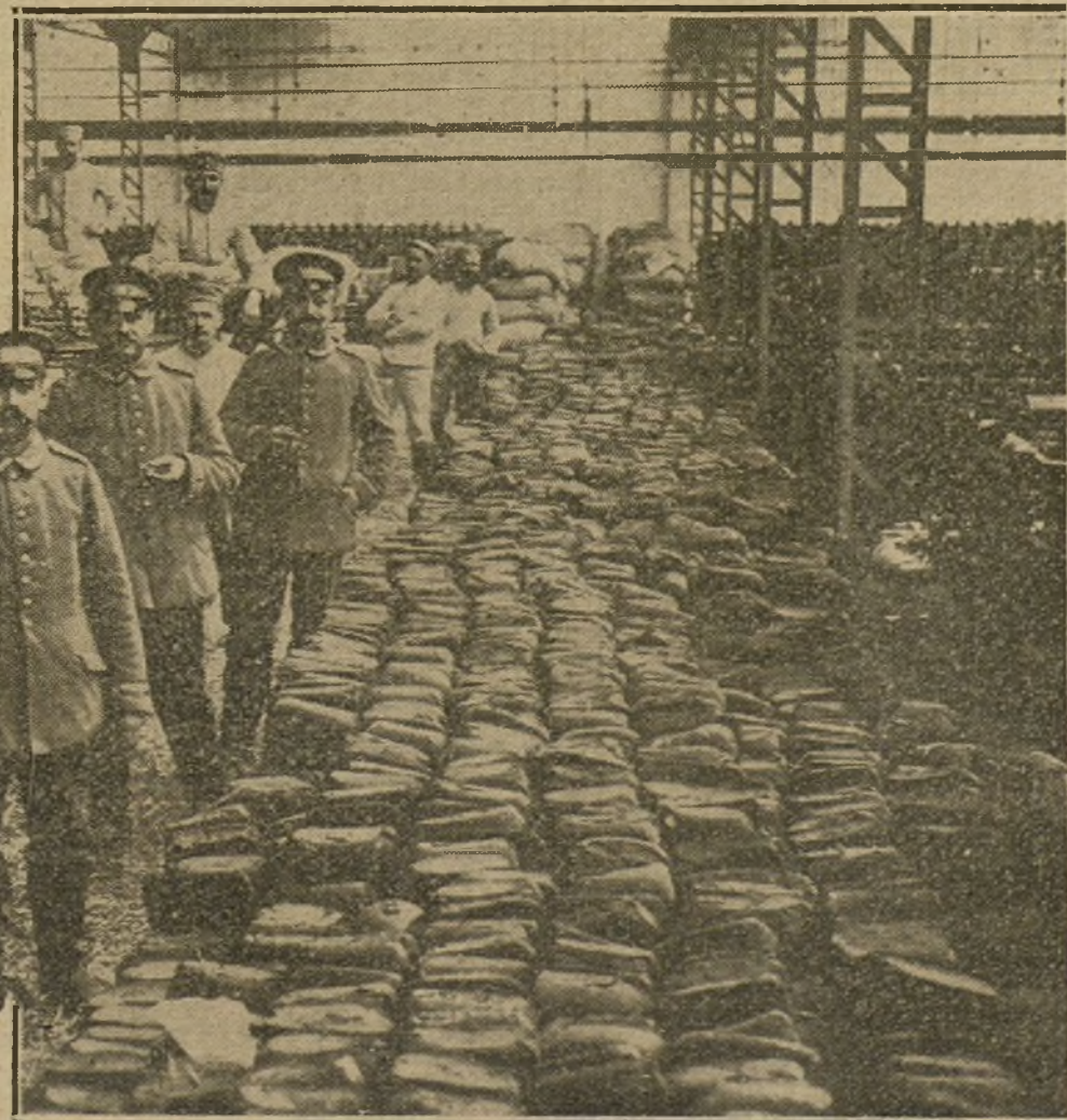
Una fábrica de tejidos de la Polonia rusa convertida en almacén de harina y pan para el ejército alemán que opera en aquella región.

Ha sido ocupado Rudnik, al Sudoeste de Mitrovitza. Más de 2.700 prisioneros cayeron en manos de las tropas aliadas.