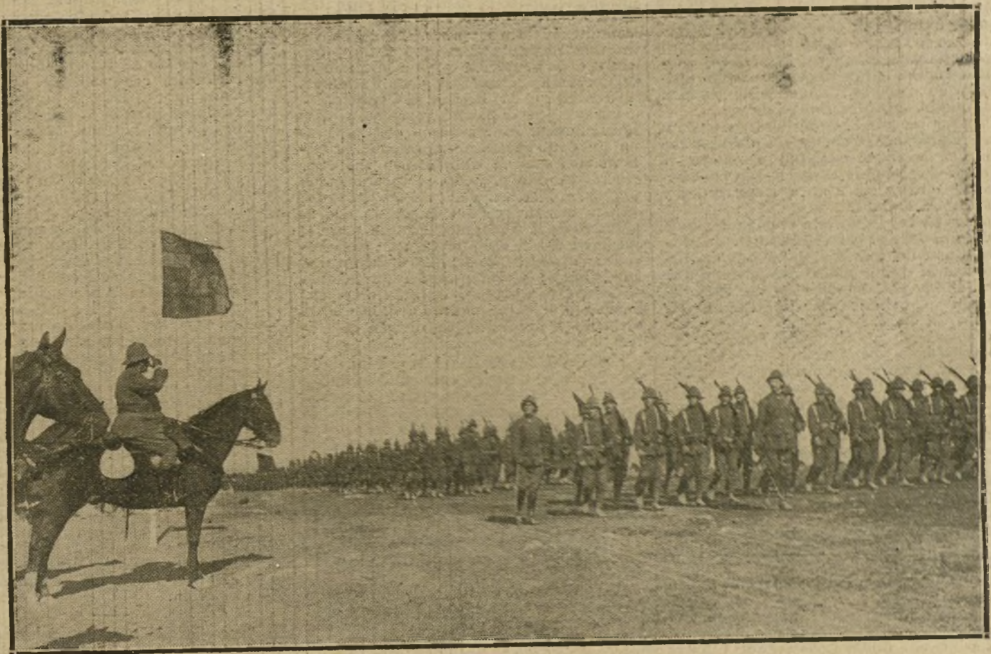
EL GENERAL JORDANA EN CEUTA.—Fuerzas de Infantería, de guarnición en la plaza española, desfilando ante el general en jefe del Ejército de Marruecos.

mos hijos renieguen de ella, llevándolos á recordar antes su remoto y discutible origen latino, común á otros muchos pueblos extraños á España, que el próximo, cierto y positivo español que tienen; ese espíritu provocó la rebelión de Flandes, de Aragón, de Portugal, de Nápoles, de Cataluña, contra sus legítimos Soberanos, convertidos en Reyes de Castilla por sus alianzas matrimoniales; en tiempos más modernos, la independencia de las colonias americanas de su metrópoli, y en los nuestros, la malevolencia y los odios que separan á miembros del cuerpo nacional, que aunque sólo fuera por el largo tiempo de convivencia en un mismo Estado político y de los comunes infortunios experimentados, debieran estar cordialmente unidos; ese espíritu ha falsado toda nuestra Historia, encubriendo bajo el disfraz de una España fantástica, que no existió nunca, una verdadera Castilla, pretendida señora de las naciones unidas con ella por la comunidad de Soberano; ese espíritu ha falsado también la Geografía, forzándola á sustituir con el nombre griego de Iberia el de España, que al usurparlo Castilla, ha hecho odioso á sus mismos naturales no castellanos; ese espíritu es el verdaderamente disolvente, el verdaderamente separatista de nuestra comunidad política. Es el espíritu de Bobadilla, de los Comuneros, del duque de Alba y del conde-duque de Olivares; es el mismo del sombrío y austero Feli-