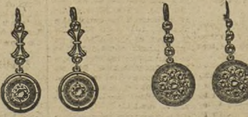
Núm. 200/52.—Pendientes seis brillantes sobre platino y rubíes ó zafiros. Ptas. 300.