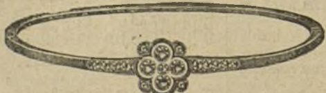
Núm. 203/80.—Pulsera oro de ley con platino, cinco brillantes y diamantes. Ptas. 375.