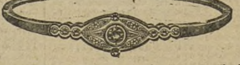
Núm. 203/83.—Pulsera oro de ley con platino, nueve brillantes, diamantes y rubíes. Ptas. 500.