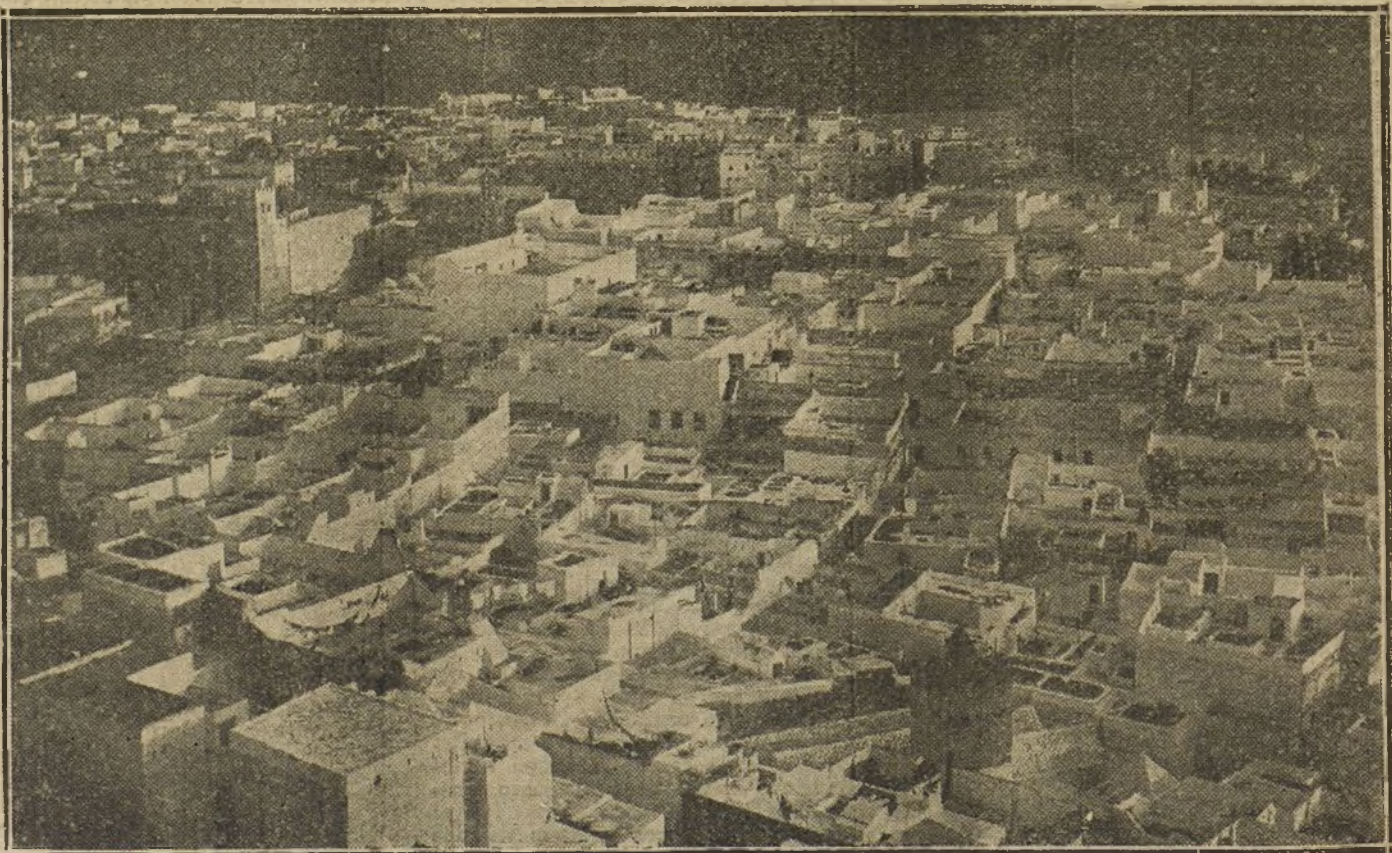
NUESTRA ACCION EN AFRICA.—Tetuán á vista de pájaro.

En la playa de Cullera ha aparecido un cadáver, que no ha sido identificado.