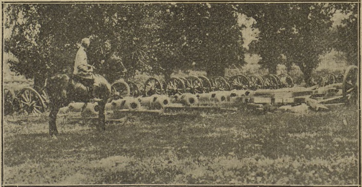
LA GUERRA EN ORIENTE.—Cañones cogidos por los alemanes a los rusos, en uno de los últimos combates.

Pudiera creerse que esa diversidad en los miembros constitutivos del Estado aragonés fuera efecto de causas naturales demasiado arraigadas para que no se considerase peligroso contrariarlas, si no demostrase la Historia que fué también resultado de una sabia política, análoga en un todo a la seguida espontáneamente en la organización de la Confederación Suiza, y premeditadamente en la de varios Estados modernos, como la Unión Americana, la Confederación Australiana, la de los Estados del Canadá y otros que pudieron haberse constituido sobre el principio unitario, y prefirieron por más práctico y conveniente el federativo.