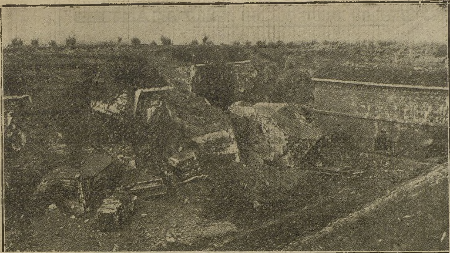
LA LUCHA EN ORIENTE.—Aspecto que ofrecen actualmente los fuertes de Kowno destruidos durante los pasados combates.

Jaime el Conquistador pudo haber agregado Mallorca y Valencia, bien al reino de Aragón, bien al condado de Barcelona, como lo hacían los Reyes castellanos con los territorios que por el mismo tiempo iban adquiriendo en Andalucía, al agregarlos a sus antiguos dominios; decidió empero, y no puede dudarse de que obró en obediencia a un plan preconcebido, inspirado en principios de organización y gobierno federalistas, formar reinos independientes de las provincias conquistadas. Ni siquiera les impuso el empleo de determinado idioma, y si prevaleció el catalán entre los pobladores de esas regiones, fue consecuencia natural de haber predominado en ellos por su número los catalanes sobre los aragoneses.