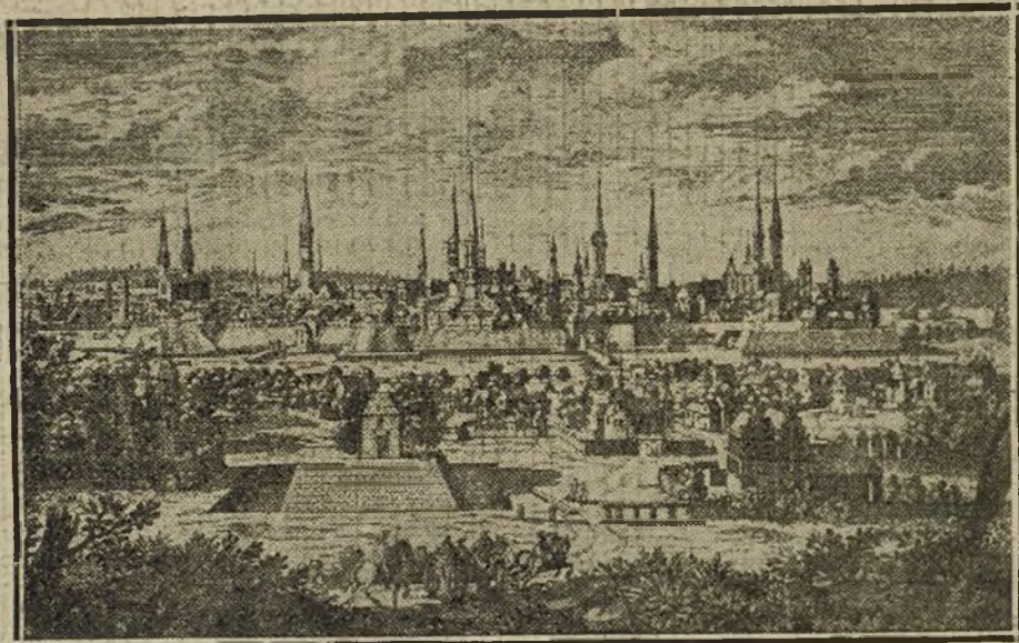
La vieja Lubeca. (De un grabado antiguo.)

Entré, y... ¡qué espectáculo, lector! Siento que mi nariz no sea tan fina como fué la de Zola, para ofrecerte una página descriptiva que recordase la voluptuosidad olfatoria que despertaba el novelista de «El vientre de París». De las carnes curadas, que yo contemplaba, se desprendía un vaho aromoso é incitante. Eran miles de jamones que, amontonados, semejaban un berrocal. No se podía entrar sino pocos pasos en la barraca, porque los jamones la llenaban por completo, y los amontonamientos se levantaban algunos metros sobre el suelo. Me recordaba aquel cuadro bucólico la aglomeración de los graneros; pero aquí, en vez de granos de arroz ó de trigo, eran soberbios jamones, que por el tufillo que se les desmandaba bien podían ser de ese jamón asalmonado que dan los animales de vista baja cuando están hechos al bellotear. Después vimos otra barraca, en la cual los jamones estaban colgados y formaban, á manera de gruta, un verdadero laberinto. Eran opulentos cuartos de bien cebados ejemplares, que parecían despedazados del cuerpo de gigantes