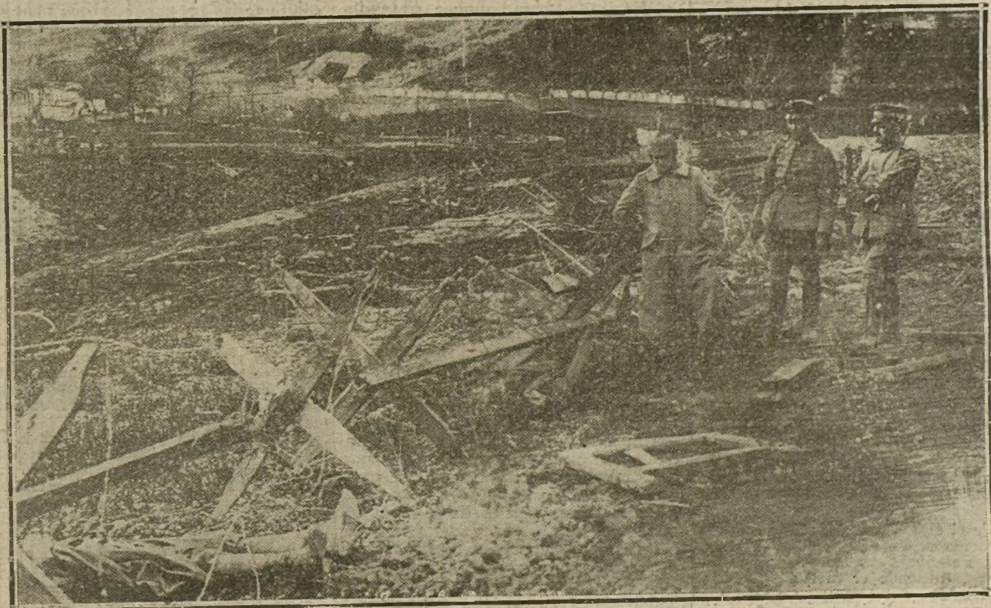
LA GUERRA EN ORIENTE.—Alambradas de una posición rusa cerca de Kowno, destruidas por las tropas alemanas, después de un sangriento combate.

«Si un organismo de cooperación compo- La es un Estado Mayor general divi-