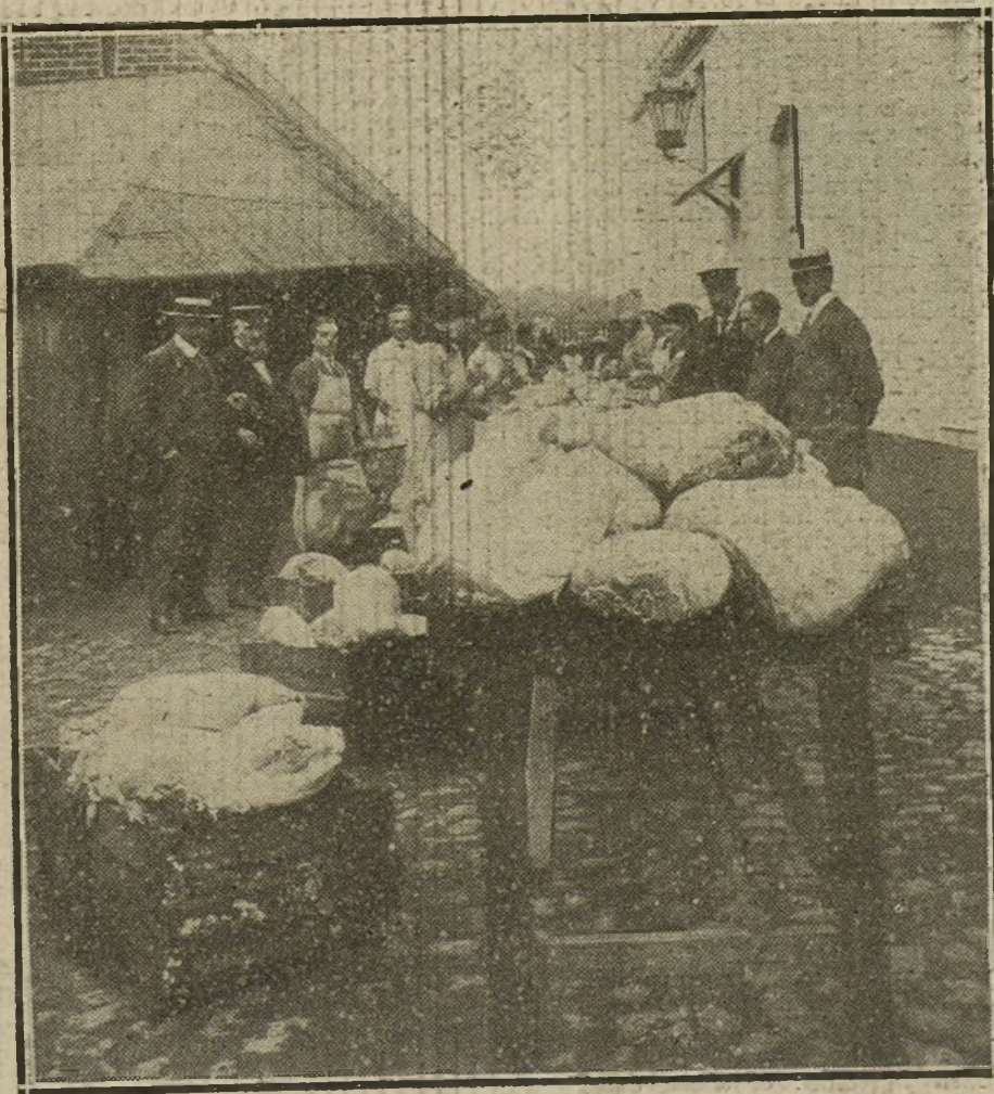
Empleados de la fábrica de conservas de Lohmann en Lubeca disponiendo la carne para la preparación de conservas.

Para todo lo referente a publicidad francesa en LA TRIBUNA, dirigirse a nuestra Agencia en París: 22, Rue Vivienne, 22.