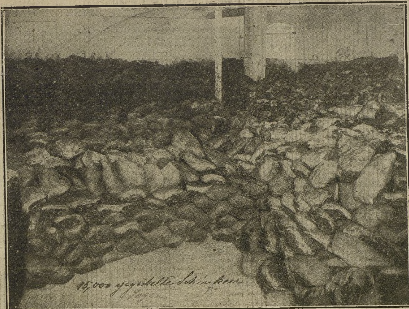
15.000 jamones en uno de los depósitos de la fábrica de conservas de Lohmann en Lubeca.

NUMERO DEL TELEFONO DE LA ADMINISTRACION DE «LA TRIBUNA» (PLAZA DE CANALEJAS, 6): 5.55