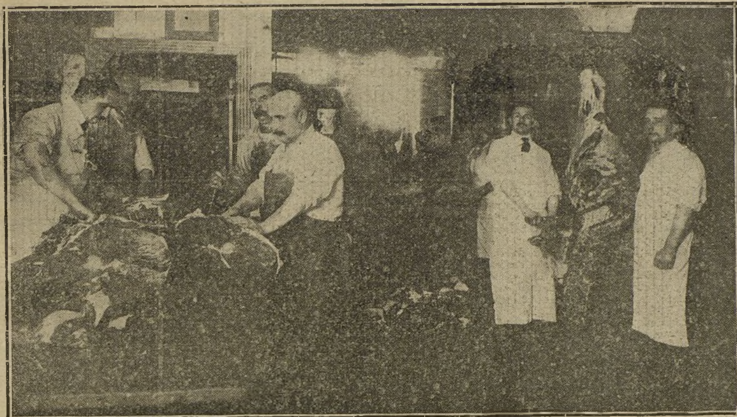
Operarios distribuyendo las raciones de carne en la fábrica de conservas, donde diariamente se sacrifican cien vacas.

vanece en el espacio caliginoso? El trillador no puede cantar de otra manera; el compás de su trabajo marca el ritmo de la canción; todo canta y se mueve conforme: si canta fuerte, hasta las bestias tiran más; si se calla la voz, se detiene el tiro. Y el ritmo cambia según el trabajo. El trabajo de arrastre tiene su ritmo; el de elevación, también; tienen su canción los tejedores, los molineros... Cuando el trabajo es monótono ó sin compás, en vez de música se lee, como ocurre entre los tabaqueros de América, ó se reza, como yo he visto entre las mujeres de las fábricas de Alcoy, ocupadas en reparar las piezas de tela.