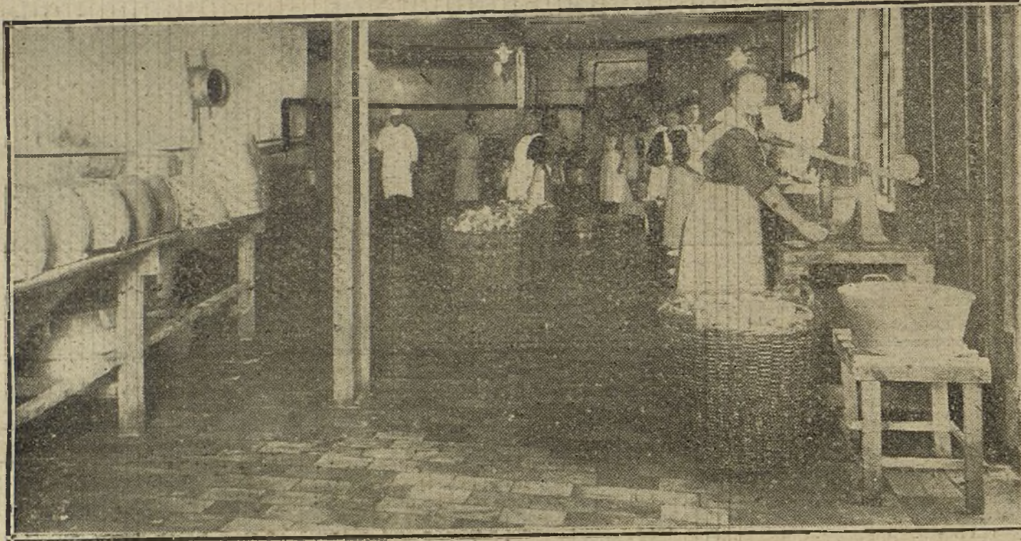
Mujeres alemanas preparando los botes de conservas.

¿No ha oído contar el lector alguna vez las virtudes de la frugalidad, el ejemplo de soldados que con unas cuantas galletas resacas y un trozo de bacalao por todo alimento resistían largas jornadas? Con un poco de exaltación imaginativa, se llegaba á creer que la sobriedad era una fuente de resistencia; mas, ¡ay!, no piensan lo mismo los fisiólogos, los cuales demuestran que no hay energía corporal si en la alimentación no abundan las substancias ricas en albúmina, grasa é hidrocarburo, elementos constitutivos de fuerzas de trabajo que se reducen á unidades de calor, á calorías, y los alimentos que más riqueza contienen de estos elementos productores de calorías, son las carnes, substancias grasas y algunas legumbres, como los