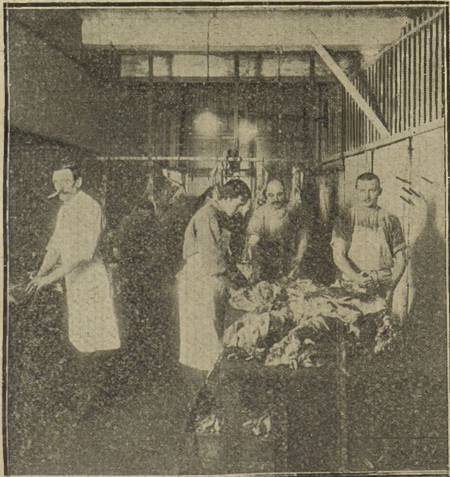
Preparando la carne de vaca para su conservación.

En unos departamentos, vi cómo se descuartizaba el cuerpo entero de las