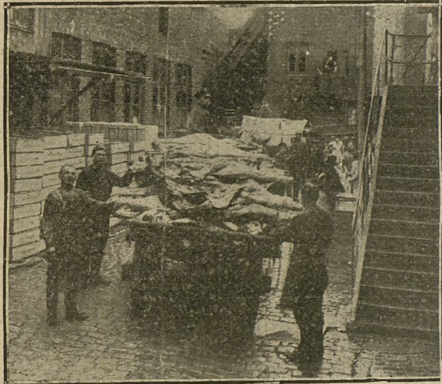
Traslado de la carne ya preparada.

Al terminar el discurso el Sr. Martínez, tributósele una cariñosa ovación, en la que tomaron parte los concejales y el numeroso público que asistió al acto. Contestáronle los jefes de las mino-