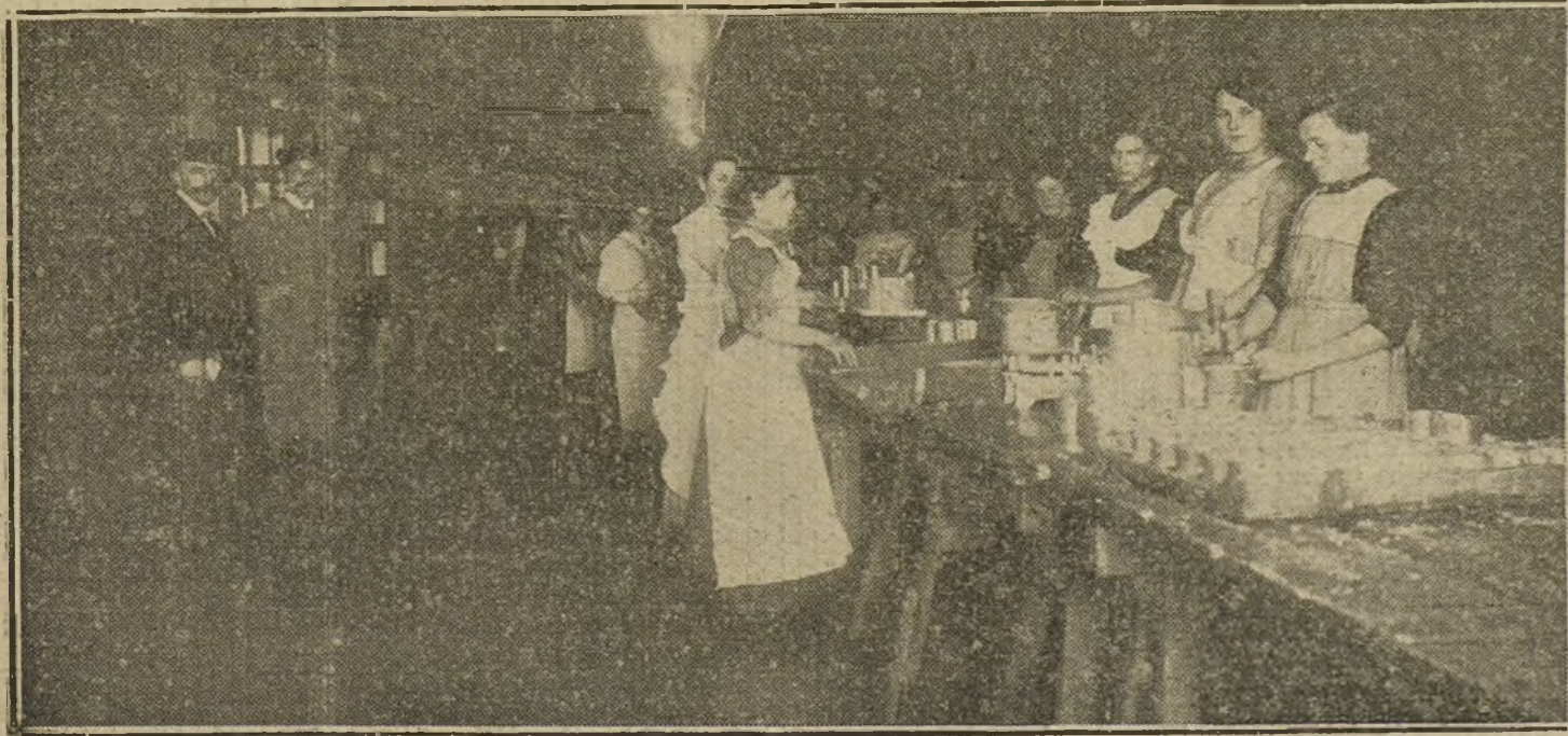
Otra sección de mujeres en la fábrica de conservas. Operación de llenar los botes.

—El Ayuntamiento de Toledo ha elevado una instancia al presidente de la Junta del centenario pidiendo se adquiriera por el Estado y se declare monumento nacional el antiguo mesón del Sevillano, en el que se desarrolla la novela ejemplar de Cervantes «La Ilustre Fregona».