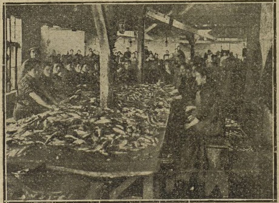
Operación de quitar las espinas á las sardinas para conservarlas en latas.

—Sí... sí... sí...—iba contestando con acento socarrón el rechoncho señor.