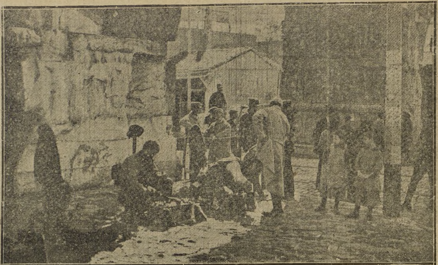
Aspecto de una de las calles de Salónica, invadida por los soldados franceses e ingleses.