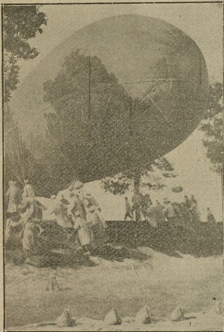
Tropas francesas disponiéndose a soltar un globo cautivo para observaciones en el frente del Norte de Francia.

El Gobierno inglés no se da cuenta de una manera suficiente, temo yo, de la «prisa que tenemos en Francia para acabar con esta guerra monstruosa». Nosotros sostendremos la lucha hasta el final, es decir, hasta la victoria total, a pesar de nuestra aversión a estas matanzas; pero no ocultamos el hecho de que «tenemos prisa por ver el epílogo». Nuestros amigos de Inglaterra deberían entender que desde hace diez y ocho meses hay en Francia de cinco a seis millones de hombres movilizados; que esto constituye un esfuerzo sobrehumano, y que deseamos que no se nos hagan imposiciones por más tiempo que el estrictamente necesario. Ahora bien; un hombre de inteligencia mediana comprenderá que, abandonando a los serbios y a Salónica, permitiríamos a los alemanes establecer una comunicación directa y definitiva entre la Alemania del Norte y