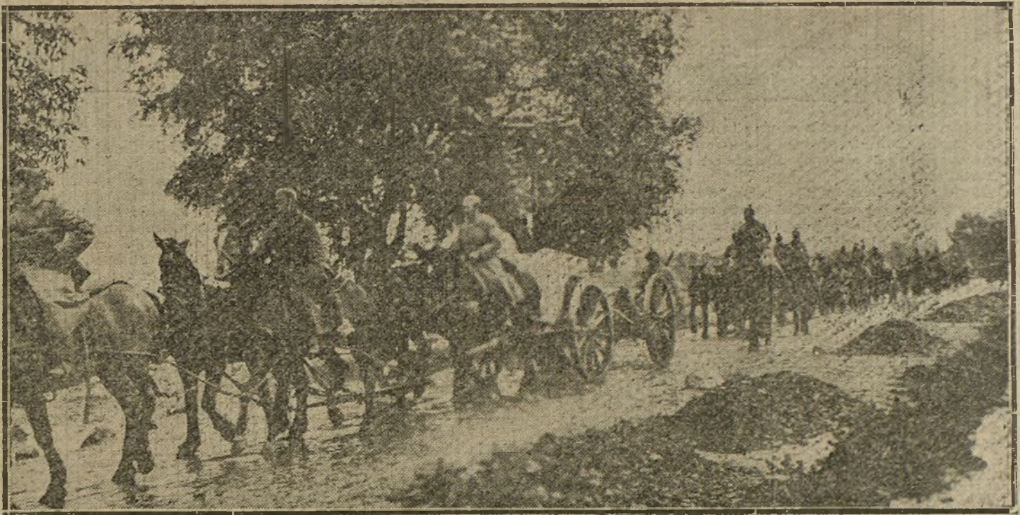
LAS OPERACIONES EN ORIENTE.—Avance de la artillería alemana por los caminos pantanosos de Dunaburg.

Este señor alegre que se entrega á tales manifestaciones de entusiasmo, ignora—como otros muchos—que precisamente el secreto de la táctica alemana estriba en la economía de todos sus medios de defensa, y que las medidas, prudentísimas por cierto, que acaba de dictar ahora el Gobierno federal, nos dan manifiesta prueba de la voluntad inquebran-