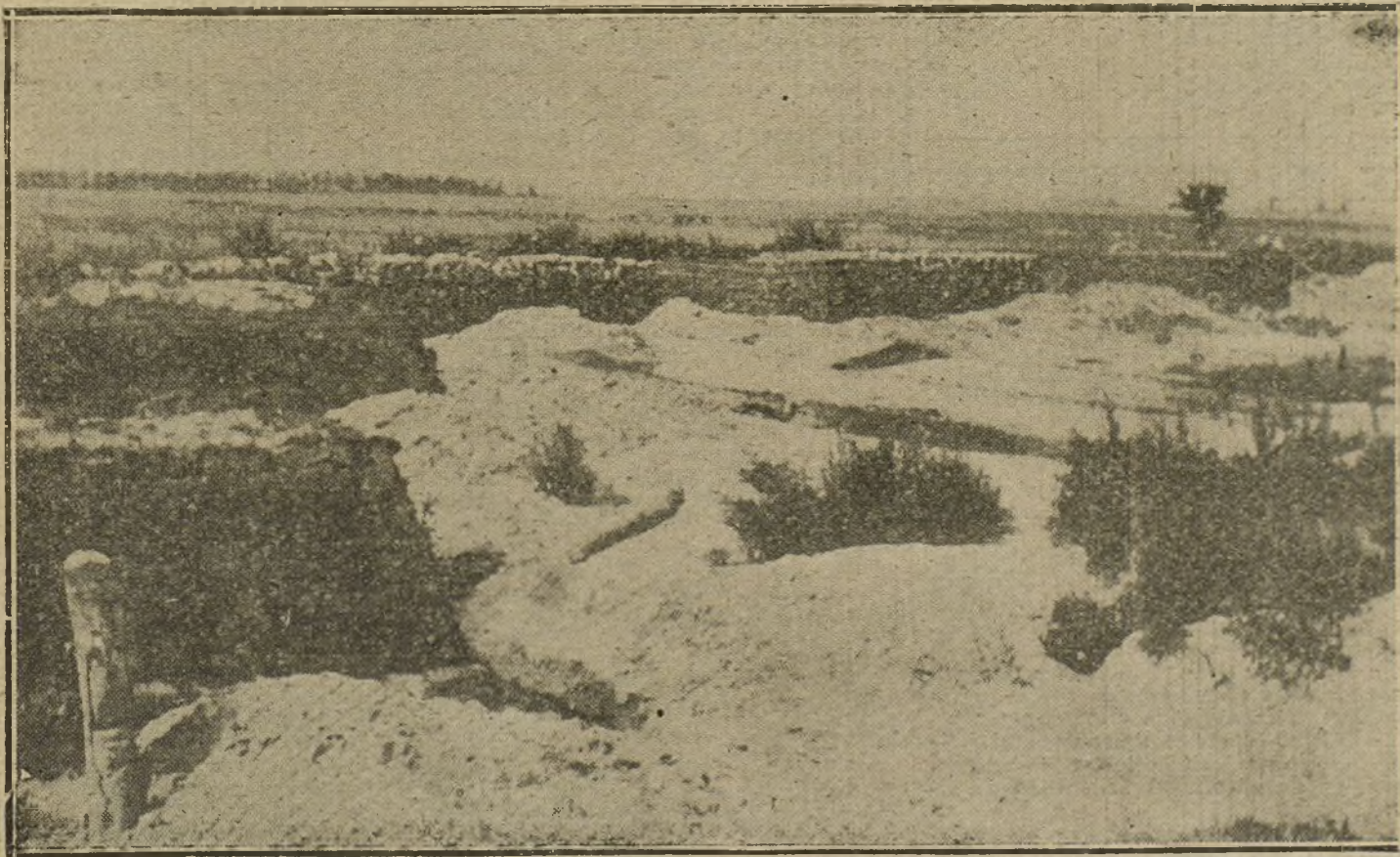
LA GUERRA EN ORIENTE.—Trincheras y defensas rusas, abandonadas por las tropas del Zar después de un violento combate en la región Rowno.

PARA TODO LO REFERENTE A PUBLICIDAD FRANCESA EN «LA TRIBUNA», DIRIGIRSE A NUESTRA AGENCIA EN PARIS: 22, RUE VIENNE, 22