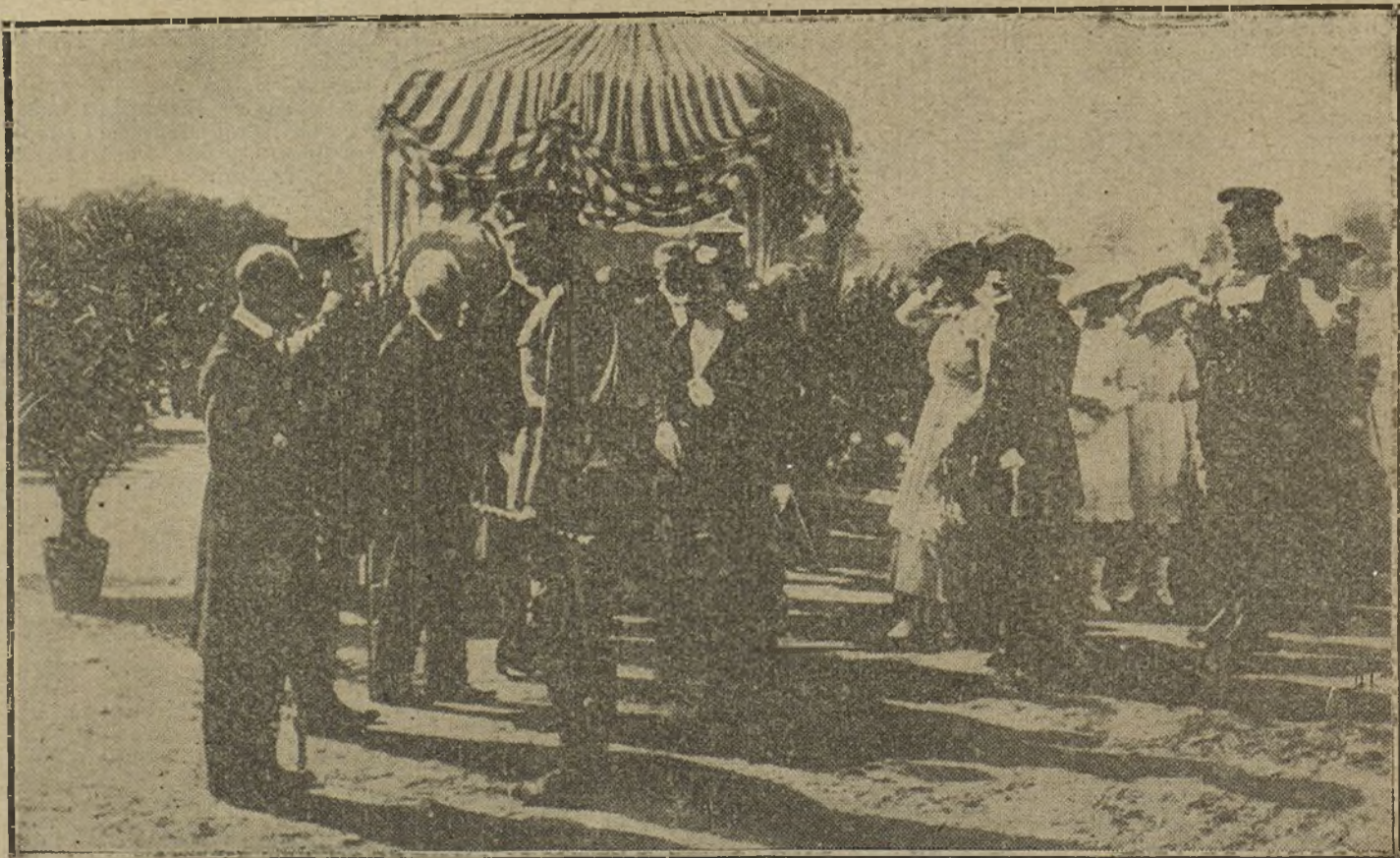
CIENCIA Y LA GUERRA.—El Rey Constantino de Grecia y la Reina Sofia, durante la fiesta patriótica celebrada recientemente para conmemorar la toma de Salónica.