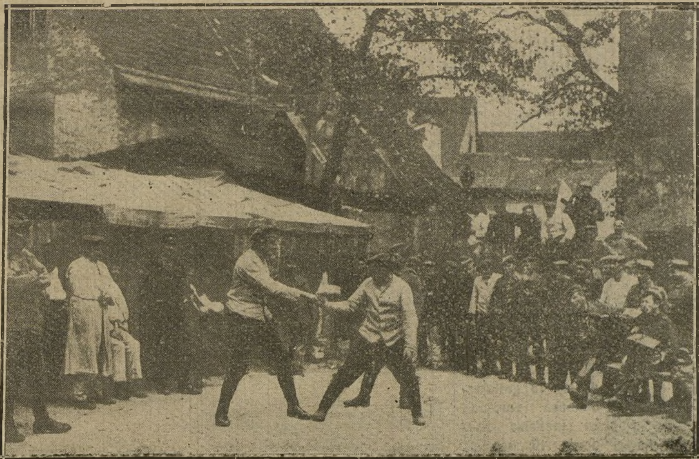
ENTRE COMBATE Y COMBATE.—Diversiones de los soldados bávaros en un día de descanso, detrás de la línea del frente.